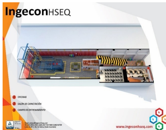
Figura 2 Plano de Infraestructura

Ingecon, realiza inspecciones y mantenimientos de andamios y equipos de alturas, capacitaciones en espacios confinados, primeros auxilios, trabajo seguro en alturas avanzado, reentrenamiento y coordinador, también realiza cursos y trámites para licencias de conducción A1, A2, B1 y C1, recarga de extintores y suministro de dotación, consultoría y asesoría de gestión.