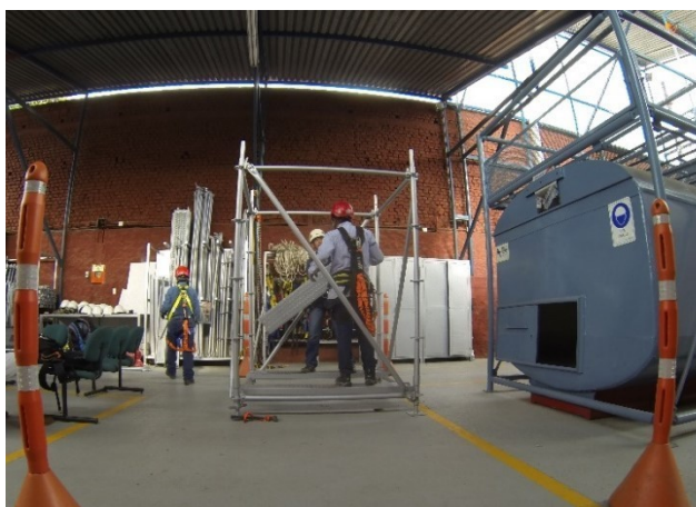
Figura 3 Espacios confinados

Ingecon, realiza inspecciones y mantenimientos de andamios y equipos de alturas, capacitaciones en espacios confinados, primeros auxilios, trabajo seguro en alturas avanzado, reentrenamiento y coordinador, también realiza cursos y trámites para licencias de conducción A1, A2, B1 y C1, recarga de extintores y suministro de dotación, consultoría y asesoría de gestión.