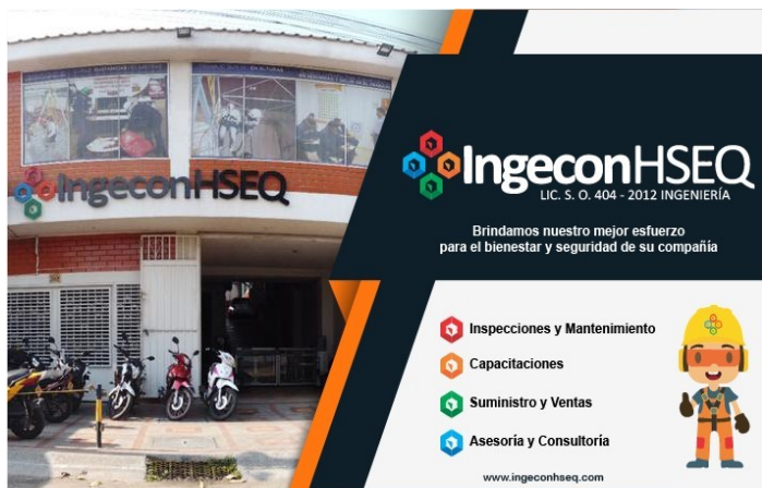
Figura 1 Ingecon HSEQ

La empresa empezó con unos pocos andamios, armando su propia torre de entrenamiento de trabajo seguro en alturas. Luego habilita la actividad económica de escuela de conducción.