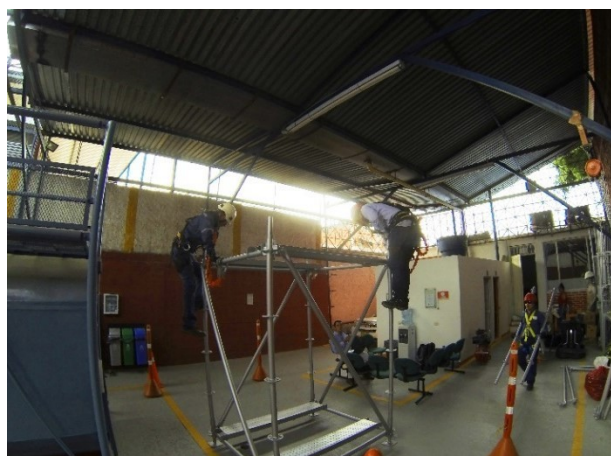
Figura 4 Campo de alturas