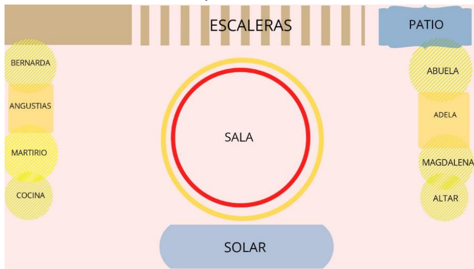
Ilustración 15. Propuesta de iluminación