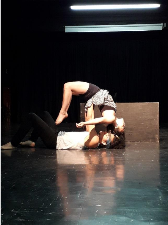
Fotografía 8. Ejercicio con acrobacia.

En algunos de los grupos la idea de incluir acrobacia en la escena era el pretexto perfecto para subir la energía y darle sentido a sus cuerpos en escena; algunas de las figuras que se propusieron simbolizaban lo que con sus palabras decían, lo que era funcional. Gracias a esto muchas de las propuestas se tornaron más fluidas y entendibles, dando comprensión al texto y a lo que sus cuerpos hablaban; también se resaltó que el compromiso, empeño y amor que como artistas ponen a la hora de realizar un trabajo, hace que las cosas funcionen y avancen de una mejor forma, y aunque muchas veces el tiempo y la pereza los rodeen se deben comprometer con lo que se hace.