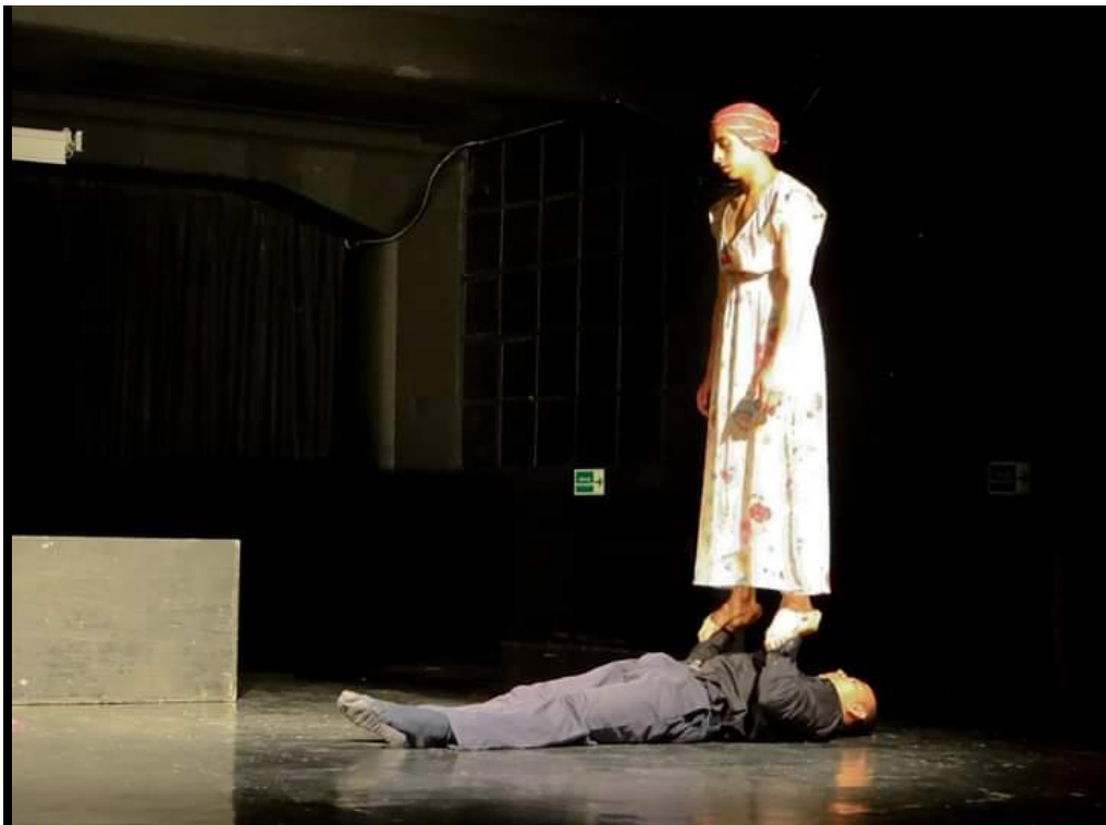
Fotografía 56 Presentación.