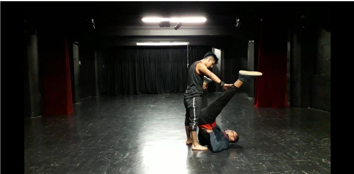
Fotografía 42 Ejercicio Escénico.