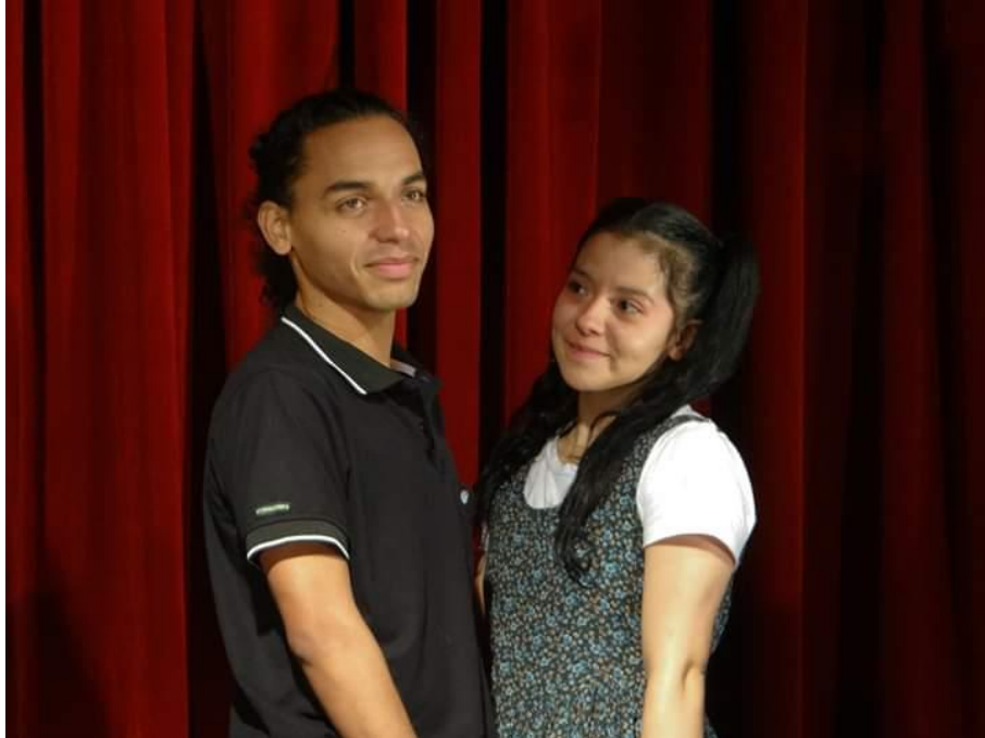
Fotografía 53 Presentación.