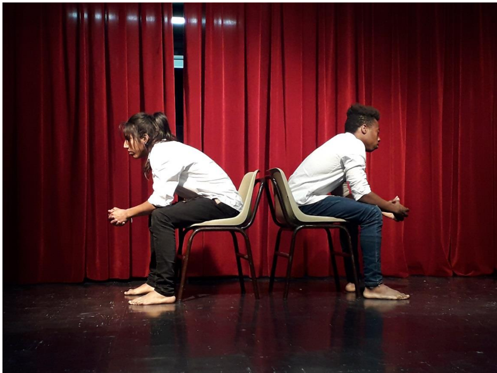
Fotografía 52 Ejercicio Escénico. Tomada por Vanessa Morales