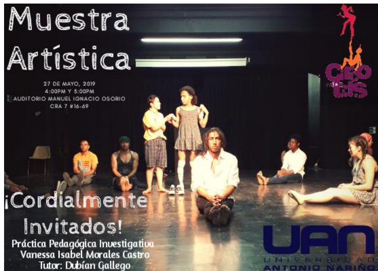
Ilustración 2. Tarjeta de invitación “Muestra Artística”