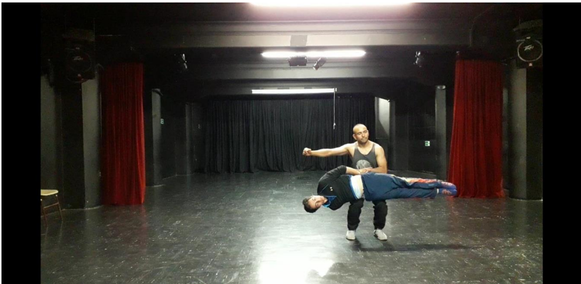
Fotografía 36 Ejercicio Escénico.