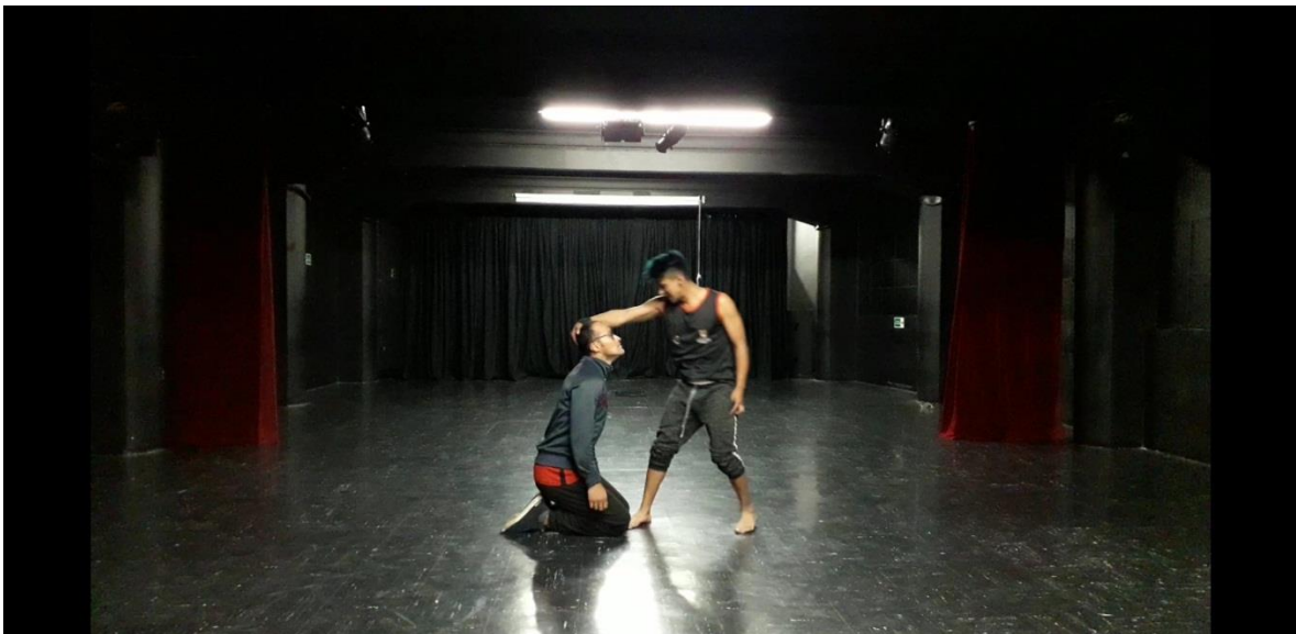
Fotografía 38Ejercicio Escénico.