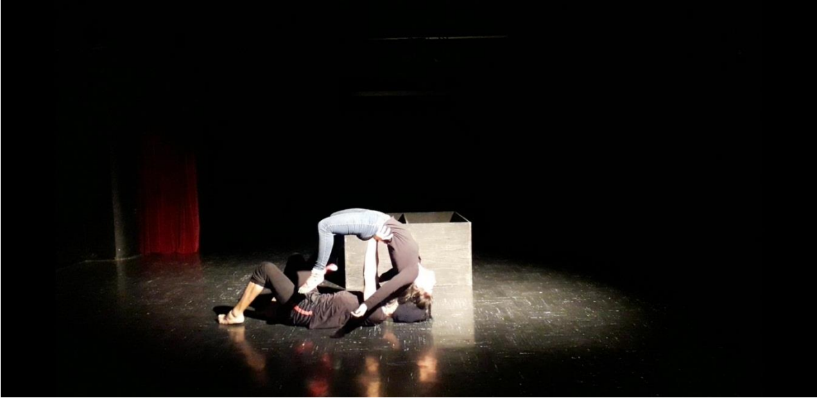
Fotografía 27 Ejercicio Escénico.