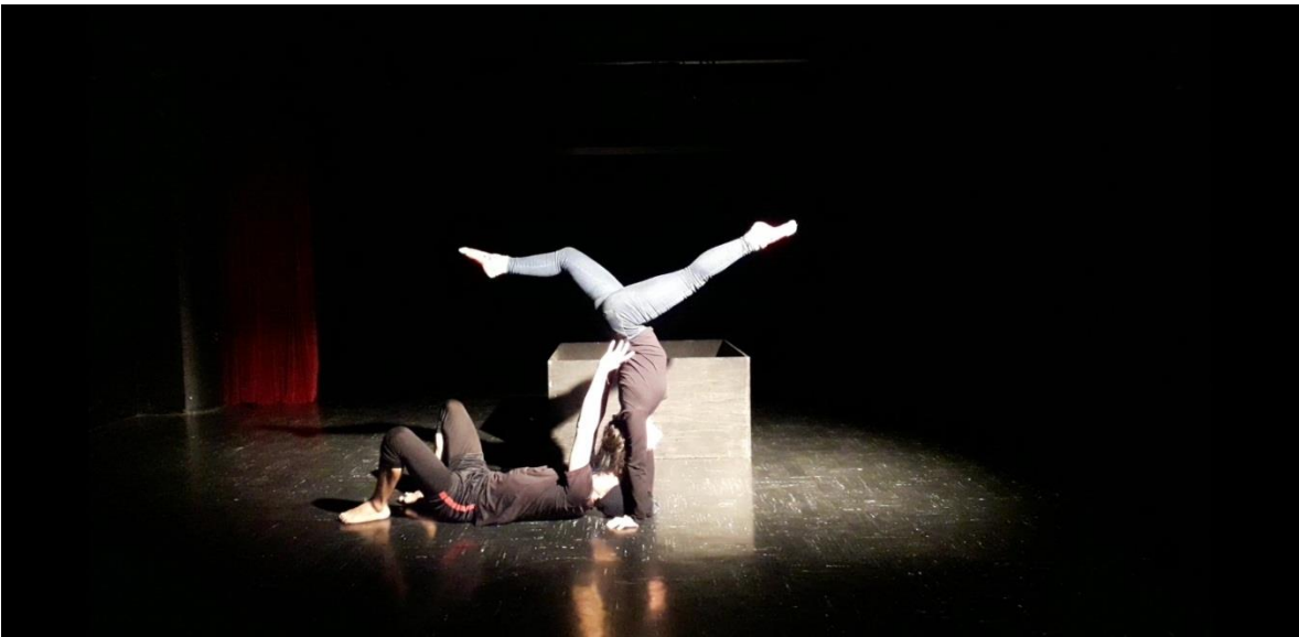
Fotografía 28 Ejercicio Escénico.