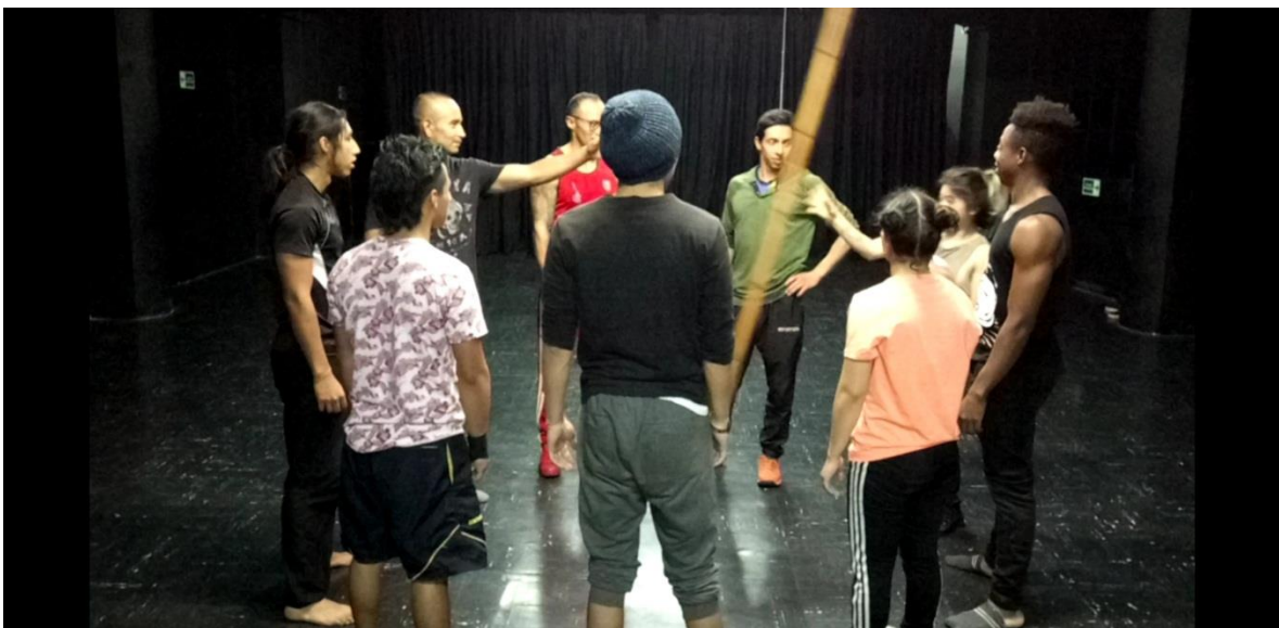
Fotografía 20 Ejercicio de Voz e Intensión.