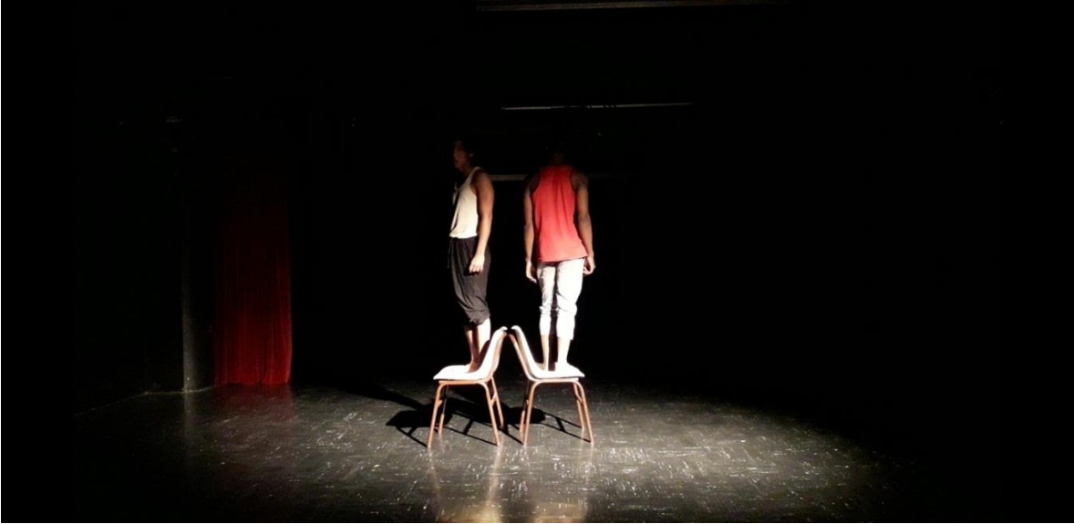
Fotografía 29 Ejercicio Escénico.