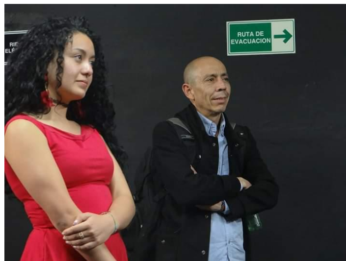
Fotografía 18. Presentación.

de que la docente en formación hablara de nuevo, pidió disculpas por ser una llorona, pero agradeció a todos por estar allí, agradeció a los chicos ya que sin ellos no hubiera existido proceso, agradeció por estar ahí.