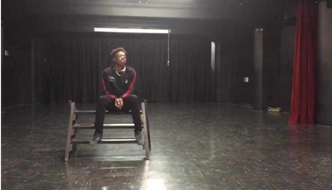
Fotografía 6. Ejercicio escénico.

La insatisfacción por esta clase fue muy notable por parte de la docente, que le recalcó a los chicos la importancia de cumplir con los trabajos, pues no basta con tener habilidades corporales espectaculares para ser un buen artista; también, hay que tener en cuenta que la responsabilidad y el compromiso con lo que se hace y los deberes que se deben cumplir, son algo que se debe destacar. Quizá en un futuro esto les sirva de lección, pues un acto como estos podría ser causal de la cancelación de un trabajo o evento que les pudo generar grandes oportunidades.