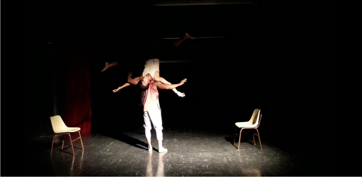
Fotografía 31 Ejercicio Escénico. Tomada por Vanessa Morales