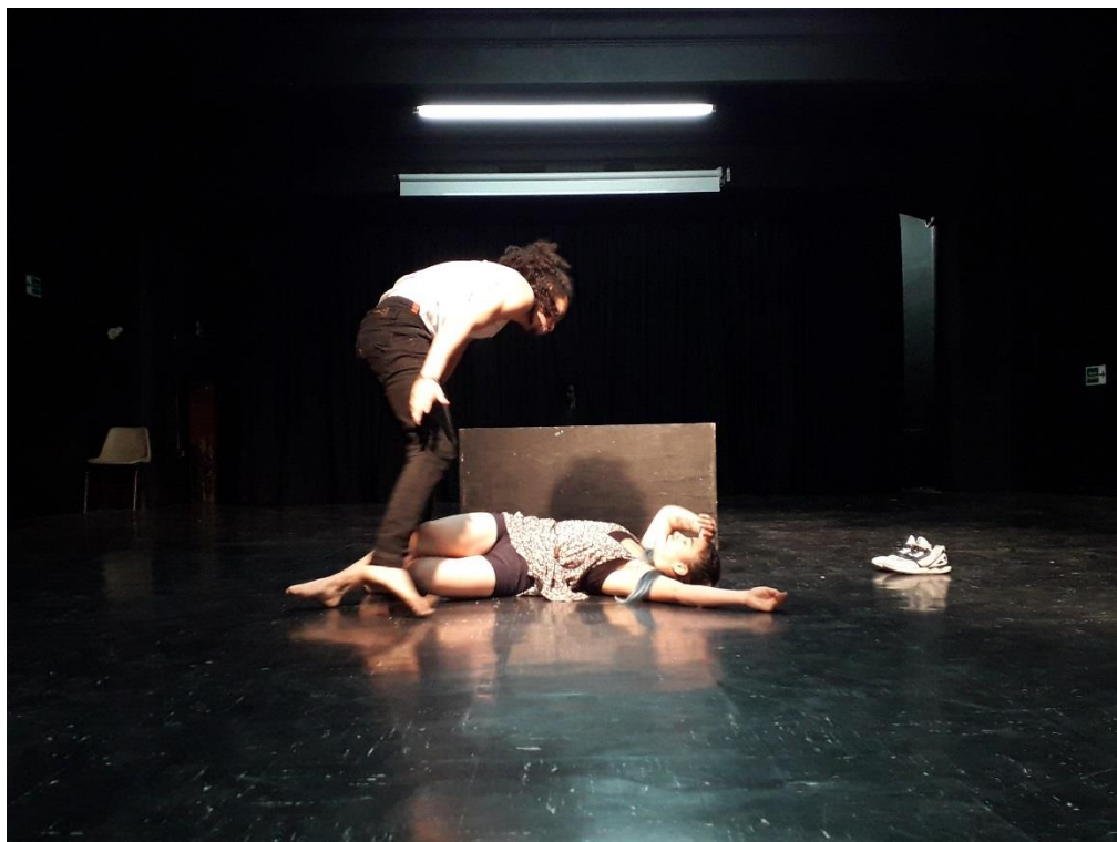
Fotografía 46 Ejercicio Escénico.