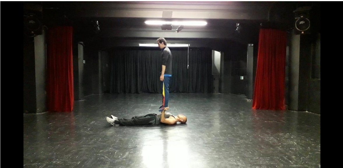
Fotografía 32 Ejercicio Escénico.