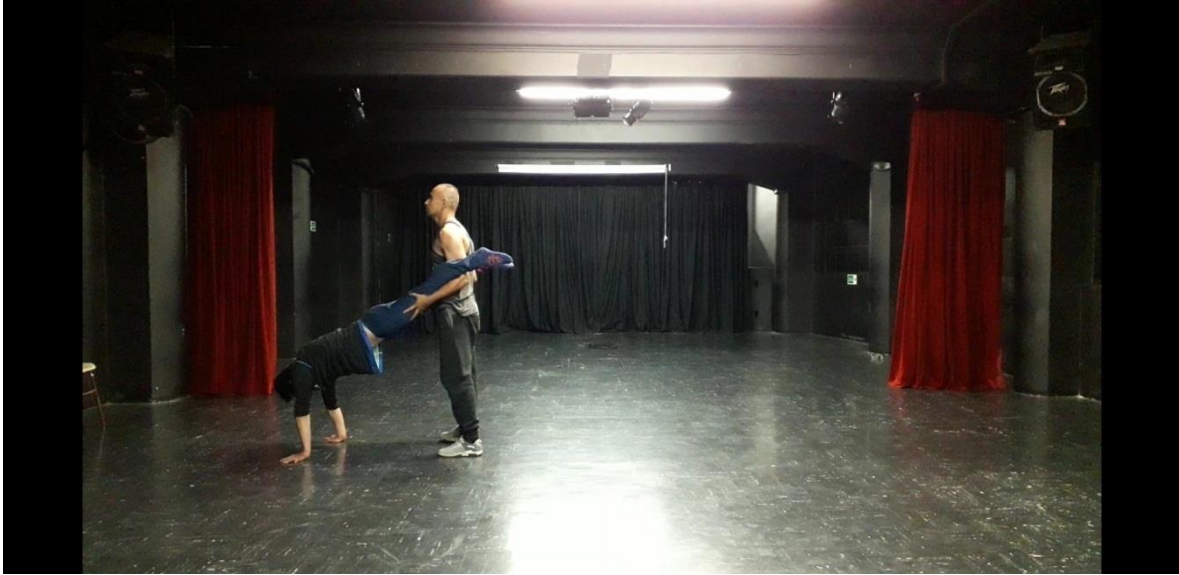
Fotografía 33 Ejercicio Escénico. Tomada por Vanessa Morales