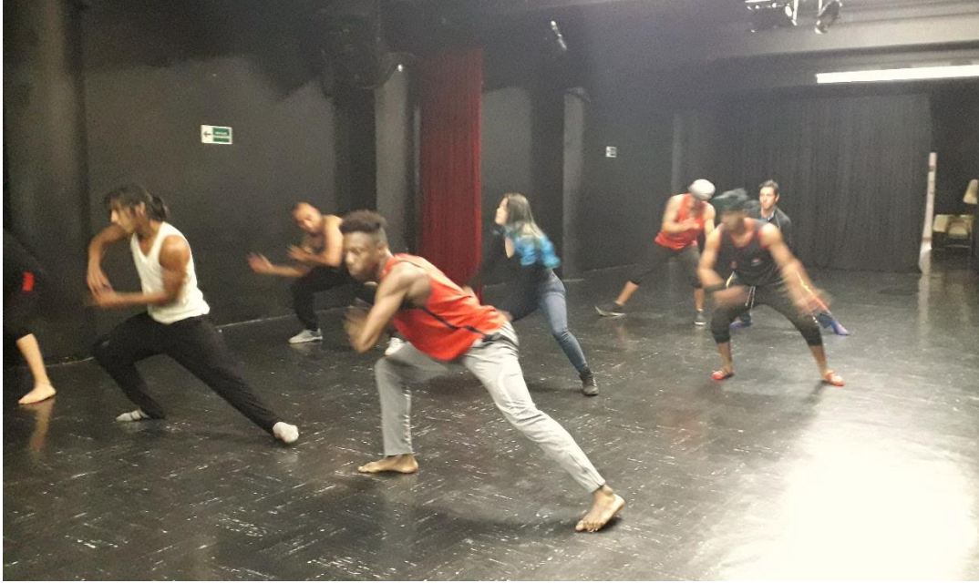
Fotografía 3. Partitura.

La idea de la partitura era reforzar la memoria corporal y crear conciencia de cada uno de los movimientos realizados; para ello está se mantuvo hasta el final del proceso, y se convirtió en un método de calentamiento antes de clase, más adelante, lo chicos propusieron que esta hiciera parte de la muestra final, lo cual era acertado para dar cuenta de todos los aspectos que se tocaron a lo largo del taller. En la secuencia se notaba la falta de coordinación entre los cuerpos y la música, quizá porque los movimientos no se encontraban afianzados y por ende los chicos olvidaban lo que seguía haciendo que el proceso se retrasara; aquí era evidente la falta de compromiso por el trabajo autónomo de los chicos, ya que como docente se puede deducir que los ejercicios solo se realizaban en la clase.