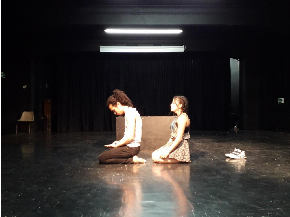
Fotografía 47 Ejercicio Escénico.