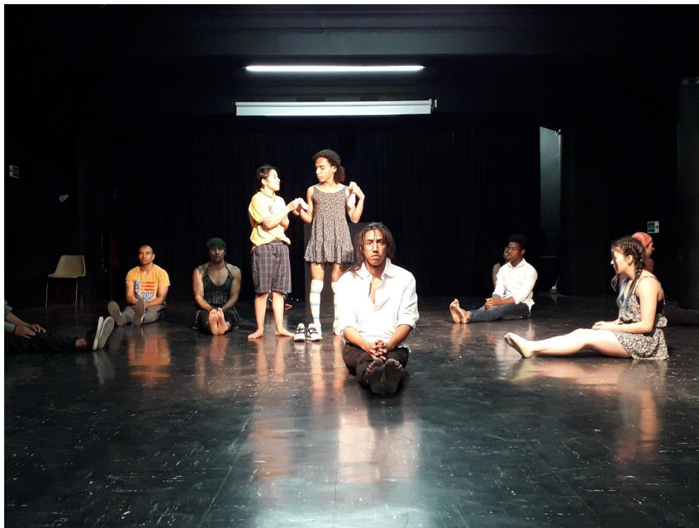
Fotografía 44Ejercicio Escénico.