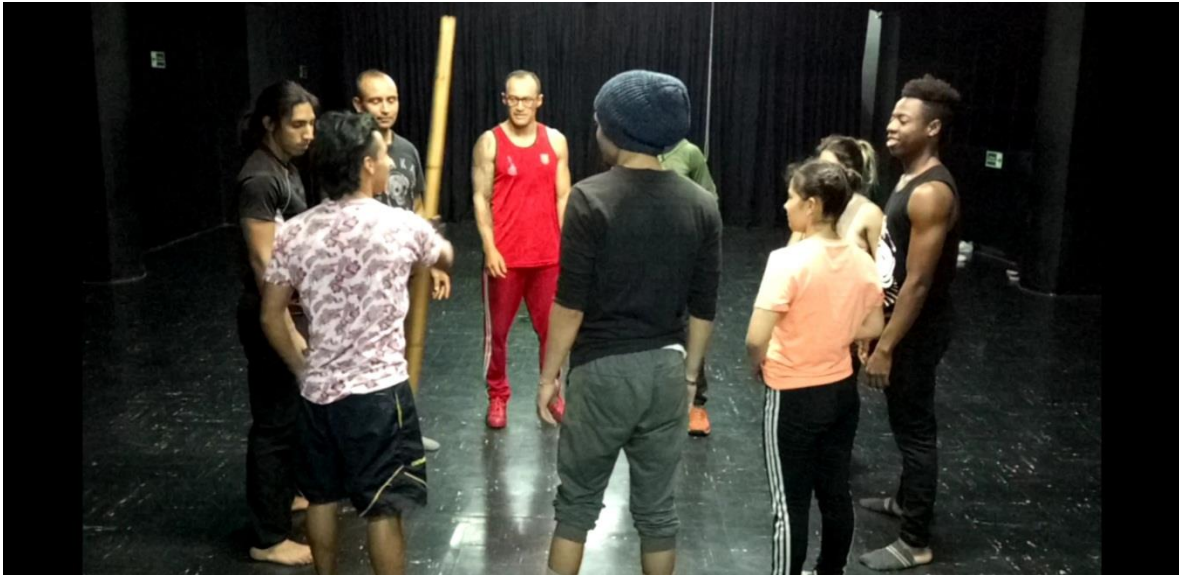
Fotografía 19 Ejercicio de Voz e Intensión.