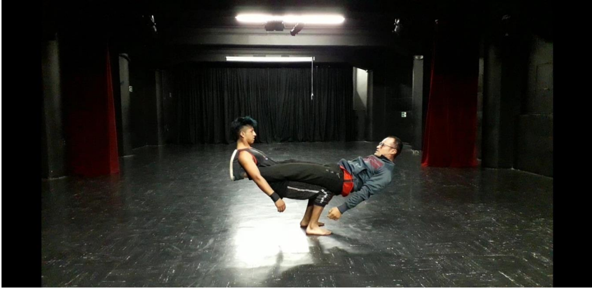
Fotografía 43Ejercicio Escénico. Tomada por Vanessa Morales