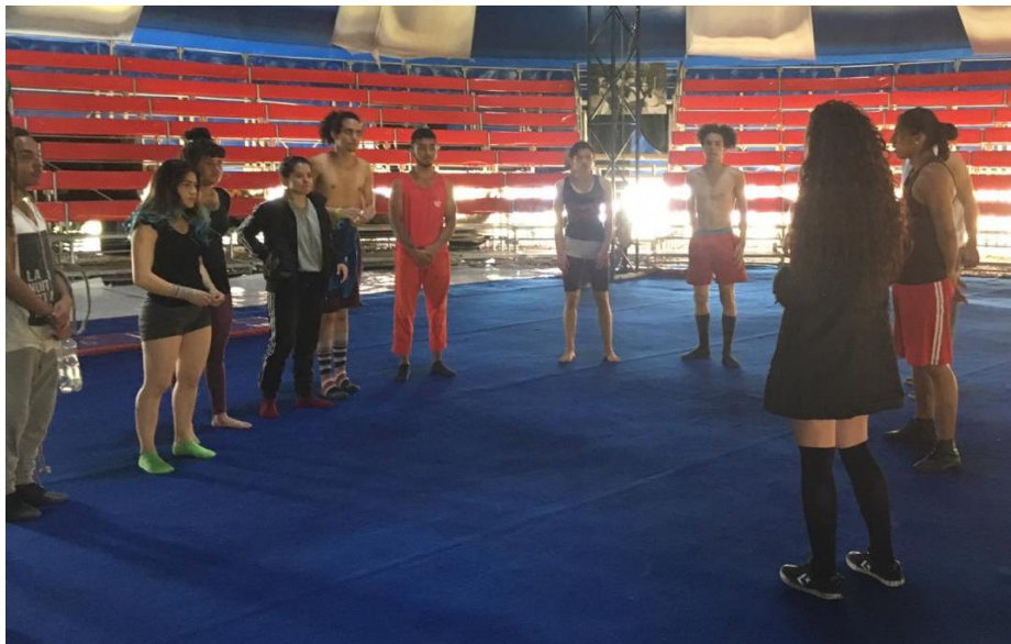
Fotografía 1. Primer encuentro.

Le Resultó un tanto frustrante no poder realizar algunos de los ejercicios que ellos propusieron, pues como estudiantes de danza y teatro se deberían tener cualidades acrobáticas básicas, como bien se habla en el ensayo de Stanislavski, (2009), en donde el autor sugiere que los artistas que entienden y desarrollan el arte de la acrobacia están mejor preparados y tienen mayores habilidades; es aquí donde ella replanteó el trabajo que debía realizar con ellos, pues la idea era brindar herramientas de las que ellos carecieran y fortalecer sus habilidades artísticas desde puntos en los cuales me desempeñara mejor.