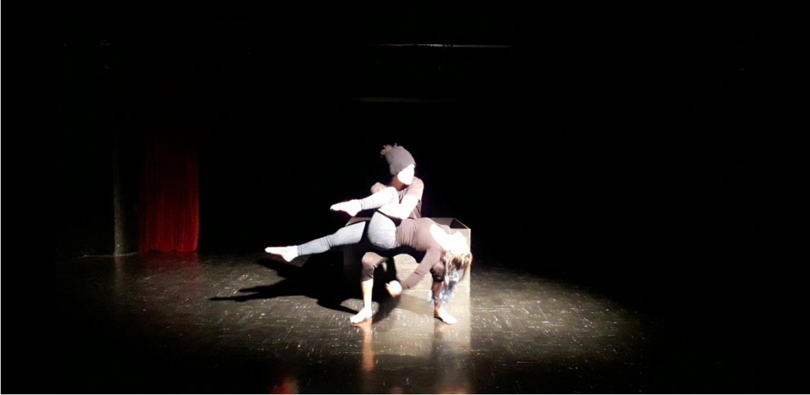
Fotografía 25 Ejercicio Escénico. Tomada por Vanessa Morales