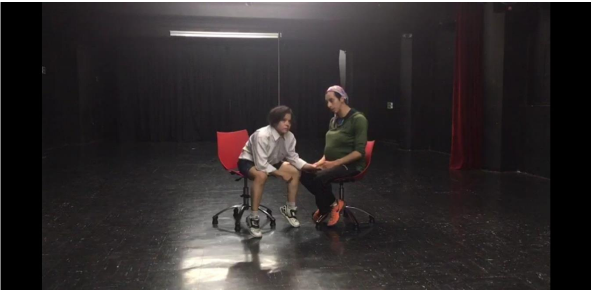
Fotografía 22 Ejercicio Escénico.