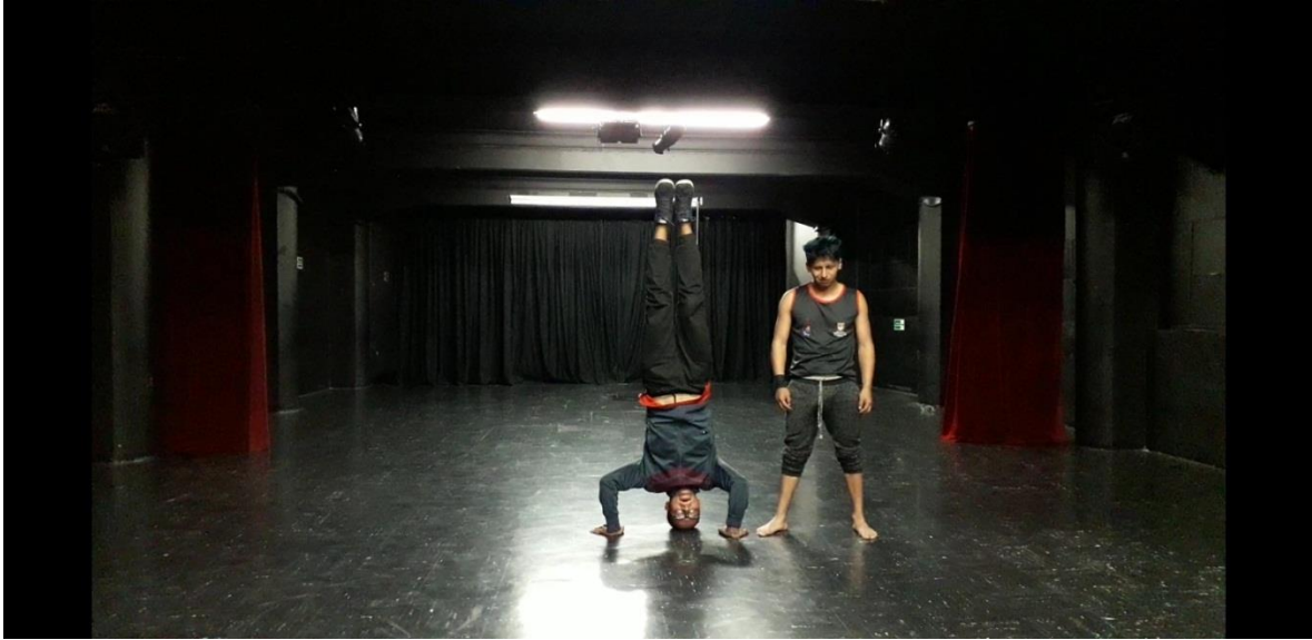
Fotografía 39 Ejercicio Escénico.