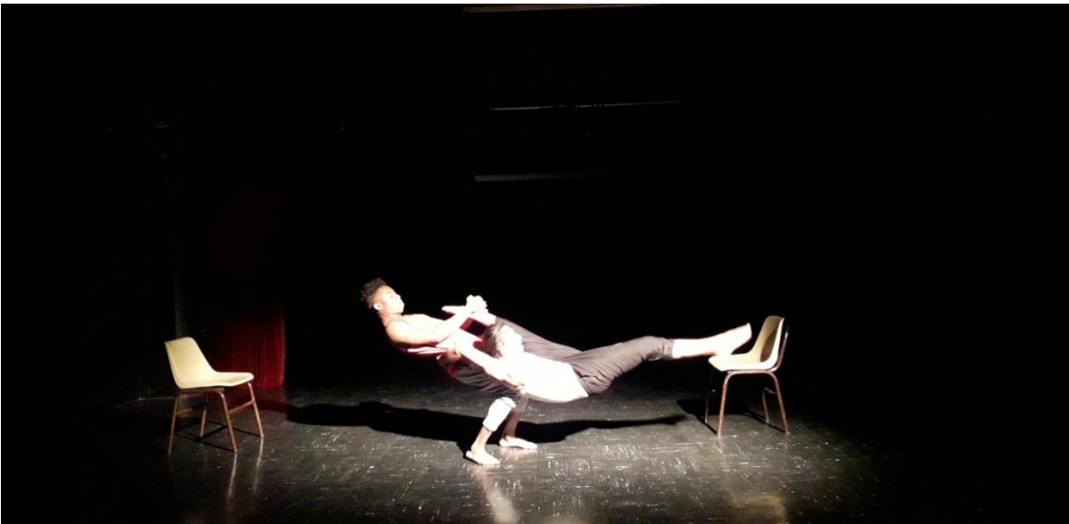
Fotografía 30 Ejercicio Escénico.