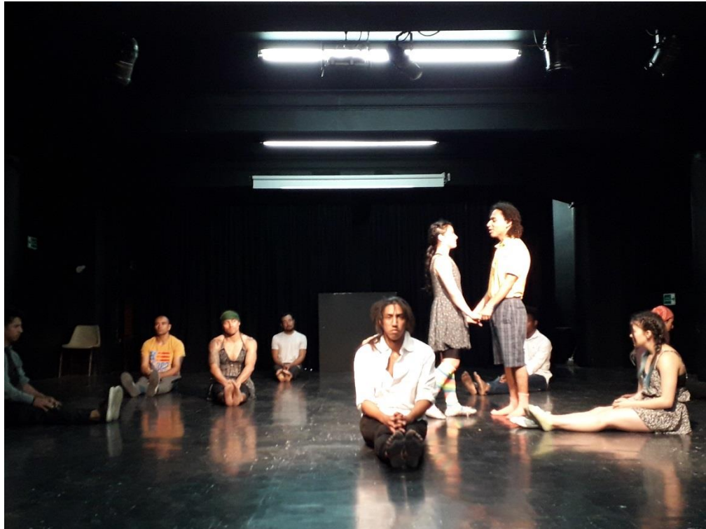
Fotografía 45 Ejercicio Escénico. Tomada por Vanessa Morales