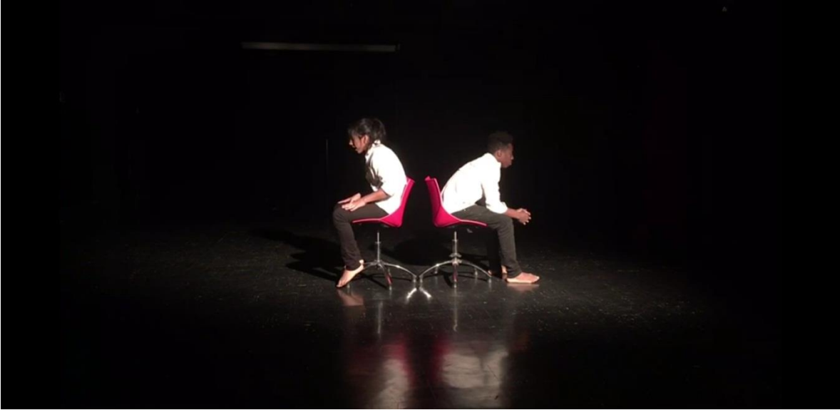
Fotografía 23 Ejercicio Escénico.