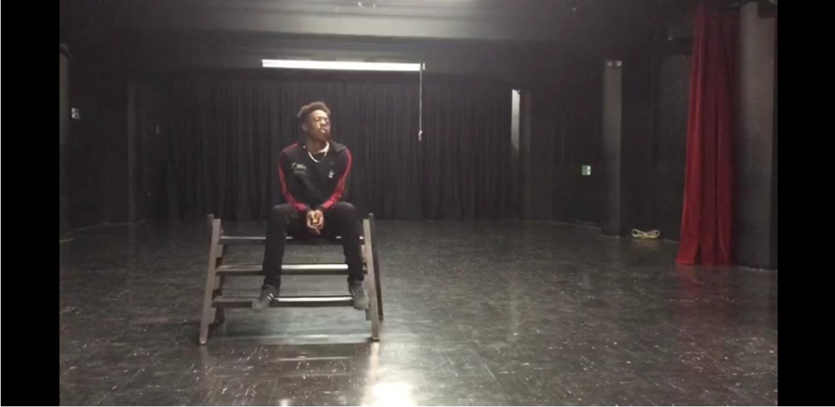
Fotografía 21 Ejercicio Escénico. Tomada por Vanessa Morales