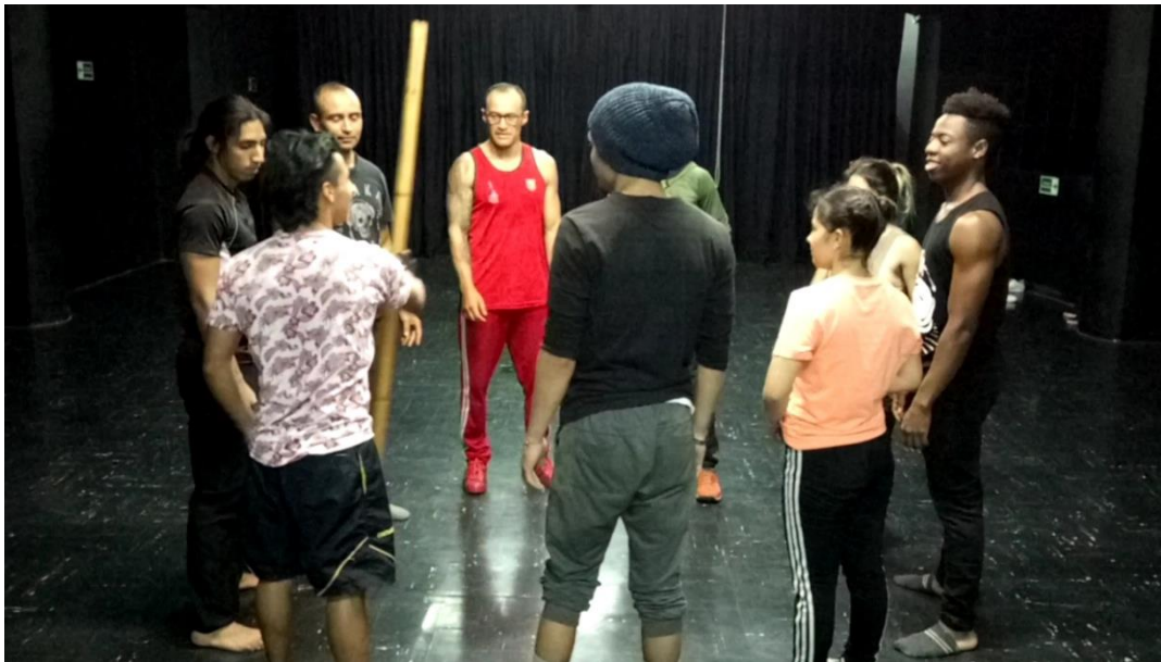
Fotografía 10. Ejercicio “Voz e Intención.

Cuando ya se había escogido la obra, se propusieron un par de clases con la intención de entrenar a los chicos, para ello se hizo una caminata por el espacio empezando a susurrar una parte de los textos que ya existían, la docente con mano indicaba el volumen que debían tener: si la mano estaba arriba el sonido debía ser alto y si la mano estaba abajo este debía ser lo más bajo posible, además, ellos debían tener en cuenta que en la caminata debían cubrir todos los espacios y centrarse en las instrucciones que se les daban, más tarde, se agregó un palo al juego cambiando un poco las reglas, pues ahora el que tenía el palo decía su frase y lo lanzaba a uno de sus compañeros, debía existir contacto visual y concentración entre ellos y si el palo se caía debían hacer sentadillas todos.