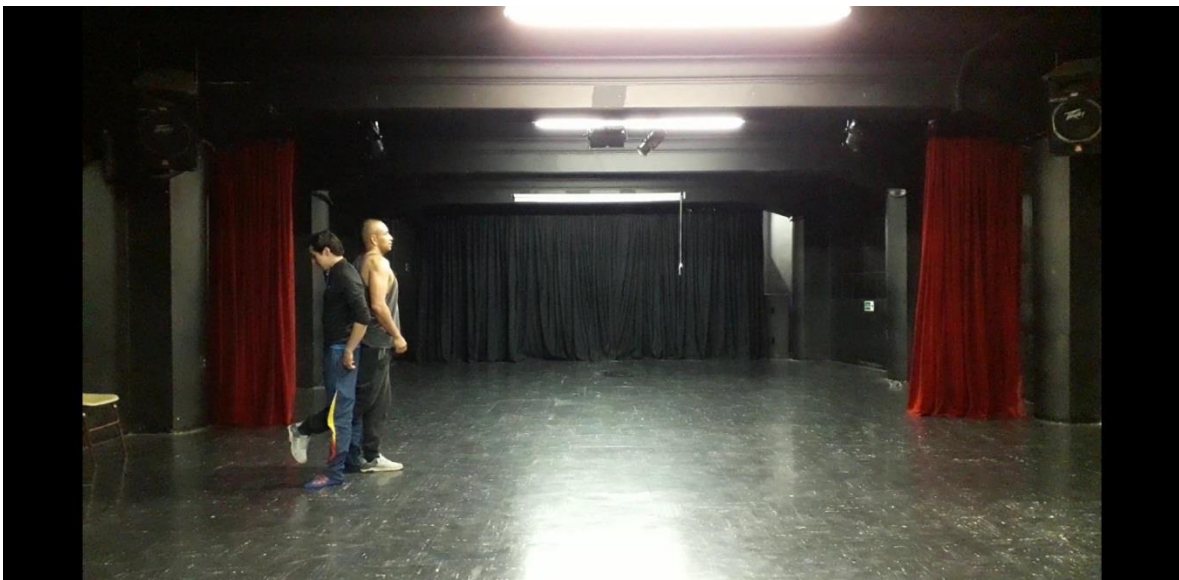
Fotografía 34 Ejercicio Escénico.