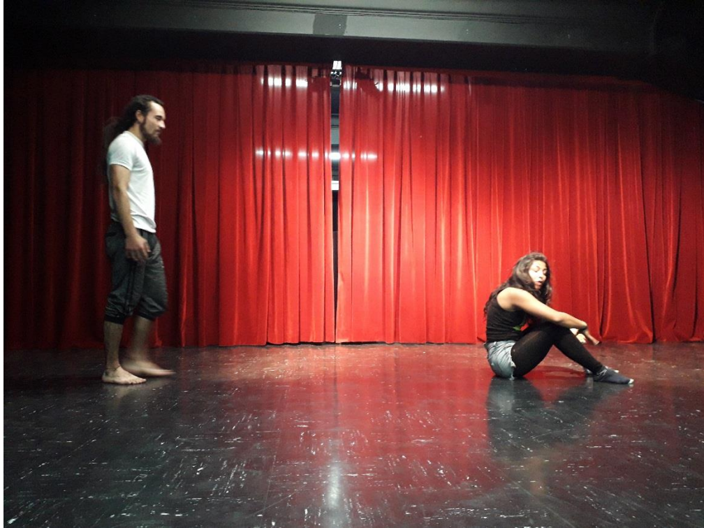
Fotografía 51 Ejercicio Escénico.