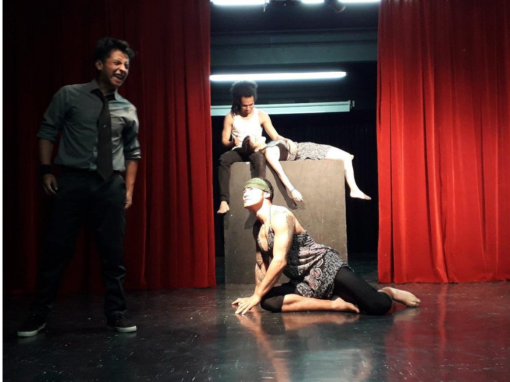
Fotografía 49 Ejercicio Escénico.