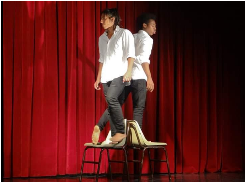
Fotografía 62 Presentación.