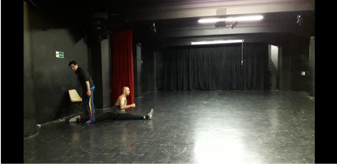
Fotografía 35 Ejercicio Escénico.