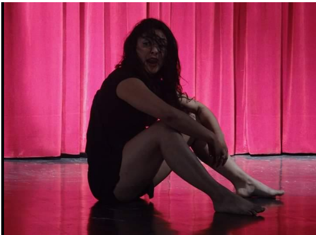
Fotografía 60 Presentación.