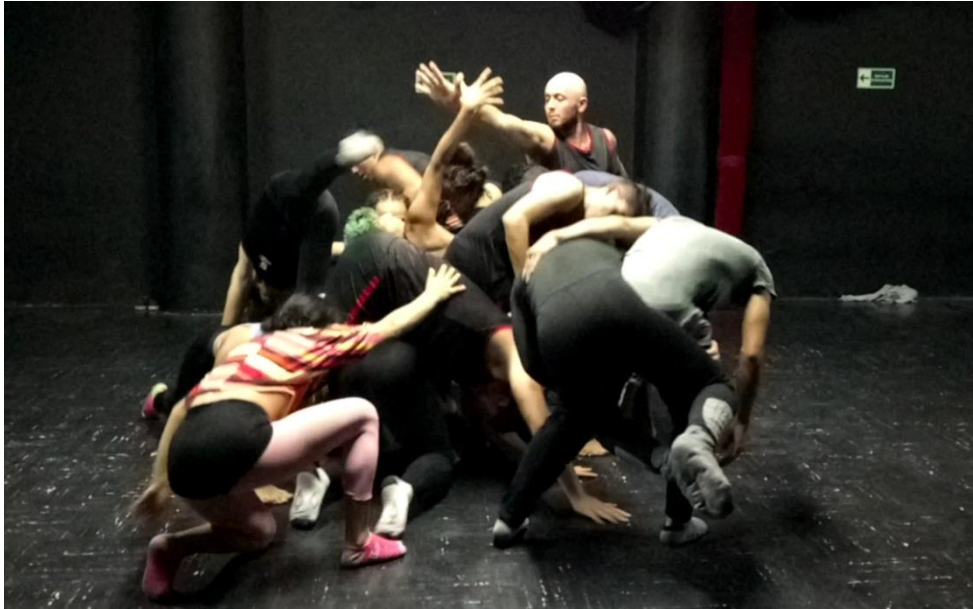
Fotografía 5. Danza Contact.

Continuando con la innovación de clases, un día se propuso la danza contact caracterizada por la práctica de “ Movimiento a través del contacto entre dos o más cuerpos, dando lugar a un juego de diálogo entre las personas donde en vez de hablar con la palabra se conversa y se relaciona a través del cuerpo ” (Sattva, 2016). Para esta actividad se propuso dos juegos “esculpir” y “seguir”; el primero consistía en realizar parejas, una cumpliría la misión de ser la masa y el otro el escultor, el objetivo de este último era moldear y transformar el cuerpo de su compañero a través de toques por su cuerpo, proponiendo movimientos en él. Y la otra actividad consistía en guiar a un compañero cuidando de él por todo el espacio, proponiéndole distintos niveles “alto, medio y bajo”, estos juegos se realizaron en parejas y en grupos de tres, promovían la escucha, la concentración, la confianza y el cuidado por el cuerpo.