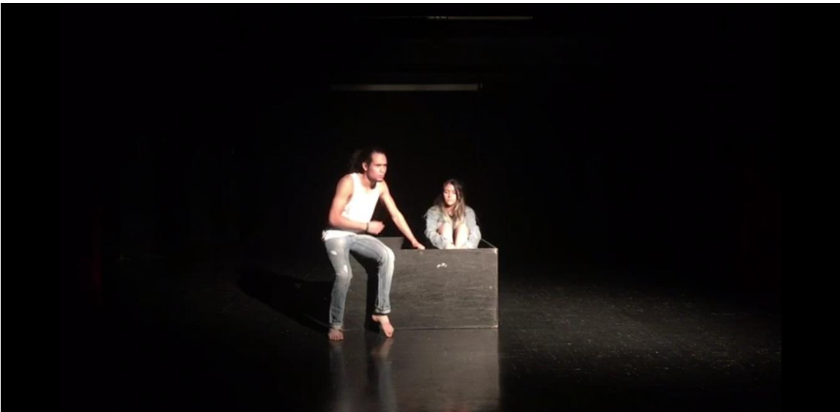
Fotografía 24 Ejercicio Escénico. Tomada por Vanessa Morales