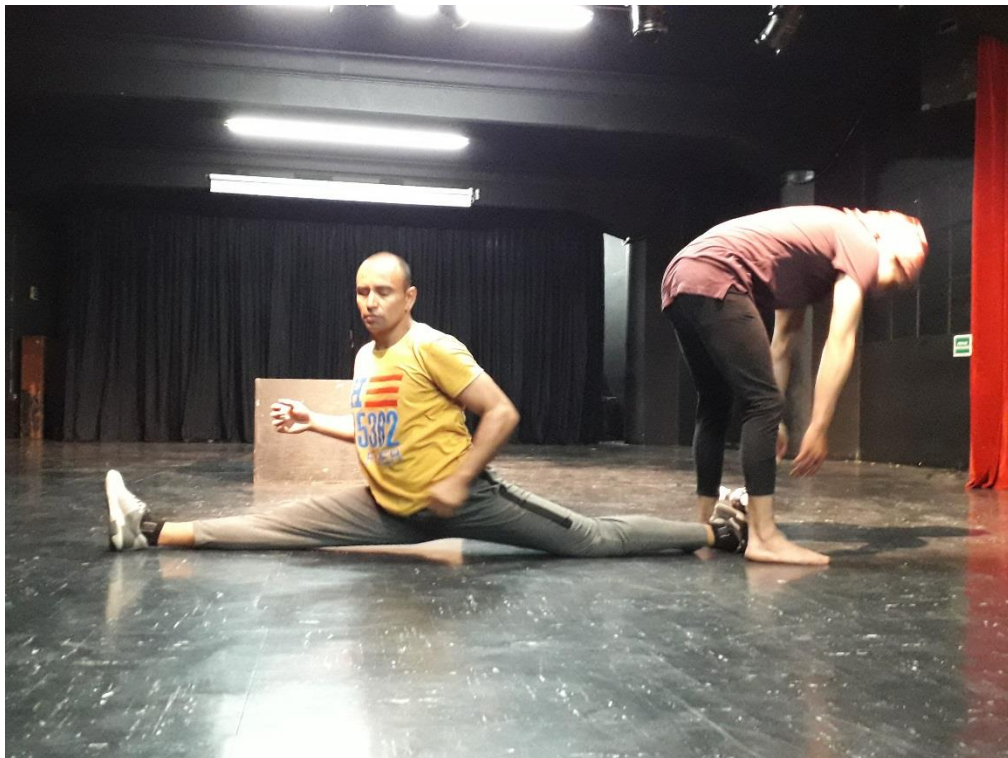
Fotografía 48 Ejercicio Escénico.