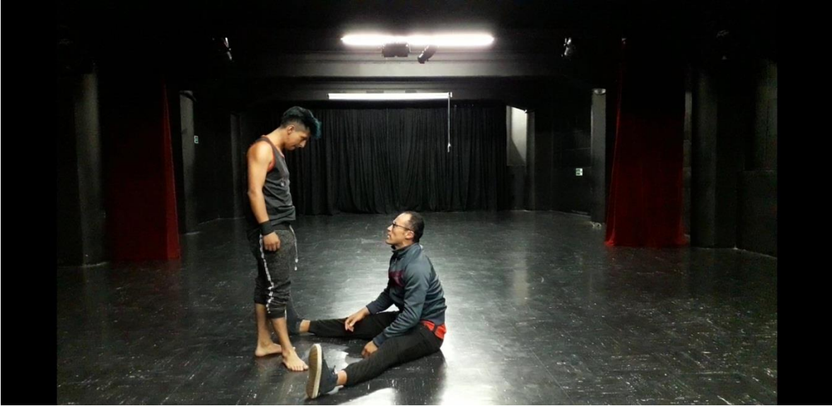
Fotografía 41 Ejercicio Escénico.