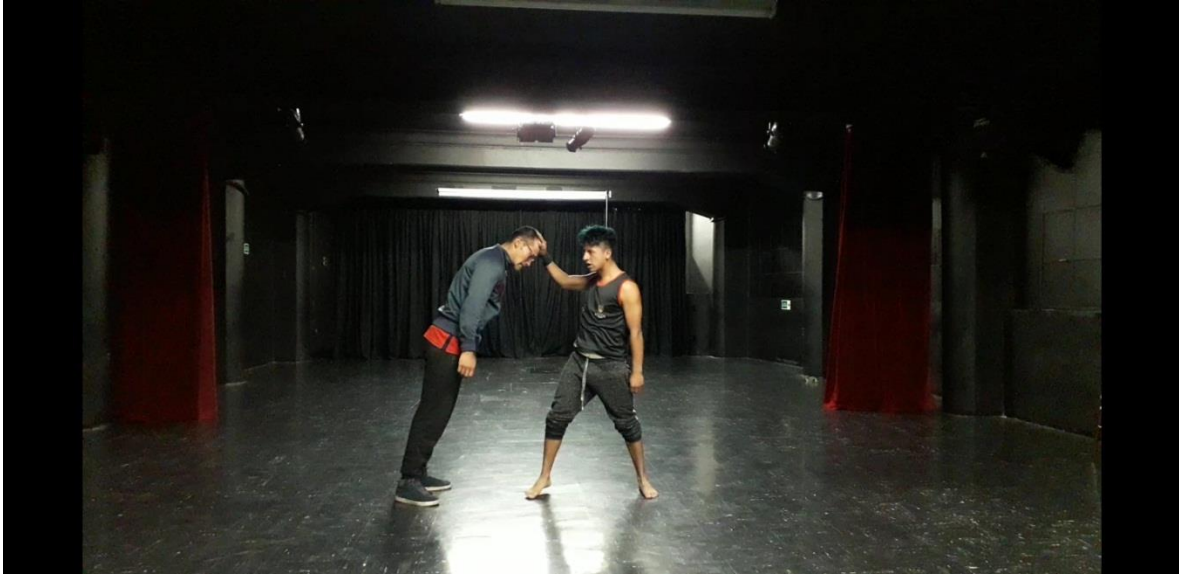
Fotografía 37Ejercicio Escénico.