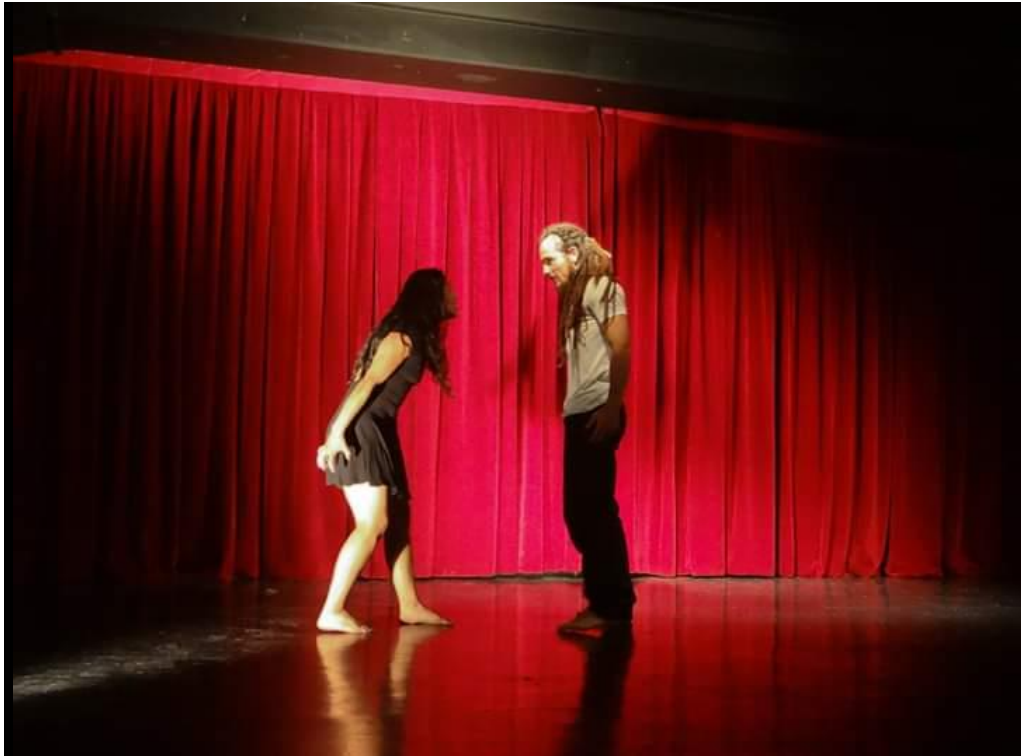
Fotografía 59 Presentación.