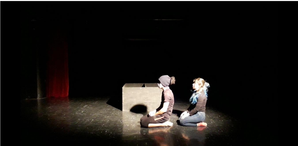
Fotografía 26 Ejercicio Escénico.