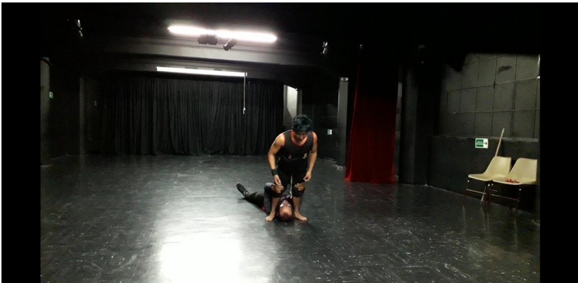
Fotografía 40 Ejercicio Escénico. Tomada por Vanessa Morales