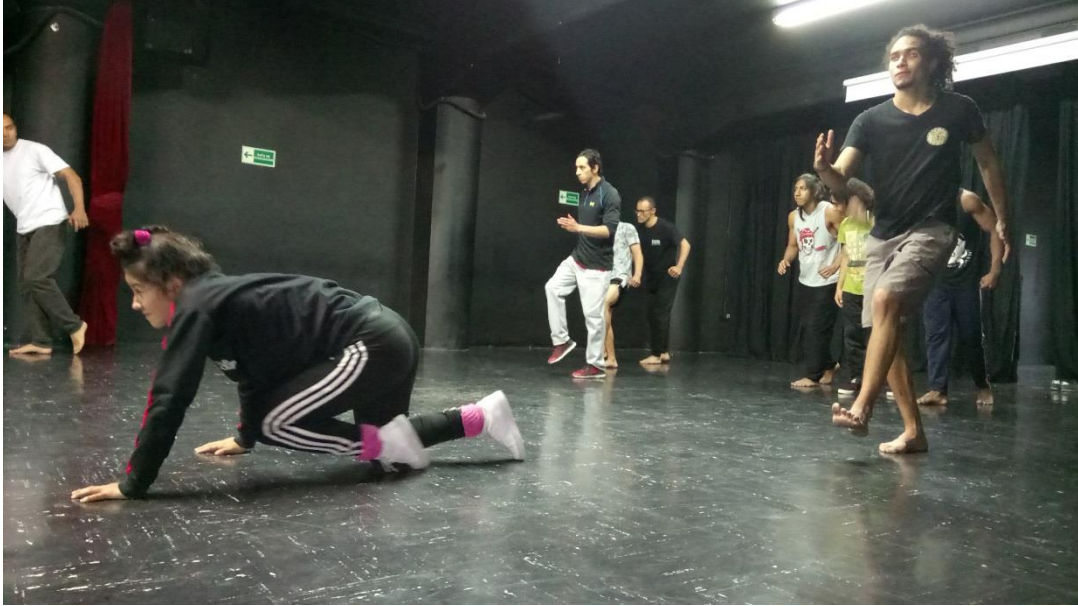
Fotografía 4. "La Carrera".

Para dar continuidad al ejercicio se propuso una carrera en donde el último que llegara sería el ganador, aquí algunos tomaron la carrera en serio mientras que otros no, algunos le dieron su interpretación y propusieron un personaje que desarrollaron, uno de ellos se tropezó pero volvió a levantarse continuando la carrera, esto lo retrasó un poco lo que probablemente lo haría ganador, mientras que otros trataban de pasar a los delanteros en algunas ocasiones lo consiguieron, finalmente el ejercicio terminó y fueron risas las que se produjeron al final.