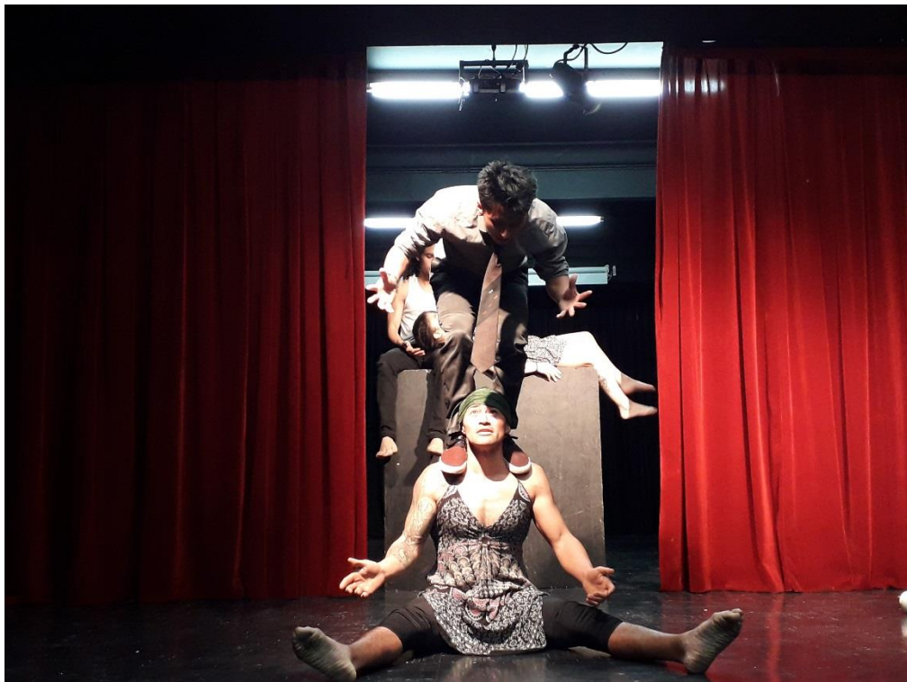
Fotografía 50 Ejercicio Escénico.