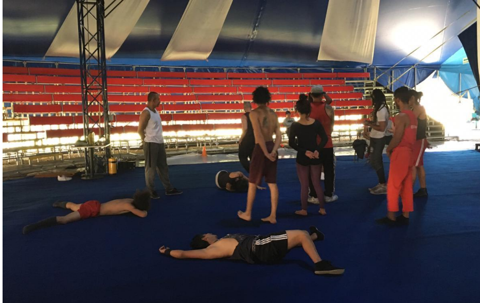
Fotografía 2. Juego "El Asesino".

Continuando, la practicante y los chicos jugaron el asesino, en donde se señalaba a una persona que jugaría este rol (sin que nadie más supiera) y con la acción de guiñar un ojo mataría a sus compañeros, la idea del juego era descubrir quién era el asesino, aquel que acusara a alguien inocente debía realizar una penitencia y si el asesino era descubierto, este debía realizar la penitencia que el grupo propusiera (Anónimo, 2011); el objetivo era la atención y comunicación no verbal entre ellos.