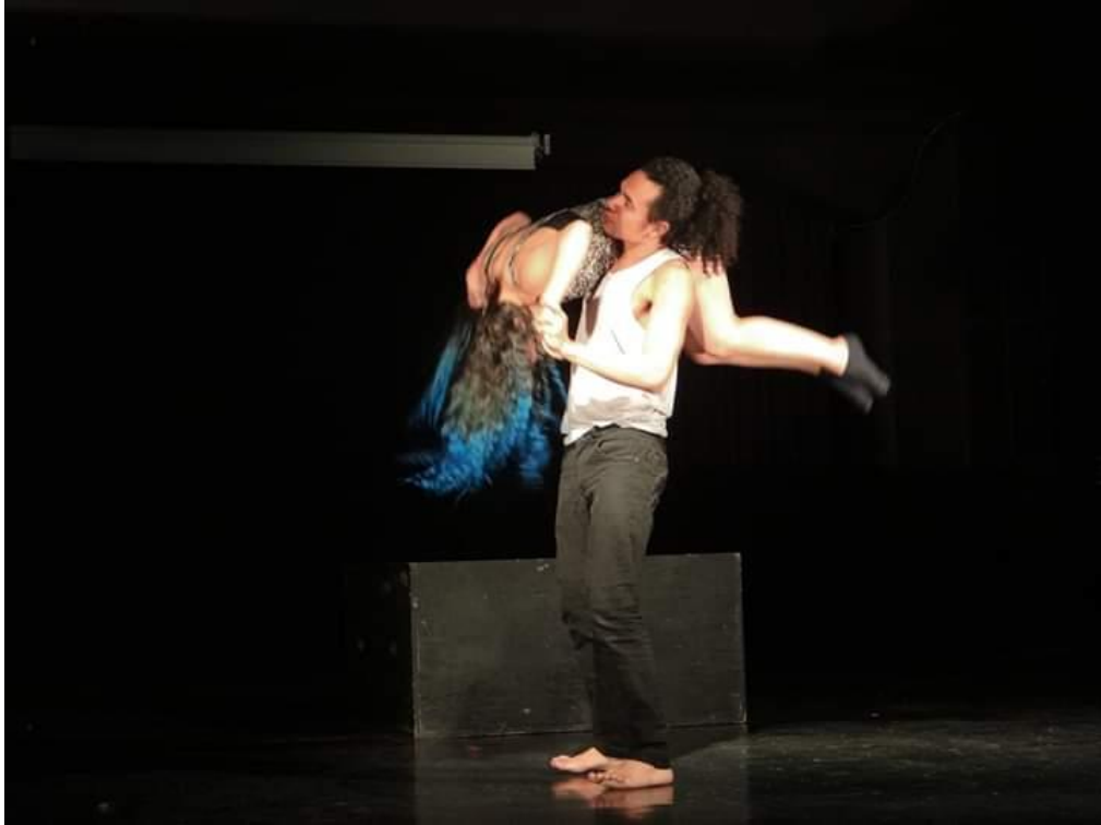
Fotografía 55 Presentación.