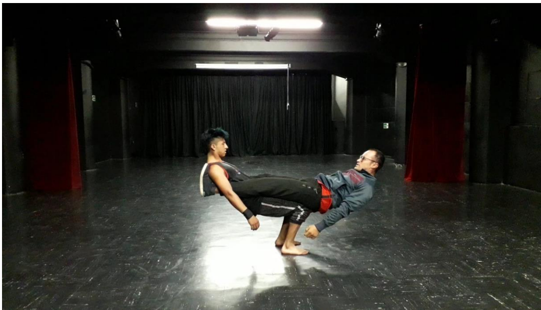
Fotografía 7. Ejercicio escénico.

El primer ejercicio incluyó acrobacia en su presentación, lo cual gustó mucho, ya que la docente había pensado en la idea de agregar el arte de ellos en la obra, pues esta lo permitía y daba más fuerza a los ejercicios; en el ejercicio se observó que los chicos en algunas ocasiones se reían en escena, pues era inevitable para ellos no hacerlo debido a que no tenían el texto o no se encontraban completamente concentrados; además, fallaron en algunas de sus acrobacias, tomando como salida la risa.