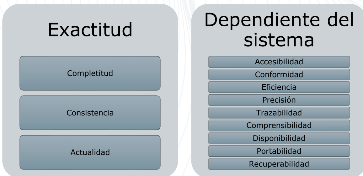
Figura 2. Características de calidad de datos.

La norma ISO/IEC 25012 define el modelo de calidad de datos, cuyo objetivo “es representar los cimientos sobre los cuales se construye un sistema para la evaluación de un producto de datos”, la figura 2. Muestra cómo se encuentra compuesto.