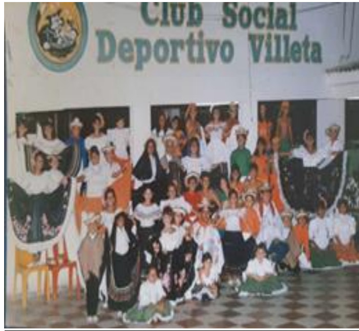
Ilustración 5 Mi primera escuela de formación de danzas folclóricas.