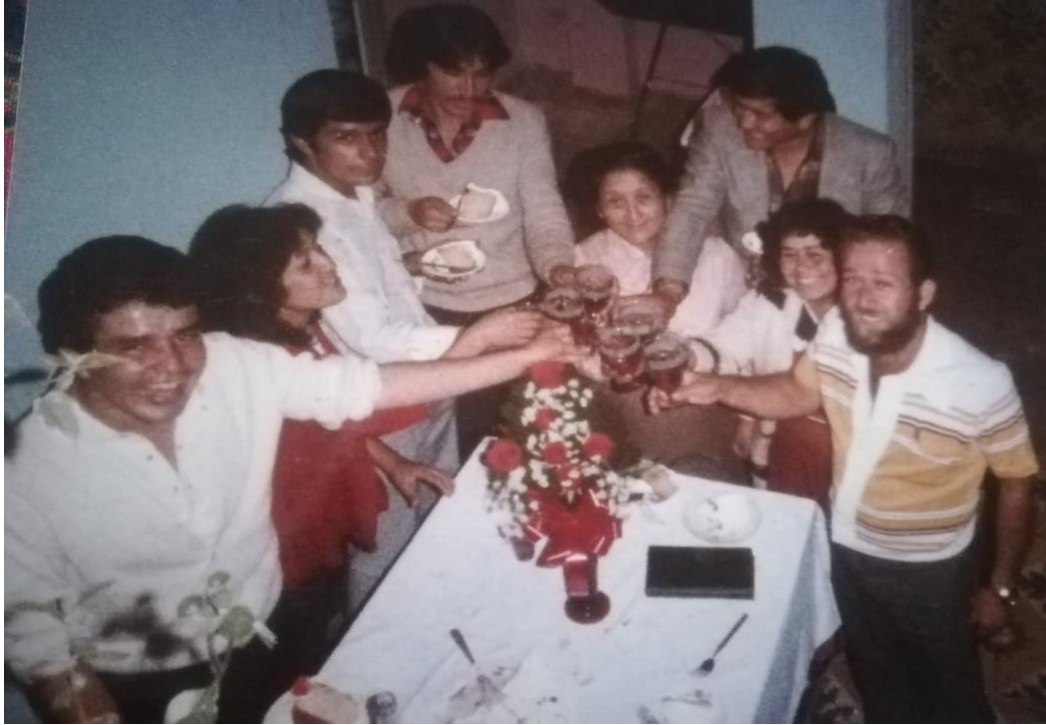
Ilustración 14 Celebración con mis amigos.

Ante la falta de espacios como academias de danza, casas de la cultura o institutos donde las niñas y niños pudiéramos aprender a bailar, nos tocaba aprovechar las salas de algunas casas para practicar lo enseñado por las maestras de la escuela y los espacios como las fiestas familiares y las fiestas del pueblo.