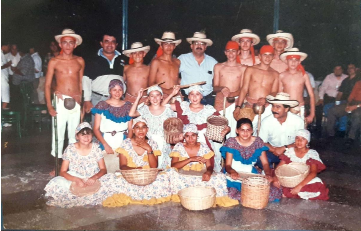
Ilustración 40. Escuela de danzas a ritmo de molienda, Quebradanegra – Cundinamarca