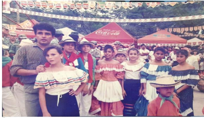
Ilustración 32. Escuela de danzas Caña y Panela, Villeta – Cundinamarca.