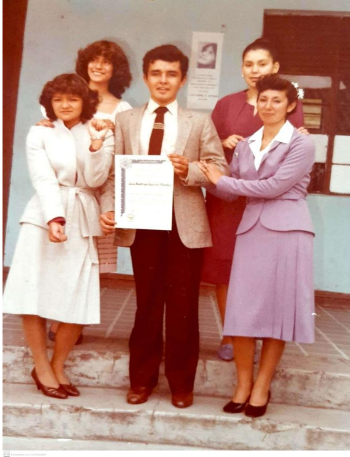
Ilustración 24.. Con mis compañeras de graduación.