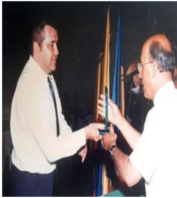
Otro reconocimiento por la fundación de la escuela de danzas caña y panela de Villeta.