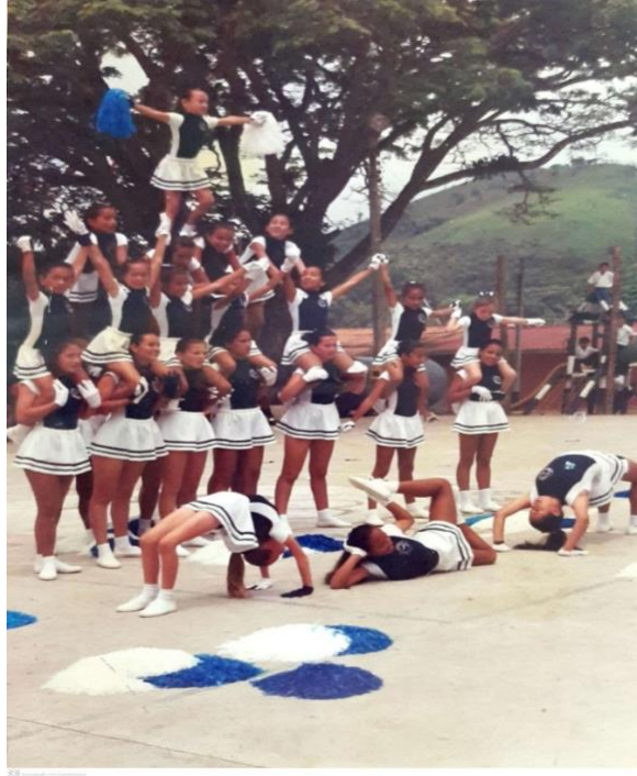
Ilustración. Grupo de porristas La Magdalena, Cundinamarca