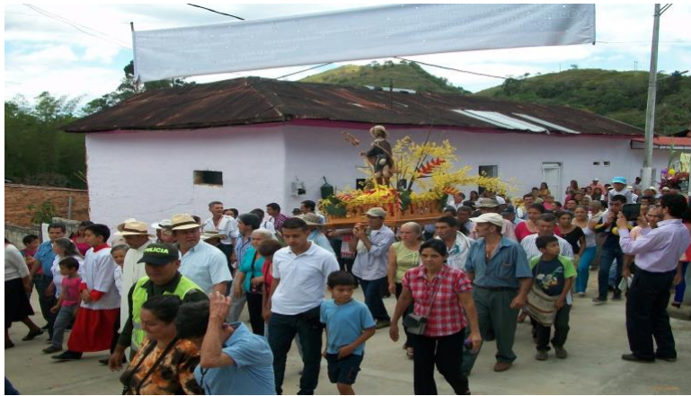
Ilustración 15 Fiestas de San Roque en Quebradanegra.

a los partícipes de la fiesta. Más tarde se organizaba un gran baile en la plaza central del pueblo que quedaba frente a la iglesia.