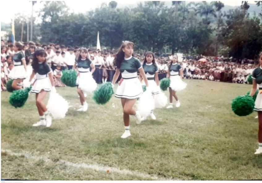
Ilustración. Grupo de porristas colegio Alonso de Olaya municipio de Villeta, Cundinamarca