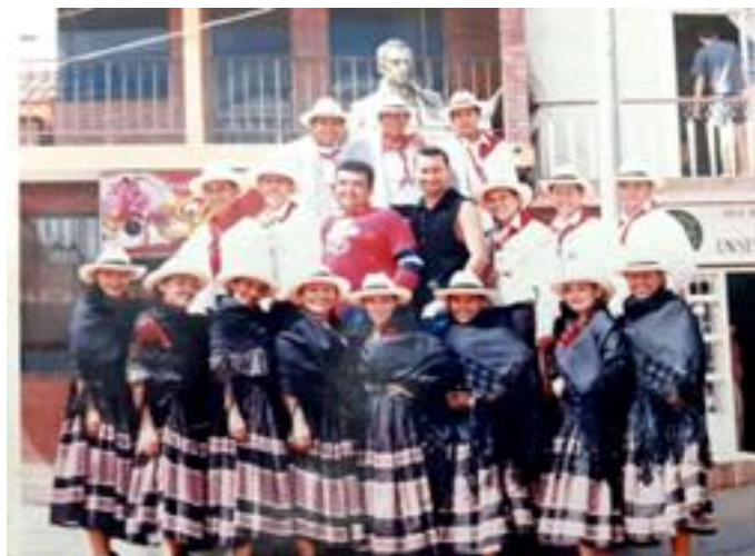
Reencuentro escuela de danzas Caña y panela de Villeta.