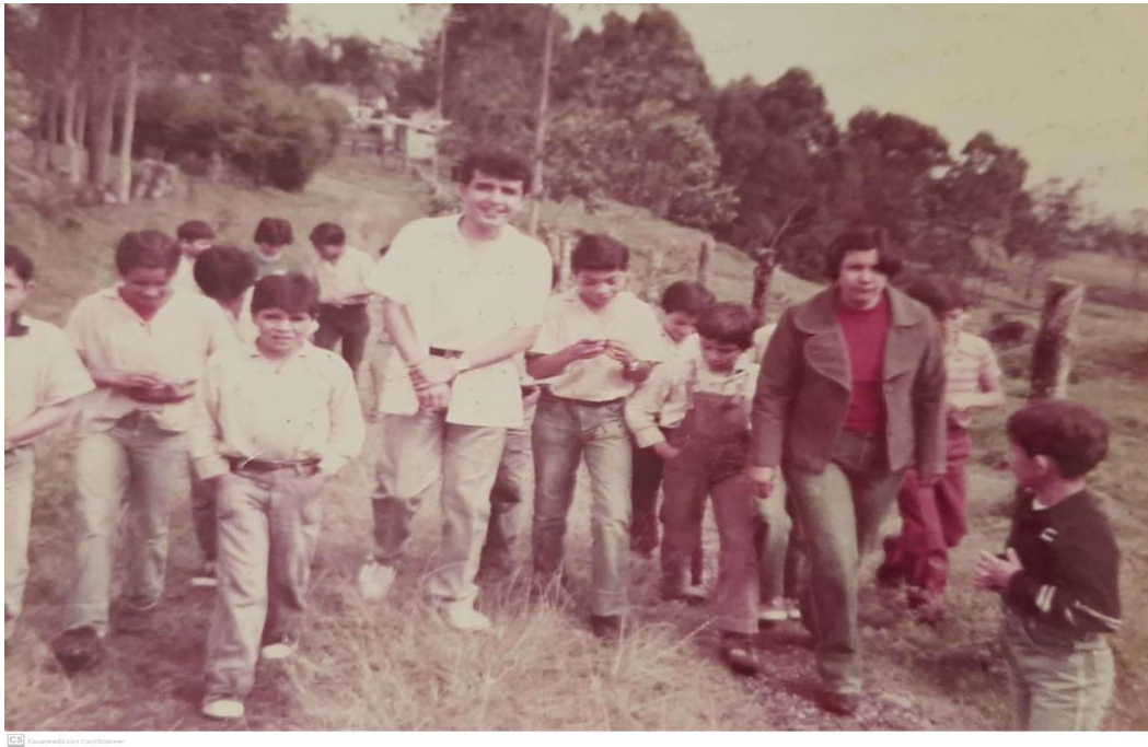
Ilustración 25. Granjas Infantiles del padre luna, Albán – Cundinamarca

Como faltaba el profesor de educación física fui nombrado por la asociación de padres de familia para completar la planta de profesores. De febrero a agosto me desempeñé en esta área, con mucho éxito pues puse en práctica los conocimientos adquiridos en la normal en cuanto a deportes, gimnasia, revistas y danzas folclóricas. En el mes de septiembre cuando se enfermó el sacerdote de Quebradanegra y que estuvo incapacitado por tres meses, fui llamado por la Gobernación de Cundinamarca para que hiciera esta licencia, cuando llegué al colegio cooperativo Alfredo Vázquez Cobo en la cabecera municipal me encontré con que debía orientar el área de filosofía y religión, como no era muy versado en esta área, me tocó leer muchos libros de filosofía para poder enseñar a mis estudiantes de grado décimo y once. En cuanto a la religión orientaba los cursos de sexto a noveno con una guía que llevaba el sacerdote titular del área. Así culminó el año de 1982.