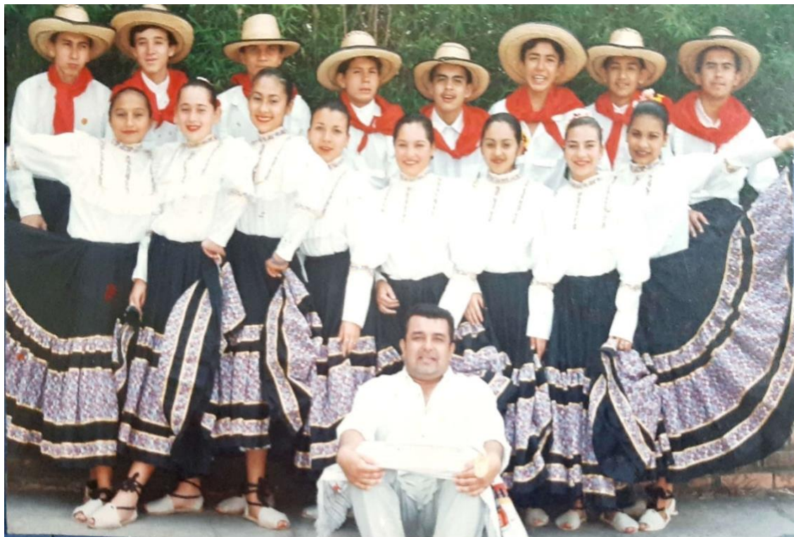
Ilustración 34. Escuela de danzas Ritmo de molienda, Quebradanegra – Cundinamarca.

Me refugié en el trabajo en diferentes municipios de la zona del Gualivá. Los fines de semana me desplazaba al municipio de San Francisco de Sales donde logré fundar otro grupo folclórico denominado Frutos de mi tierra.