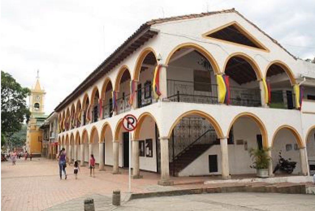
Ilustración 30. Llegada al municipio de Villeta, Cundinamarca.