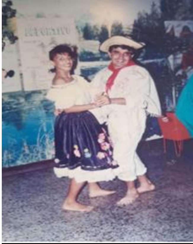
Ilustración 7 Mi desempeño como bailarín.