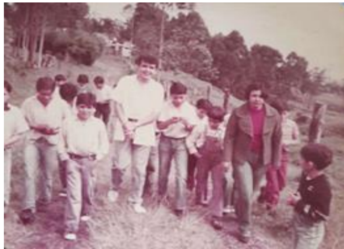
Ilustración 4 Iniciación de mi vida laboral.