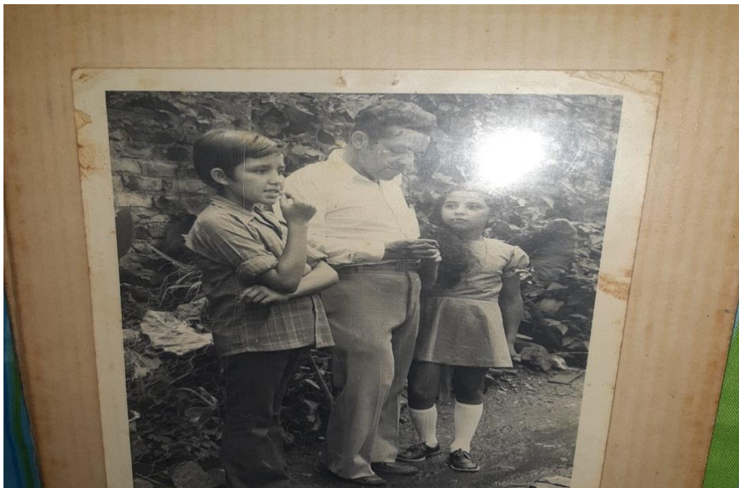
Ilustración 18 En la finca de mis abuelos.