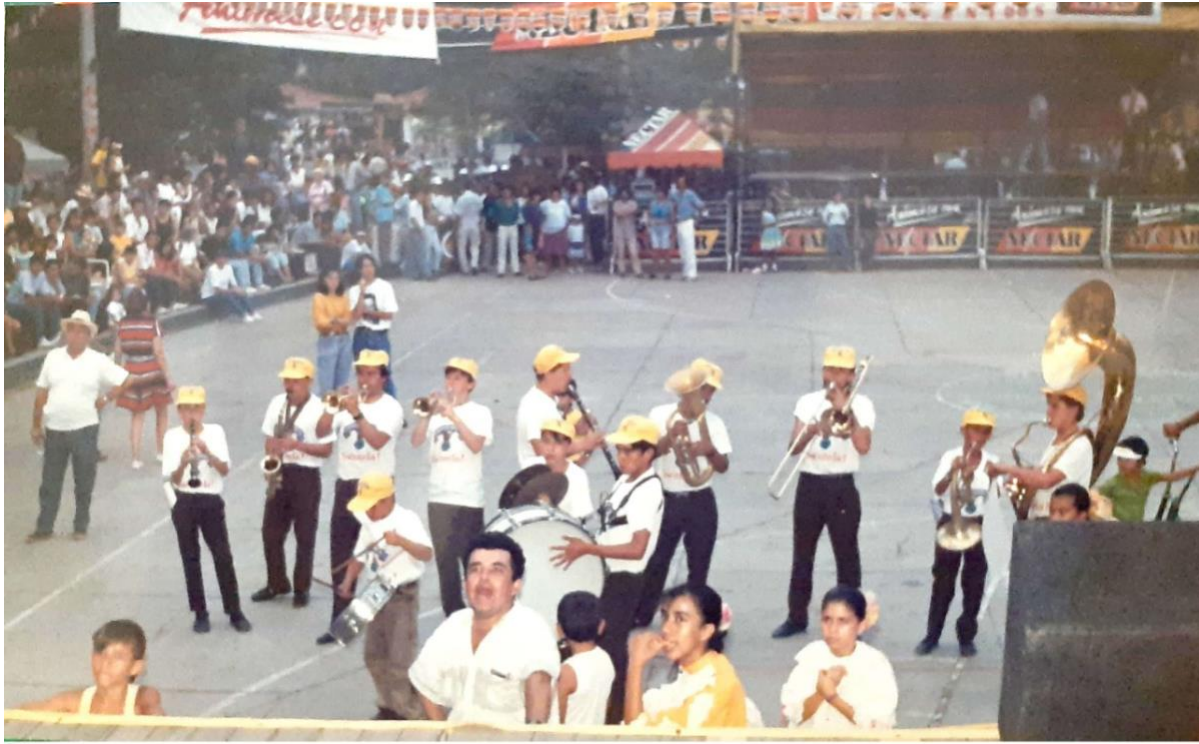
Ilustración 16 Ferias y fiestas La Magdalena, Cundinamarca.

Recuerdo las vacaciones en la finca de mis abuelos como una época feliz. Aprendí a recoger café, ir a la molienda o el trapiche de caña donde se producía panela para llevarla a vender cada sábado a Villeta, que era centro de acopio. Aprendí a ordeñar vacas y a encerrar becerros para separarlos de ellas, y así dieran más leche.