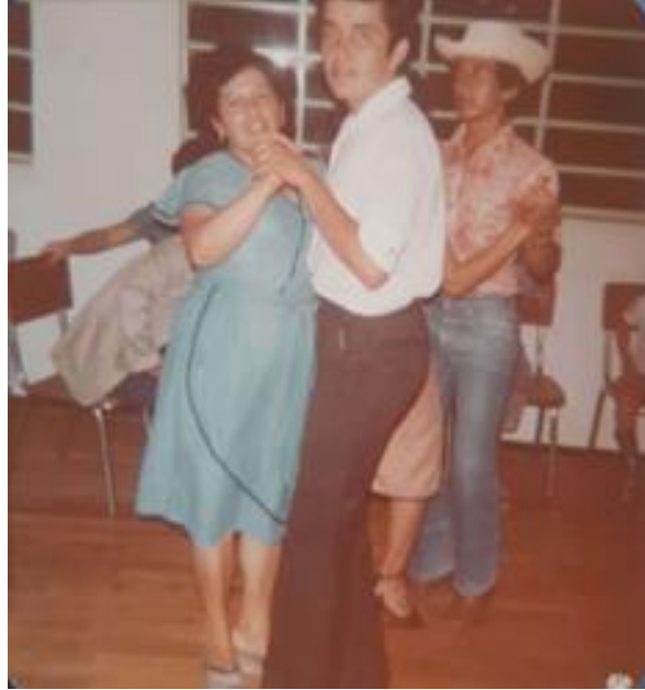
Ilustración 3 Bailando con mi mamá en mi grado.