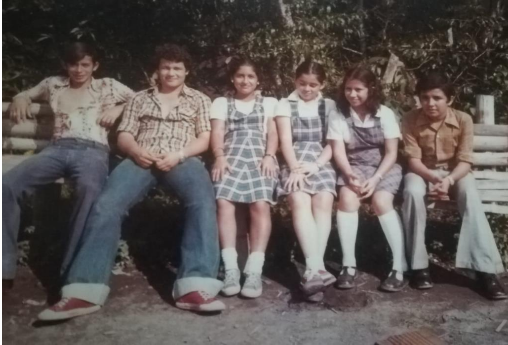
Ilustración 17 Empezando el bachillerato.