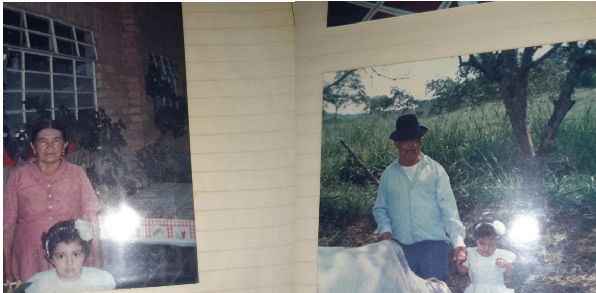
Ilustración 19. Bautizo de mi sobrina en la finca de mis abuelos.

Fui a la finca de mis abuelos a despedirme de ellos y de paso ver el lugar donde había crecido. Quería tener en mi memoria los momentos y lugares donde jugaba con mis tíos, mis primos y mis hermanos. Luego recorrí el pueblo y me despedí de mis amigos y de las personas que lo habitaban, ya que por lo pequeño de la población todos nos conocíamos. En algún momento se me escurrieron las lágrimas, quizá por saber que no iba a volver en algún tiempo, o tal vez por el temor de partir.