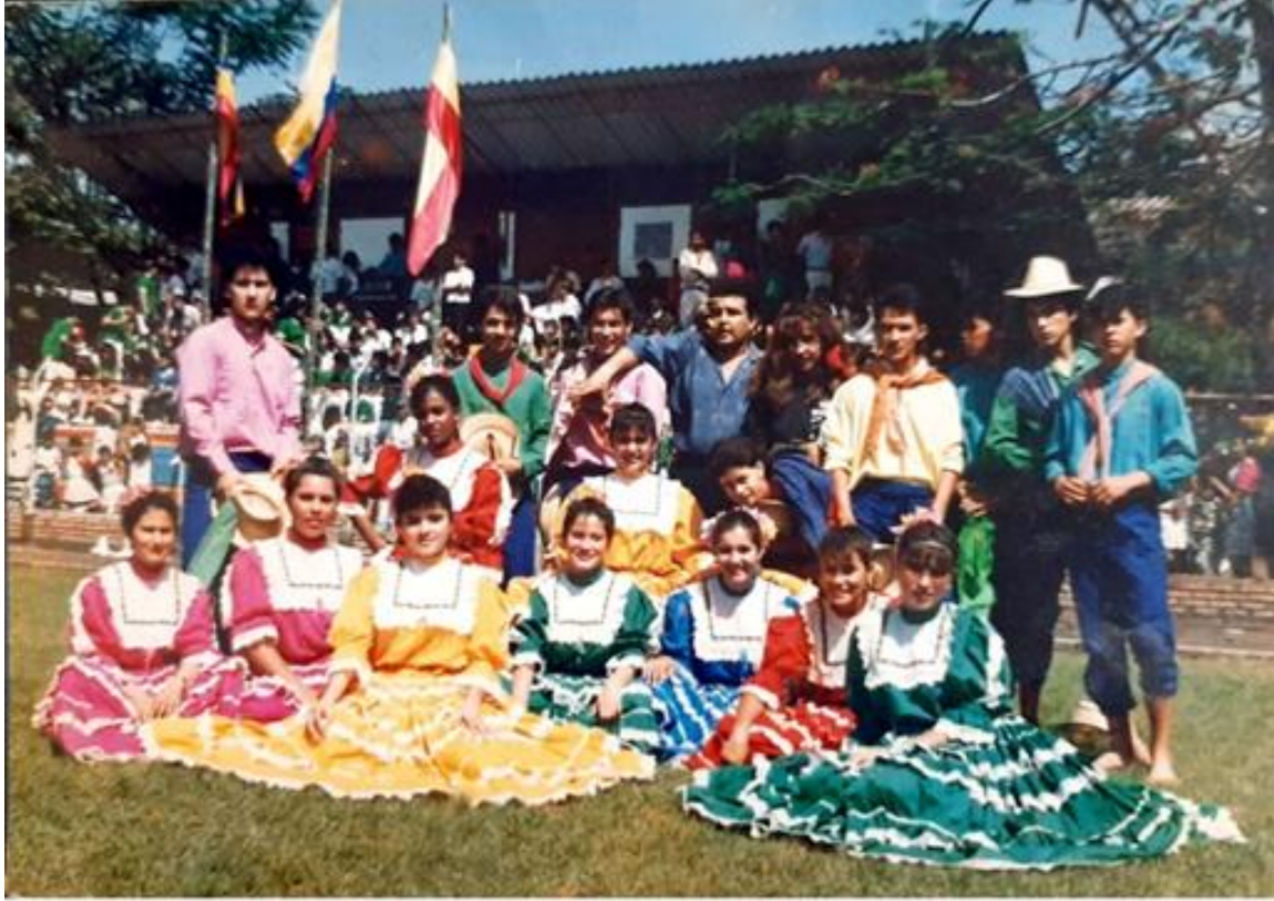
Ilustración 37. Participación escuela de danzas Caña y panela en concurso departamental.