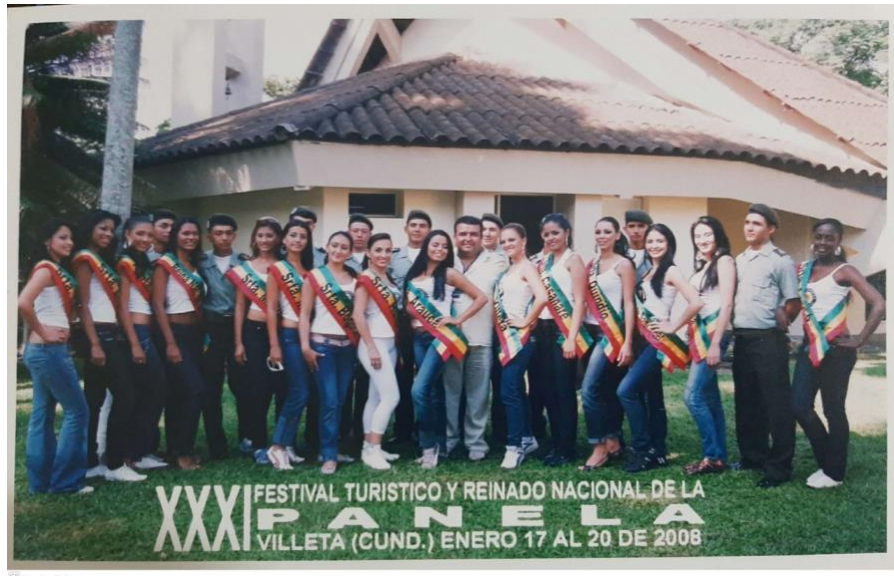
Ilustración 42. XXXI Festival turístico y reinado nacional de la panela, Villeta – Cundinamarca.