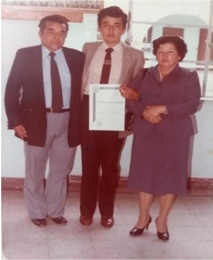
Ilustración 23. Grado bachiller pedagógico con mi mamá y mi papá.