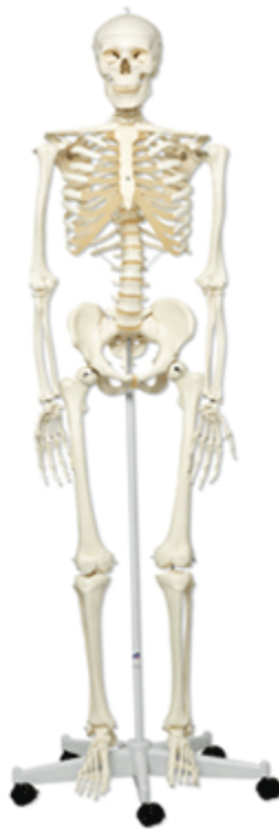
Ilustración 22. Bromas con un esqueleto. Tomado por elproveedordelmedico.com

Una de las características de mi personalidad en ese entonces, me distinguía por ser muy travieso, a veces indisciplinado, me gustaba hacer bromas pesadas a mis compañeros, pero buen