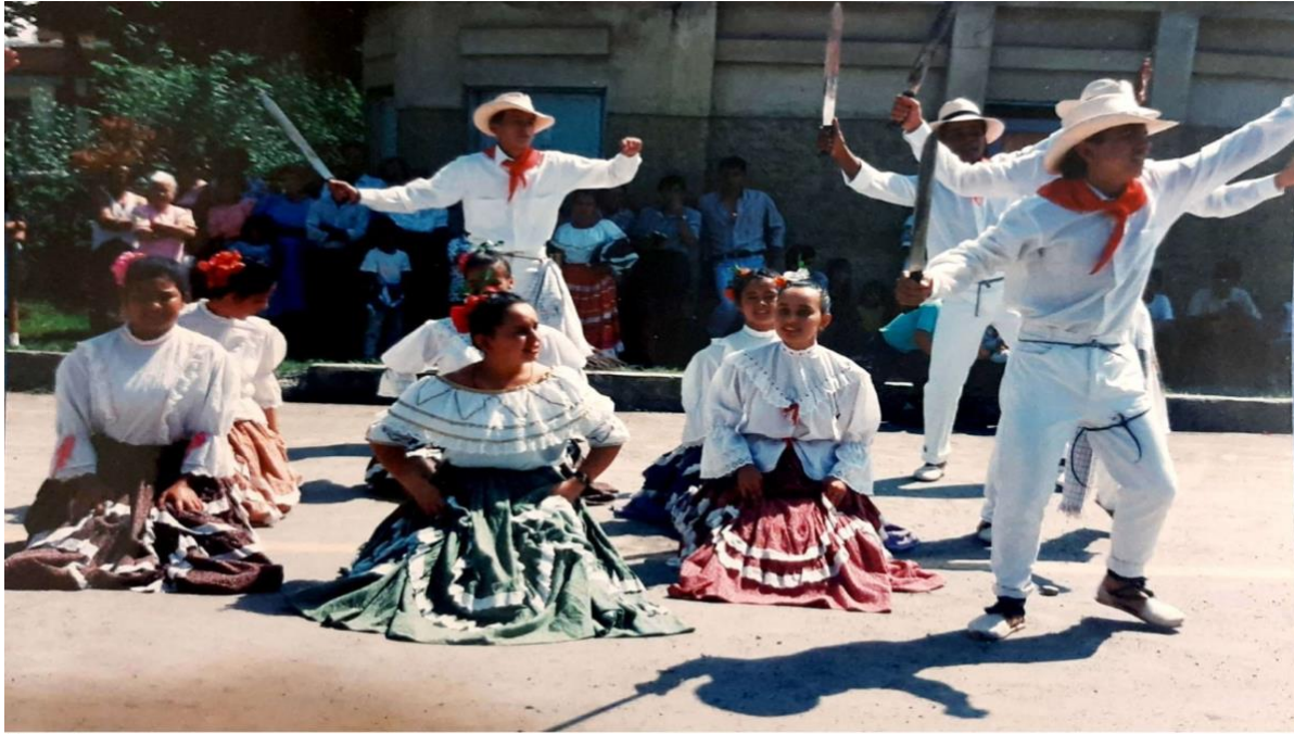
Ilustración 46. Escuela de danzas folclóricas caña y panela, juego coreográfico elaboración de la panela.

Como resultado de la investigación, y teniendo en cuenta que, en los municipios de la zona del Gualivá, que en su mayoría son productores de panela, y que los ritmos folclóricos predominantes a través de la historia son el bambuco y el torbellino. Nació la creación la elaboración de la panela. Danza de laboreo en ritmo de bambuco. Para esta creación observé el procedimiento para la elaboración de la panela en las veredas de Cuné, Bagazal, Alto de torres, Chapaima y Salitre Blanco, asimismo, a municipios como Nocaima; Nimáima, Caparrapí, Quebradanegra y Útica. Después de esta observación concluí que el procedimiento para la elaboración de la panela es el mismo en todos los lugares.