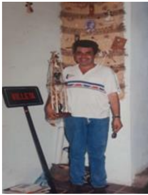
Ilustración 6 Empiezan los triunfos y los reconocimientos.