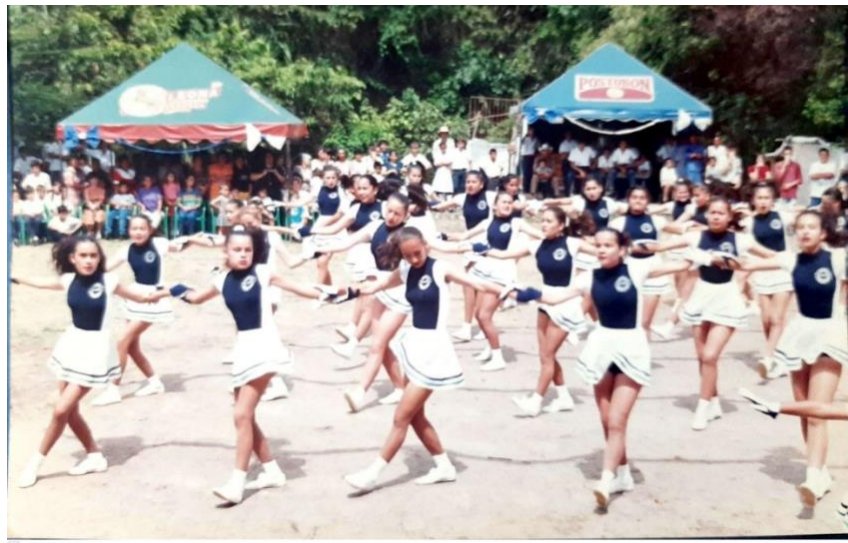
Ilustración. Grupo de porristas Quebradanegra, Cundinamarca