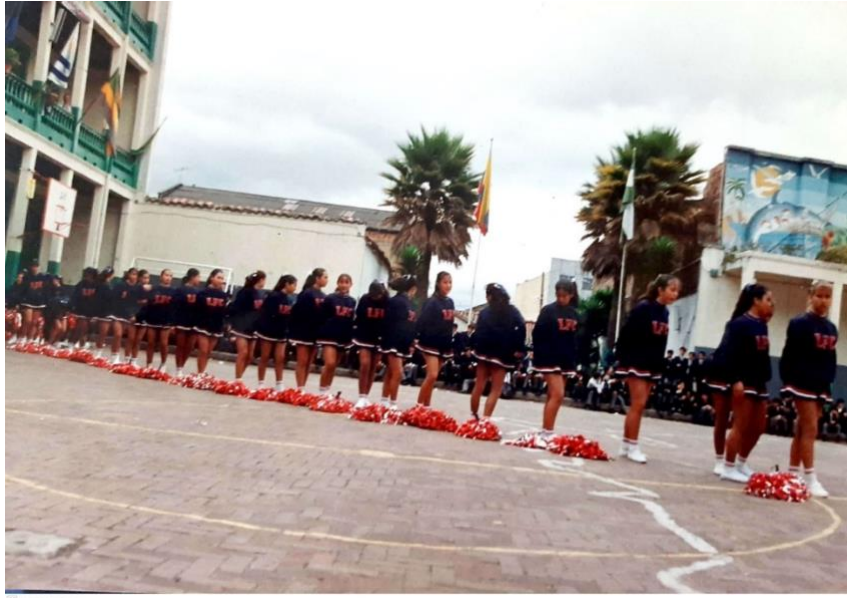
Ilustración Grupo de Porristas Liceo femenino de Cundinamarca, Bogotá