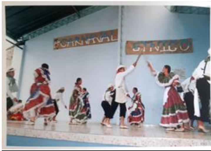
Escuela de danzas juventud folclórica, Funza – Cundinamarca.

Traslado al municipio de Funza Cundinamarca la Institución educativa departamental miguel Antonio caro bajo el decreto 00096 del 17 de enero del 2000. Me desempeñe los siguientes tres años como director de la concentración Miguel Antonio caro, luego en el 2003 paso a la sección de bachillerato donde fundo la escuela de danzas Juventud Folclórica que hasta ahora permanece vigente