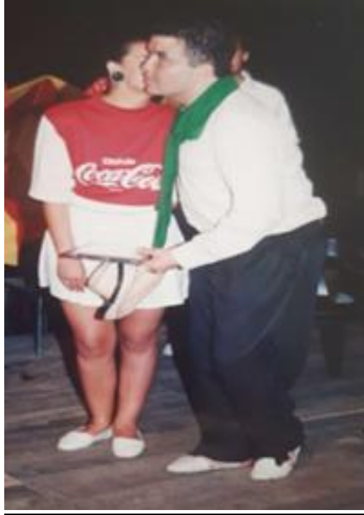
Mas reconocimientos por mis escuelas de danzas.