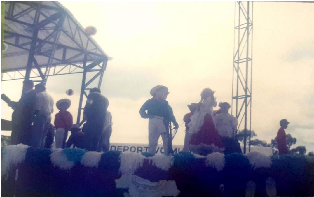
Ilustración 12 Presentación danzas.

En los actos cívicos y patrios que se realizaban en esa época, izadas de bandera, fiesta de la madre y la clausura del año escolar, las maestras de la escuela preparaban las presentaciones culturales para estos actos. Mi profesora de primero consideró que yo tenía aptitudes para la danza- mis recuerdos también son claros en cuanto a mis facilidades como bailarín-, seleccionó a una niña para que hiciéramos pareja y nos preparó, enseñándonos algunos bailes y danzas que luego presentábamos en cada uno de estos eventos.