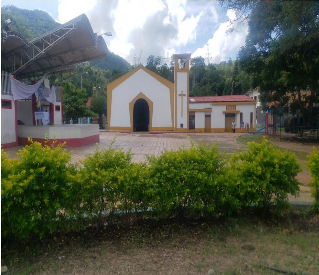
Ilustración 11 Capilla de La Magdalena.