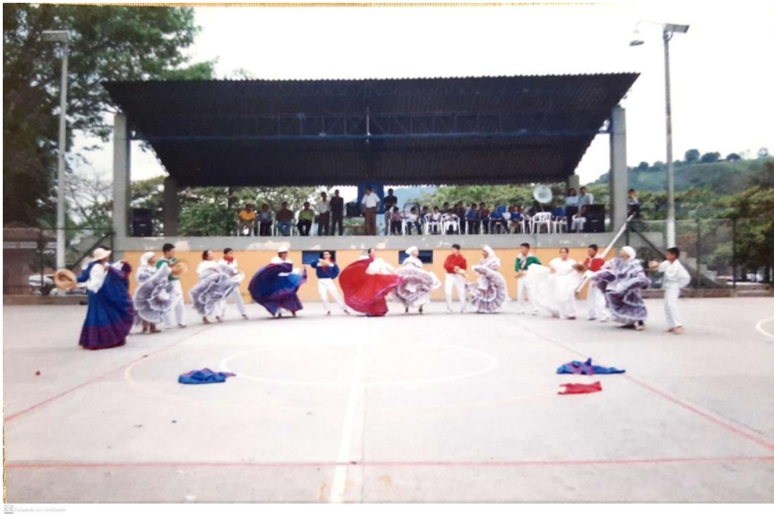
Ilustración 35. Frutos de mi tierra, San Francisco de Sales – Cundinamarca.