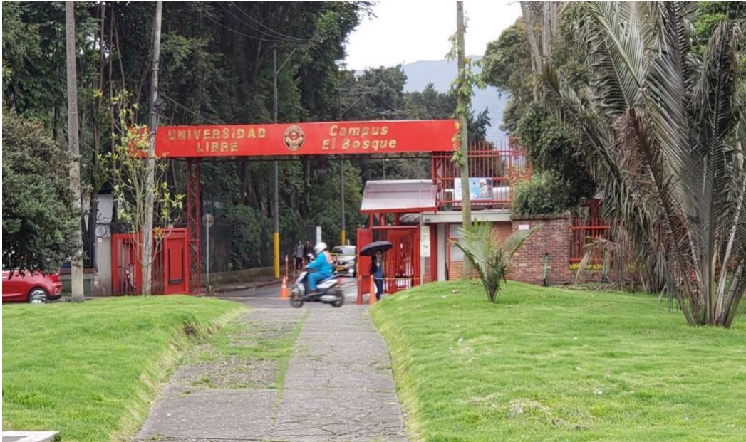
Ilustración 27. Ingreso por primera vez a la universidad.

Nos inscribimos en la universidad libre de Colombia para estudiar la licenciatura en filología e idiomas ya que el horario era de 6 a 10 de la noche y los sábados de 8 a.m. a 1 de la tarde. Los sábados por la tarde participábamos en las actividades culturales como el grupo de teatro y el grupo de danzas representativo de la universidad, esto ocurrió en el año de 1985. Con muchas dificultades económicas ya que desplazarse todos los días desde Bogotá a Albán y de Albán a Bogotá además de otros gastos como arriendo y alimentación hicieron que me tuviera que retirar, ya que no me alcanzaba el sueldo para pagar el semestre y los gastos mencionados anteriormente, logré hacer cinco semestres. Mi compañera sí culminó la carrera y se graduó.