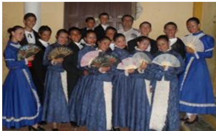
Escuela de danzas Juventud folclórica en el Liceo Celedón de Santa Marta.