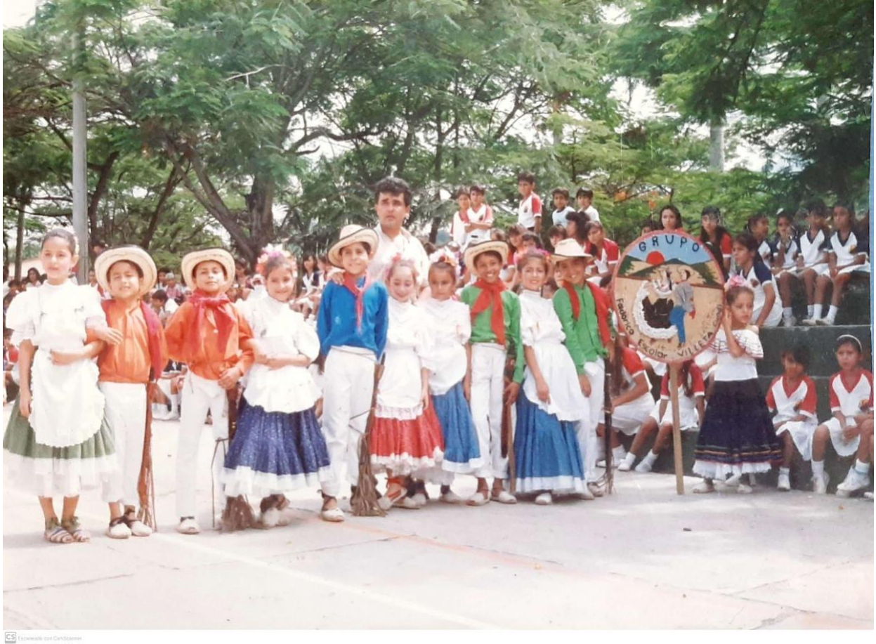
Ilustración 39. Grupo folclórico escuela rural Cune, Villeta – Cundinamarca.

Villeta es la capital de la provincia del Gualivá, conformada por los municipios de Albán, Caparrapí, Guaduas, La Peña, La Vega, Nimáima, Nocaima, Puerto Salgar, Quebradanegra, Sasaima, San Francisco, Supatá, Útica y Vergara, todos estos con marcada vocación panelera.