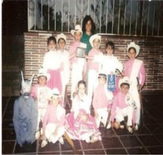
Ilustración 2. Primera agrupación de danzas a la que pertenecí.