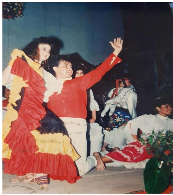
Ilustración 33. Parejo real señorita Antioquia, festival Nacional de la panela.