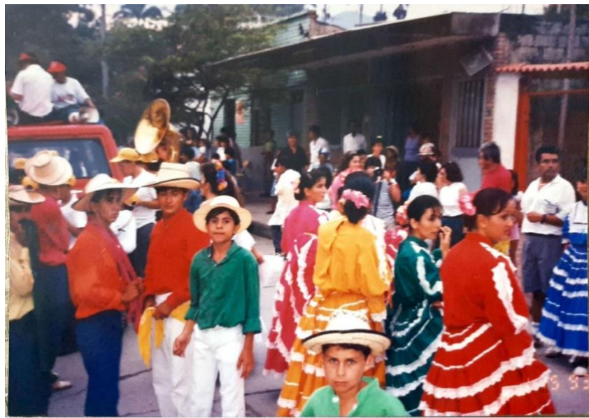
Ilustración 36. Escuela de danzas Caña y panela, municipio de Villeta – Cundinamarca.