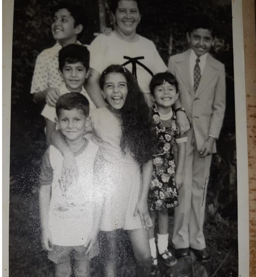
Ilustración 13 Mi mamá, mis hermanos y mis primos.

La casa era grande, tenía una sala inmensa, que se adecuaba como el salón de baile. Mis abuelos, mis tíos y los vecinos se reunían para festejar. Se bailaba la música de la época. Bambucos, torbellinos, pasillos, merengues y rumbas campesinas., se ponían los discos o acetatos, primero en la vitrola y más adelante en el tocadiscos y la rockola que funcionaba depositando una moneda en la ranura y ella se encargaba de seleccionar el disco que uno quería escuchar. Alumbrados inicialmente por mecheros que funcionaban con petróleo y kerosene y a medida que fue pasando el tiempo con lámparas a gasolina. Estas fiestas familiares podían durar hasta dos noches con sus respectivos días donde se repartía buena comida y buen guarapo y chicha que eran las bebidas de la época.