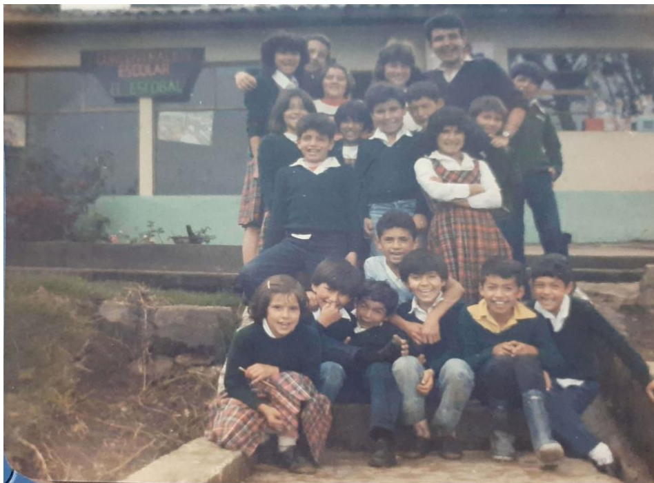
Ilustración 28. Escuela rural El Escobal, Albán.

Otra situación que me llamó la atención es que un gran número de padres de familia no habían terminado la primaria y algunos no sabían leer ni escribir. Entonces hablé con el director de núcleo del municipio planteándole la idea de que, si era posible, crear un grupo de alfabetización, donde los adultos tuvieran la oportunidad de estudiar después de su jornada de trabajo. Así lo