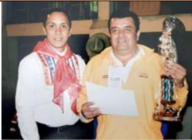
Grupo de danzas folclóricas de cootradecun Bogotá.

Nombramiento por contrato por OPS como instructor de danzas folclóricas de los docentes asociados a la cooperativa multiactiva de los trabajadores de la educación para Cundinamarca y Bogotá COOTRADECUN grupo que trabaja los fines de semana, y que ha obtenido muchos reconocimientos a nivel departamental, nacional e internacional.