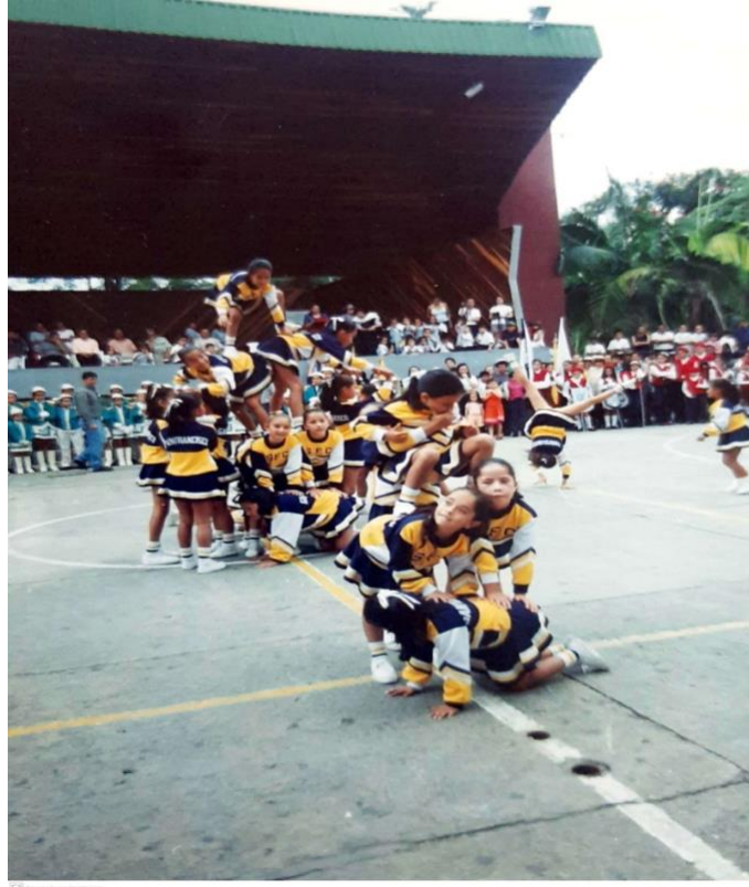
Grupo de porristas municipio de San Francisco de Sales, Cundinamarca

Hacia 1998, soy llamado por el instituto municipal de cultura y turismo del municipio de Villeta para que sea el coordinador general, y el coreógrafo oficial del festival y reinado nacional de la panela y muestra folclórica colombiana. El trabajo que debía realizar era coordinar las candidatas que venían de otros departamentos, preparar las muestras folclóricas de cada una de ellas para la noche de folclor, lo mismo que el baile de presentación para abrir la ceremonia de elección y coronación de la reina; todo esto con la ayuda de mis bailarines y bailarinas de la escuela de danzas Caña y Panela del municipio de Villeta.