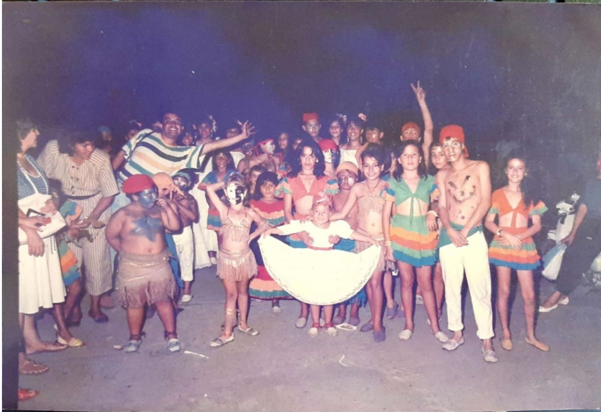
Ilustración 38. Grupo infantil caña y panela evento cumpleaños de Villeta.

Villeta “la ciudad dulce de Colombia”. Altura: 840 metros sobre el nivel del mar. Temperatura: 26° C en promedio. Habitantes: 37.000 aproximadamente. Distancia a Bogotá: Por la carretera central del occidente 78 Km. Autopista Medellín vía la Vega 86 Km.