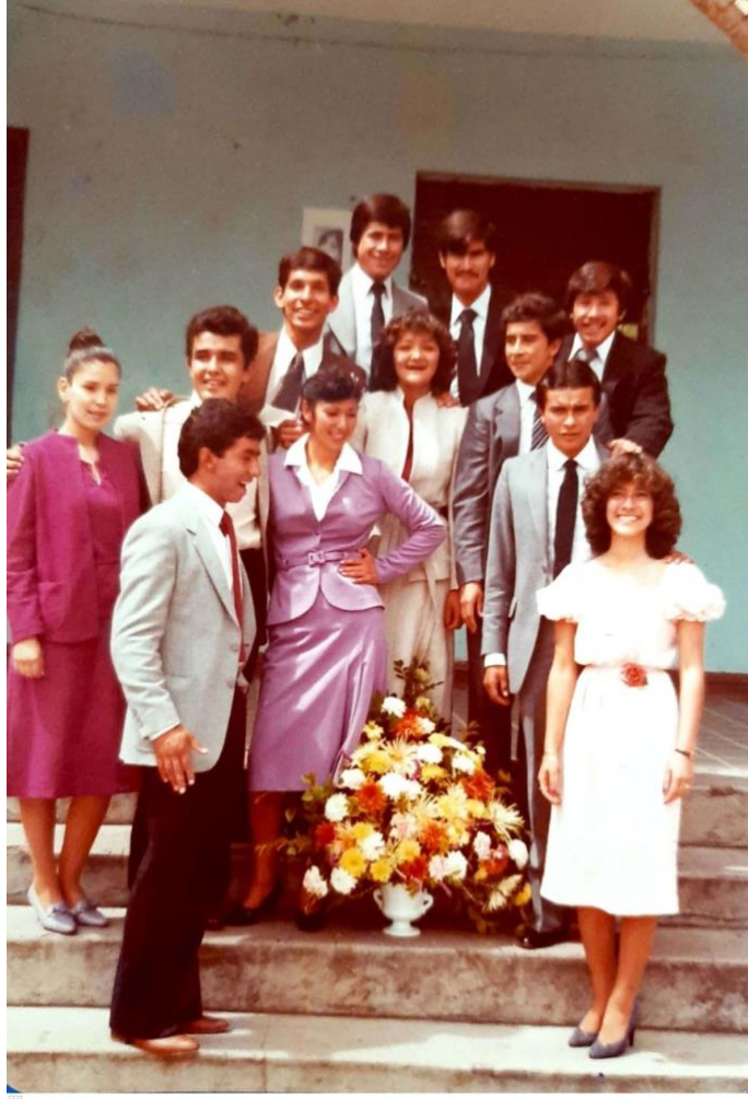
Ilustración. Con mis compañeros de graduación Normal de Cundinamarca, Zipaquirá 1981