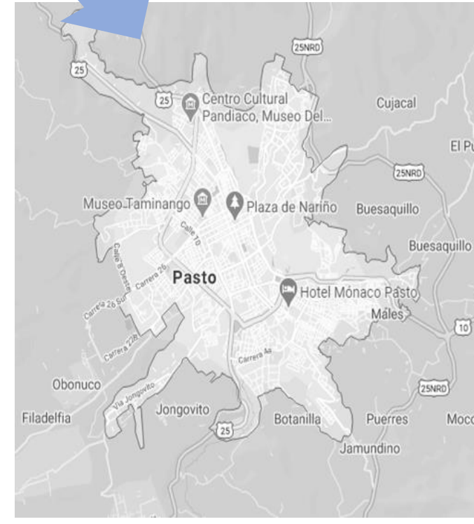
SAN JUAN DE PASTO