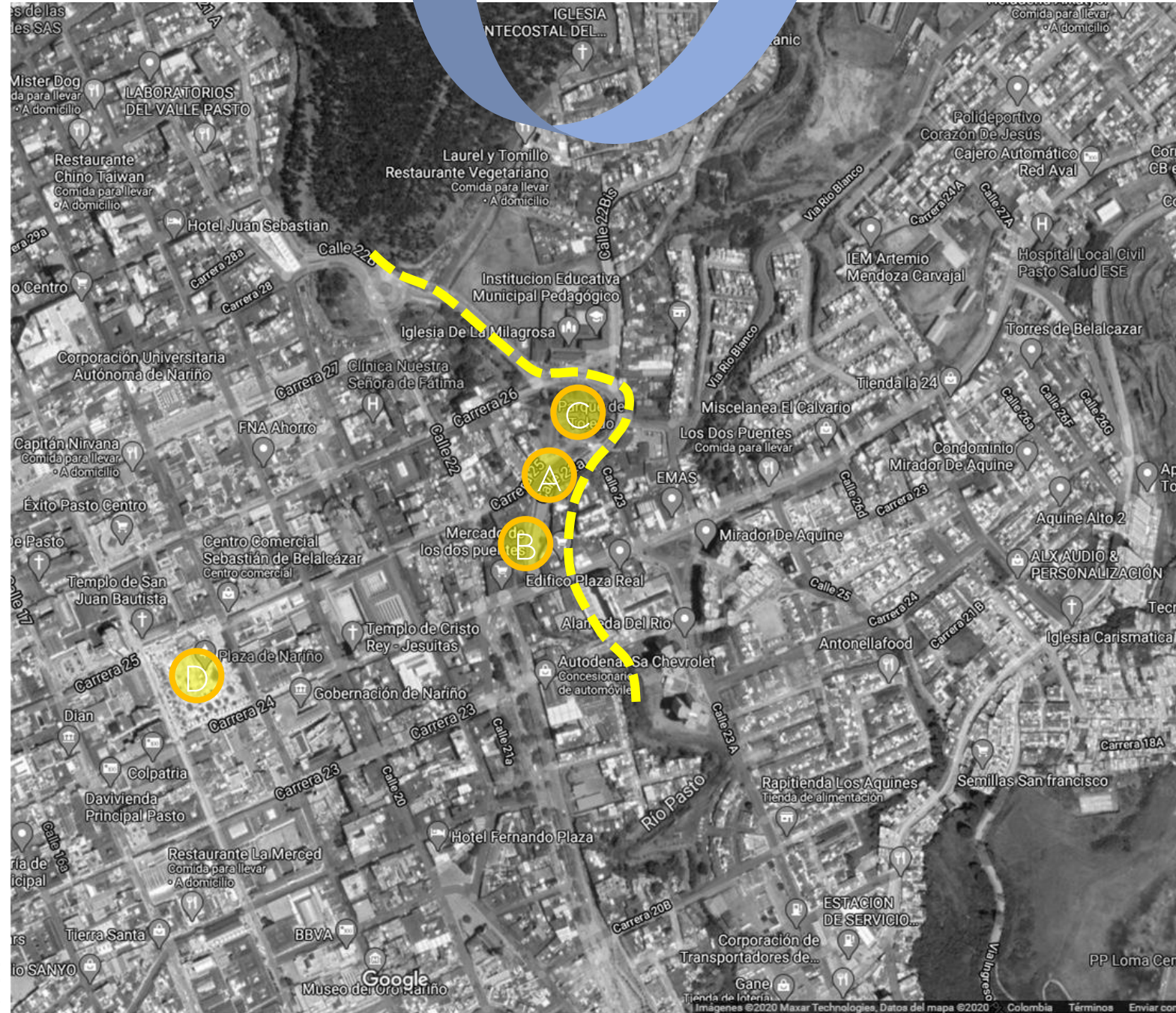
ZONA CÉNTRICA SAN JUAN DE PASTO