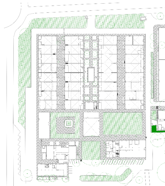
Planta Arquitectónica Edificios Patrimoniales SENA

Carecer de un estudio riguroso que permita dar cuenta del valor arquitectónico de los edificios fundacionales del Sena-Salomia, impide entender el contenido en la obra, el cual actúa como acervo cognitivo en el ejercicio proyectual de la arquitectura, entenderlo supone un aporte importante al conocimiento del desarrollo de la arquitectura Educativa moderna en Colombia conceptos que serían referentes para otras edificaciones en la ciudad de Cali.