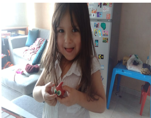
Ilustración 4. actividad de animales.

La quinta planeación se designó “Expresión corporal y teatro”. La M.A.F creó esta planeación con el fin de dar herramientas y estrategias a los niños, a la hora de hacer teatro y expresar el cuerpo, la M.A.F dividió la sesión en dos momentos: el primero fue un calentamiento donde los niños integraron su animal favorito en ellos, realizando movimientos y sonidos de dicho animal. En el segundo momento la M.A.F usó la creatividad, imaginación y relajación con un ejercicio en el cual los niños tuvieron que cerrar los ojos y acostarse, mientras la maestra contaba una historia con los animales que cada uno de los niños mencionó.