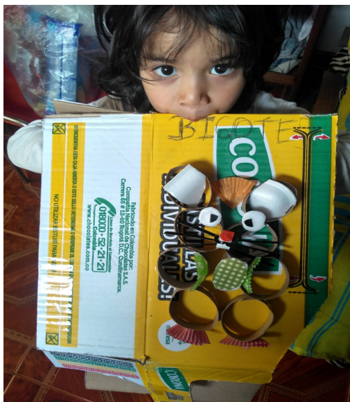
ilustración 5. actividad animales.

La sexta y última planeación se nombró “Vamos a Bailar”. Aquí la M.A.F reforzó tanto la actividad de danza, teatro y expresión corporal con el fin de darle una pequeña finalización a dichos procesos. Los ejercicios que la maestra planteo fueron del manejo de los diferentes niveles: bajo, medio y alto, involucrando saltos, giros y sonidos.