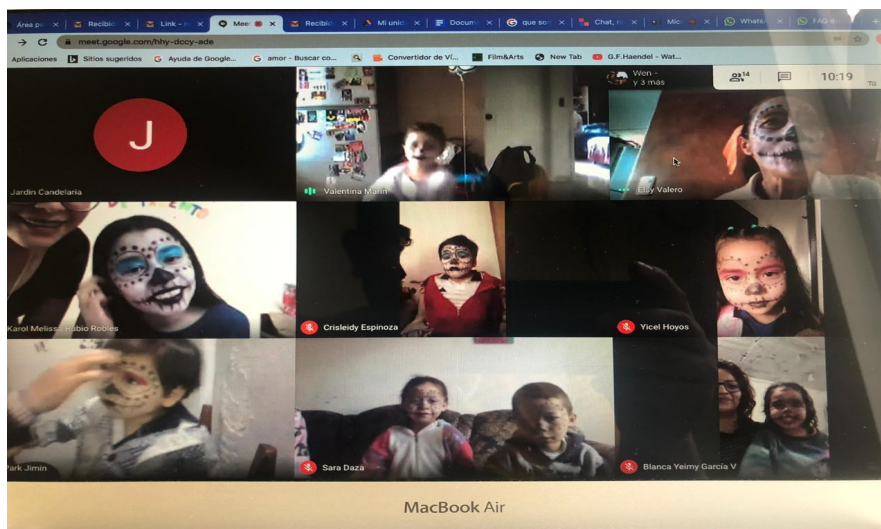
Ilustración 1. Encuentro virtual grupal.

las habilidades tanto de los niños como de los padres. En esta sesión algunos niños fueron maquillados por sus acompañantes y otros se maquillaron ellos mismos.