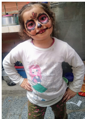
Ilustración 3. Actividad maquillaje

Estas imágenes son algunas de las que enviaron los padres de familia como evidencia de la sesión de maquillaje.