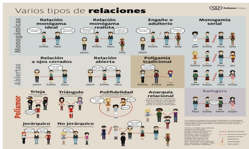
Figura 2. Tipos de relaciones entre personas

Fuente: https://poliamormadrid.org/ , (2020)