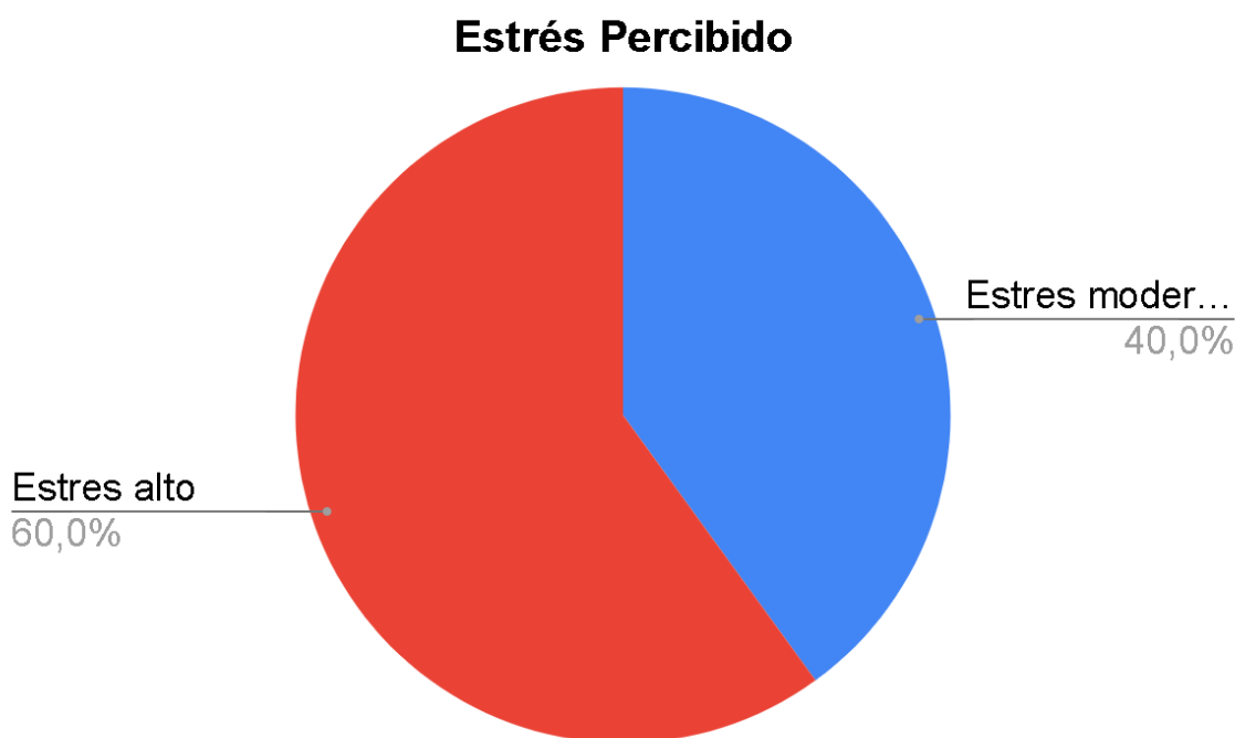
Figura 2.. Escala de estrés percibido (EEP) final

Finalmente, en el día 7 de la prueba piloto se dirigió la aplicación nuevamente de la escala de estrés percibido para tener un comparativo de los índices de estrés antes de comenzar la actividad y un después.