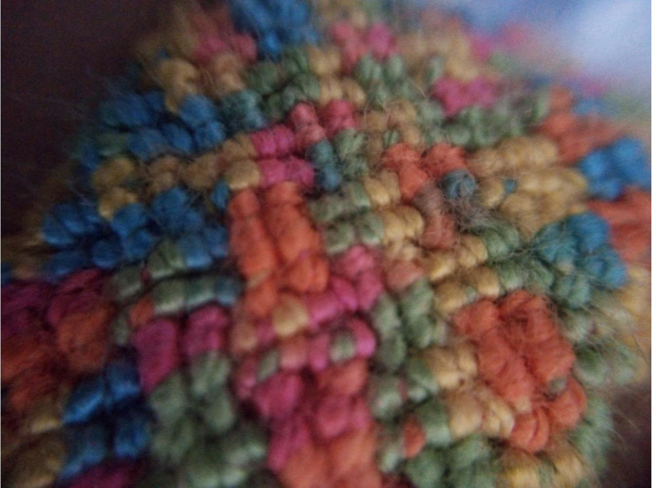
figura 15 Tejido realizado durante la cuarentena 2020