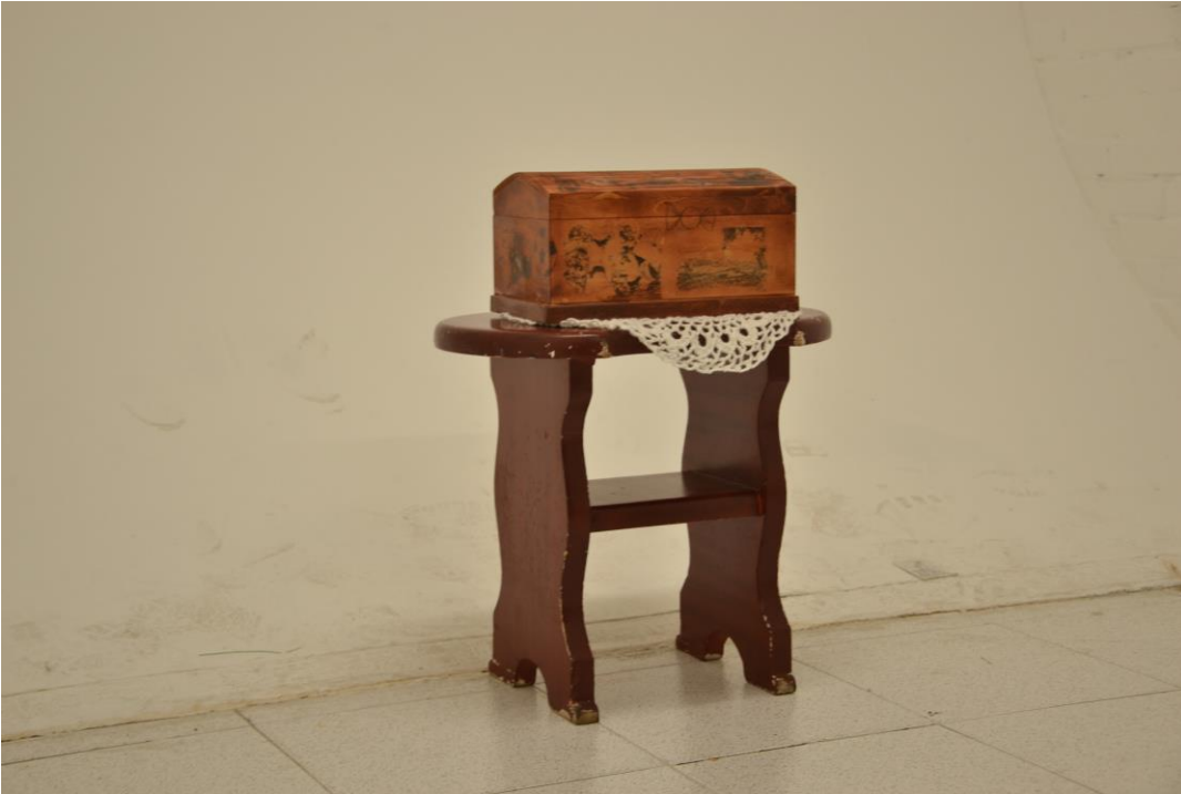
figura 6 Los recuerdos 2017