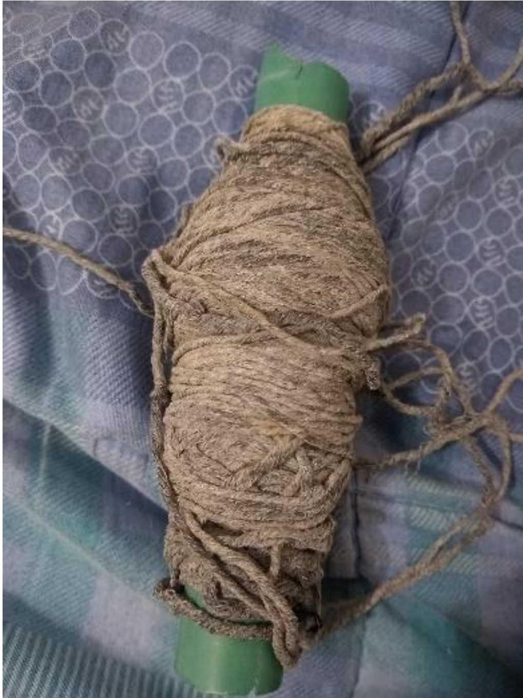
10 Cuerda encontrada en el desierto de Sabrinsky 2019