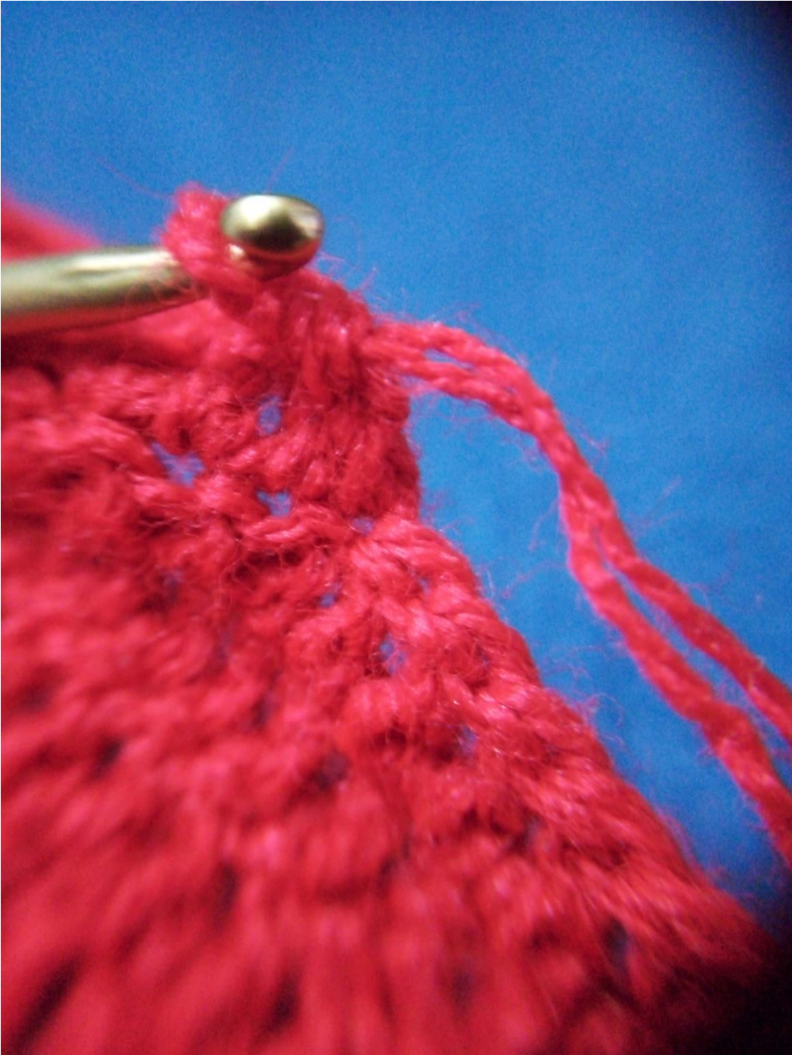
figura 14 Tejido Realizado durante la cuarentena 2020