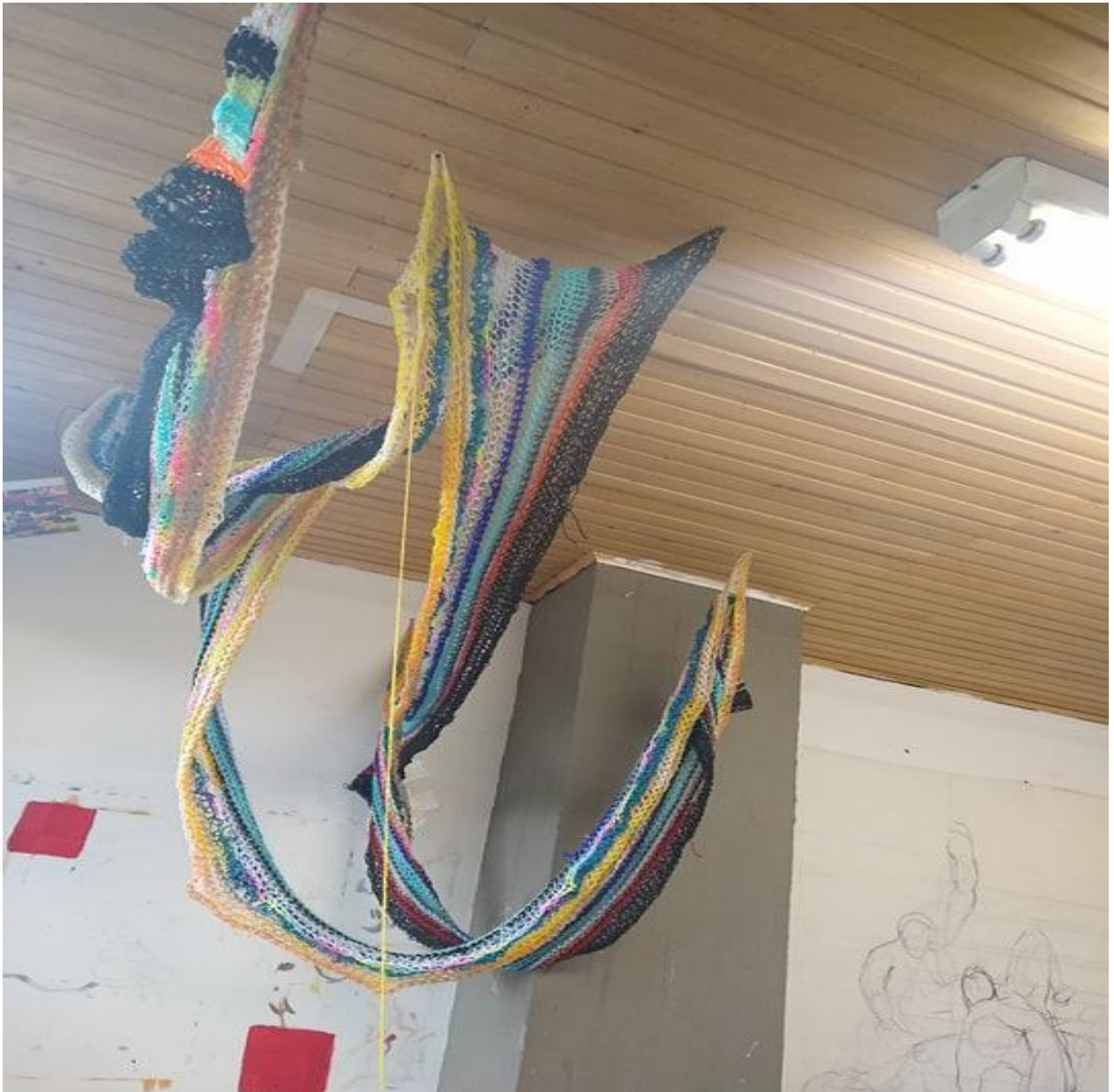
figura 7 Caminos tejidos 2019