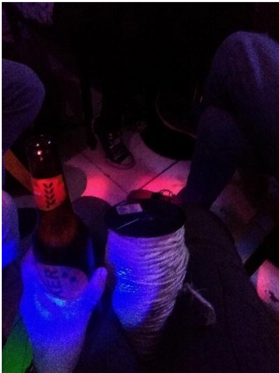
Figura 11 Obsequio que me dieron 2019