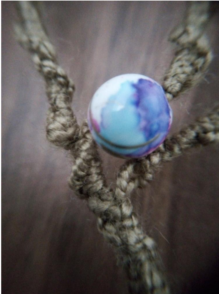
Figura 13 Tejido realiza en la Cuarentena 2020