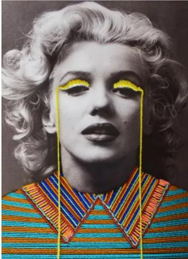
figura 4 Retrato de Marilyn Moroe intervenido por Victoria Villasana