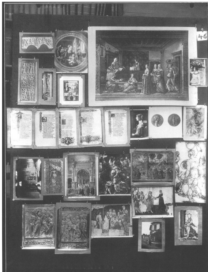
Figura 5 Atlas Mnemosyne 1924

toda su obra se ve de manera fragmentada la cual sugiere analogías. 9