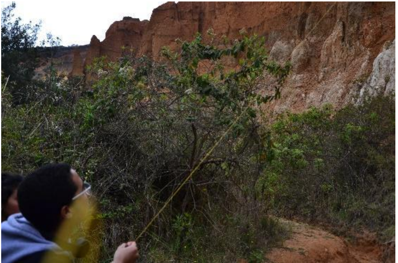
Figura 9 Desierto de Sabrinsky 2019