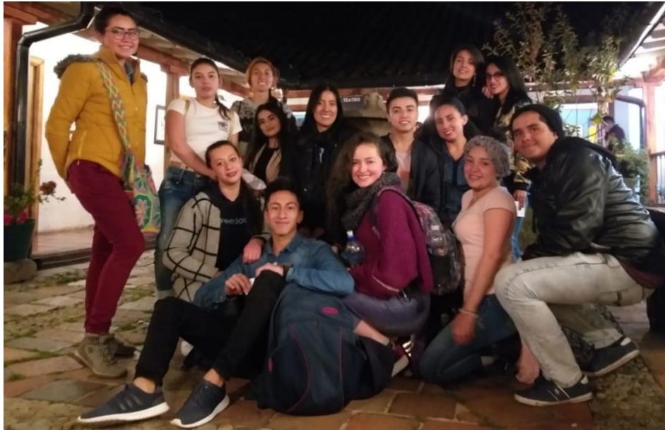
Fotografía de Teatro Contemporáneo 2019-1. Teatro La Candelaria.

Me pareció curioso que algunos interpretes cuando cantaban, llevaban el compás musical con alguna parte del cuerpo, para no perderse del ritmo o llegar a desafinar por nervios, lo cual me serviría para las canciones de mi personaje, pero seguía con la dificultad de la pronunciación en inglés.