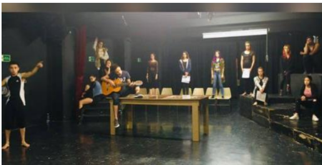
Curso de Teatro Contemporáneo 2019-1. Clase en el auditorio.