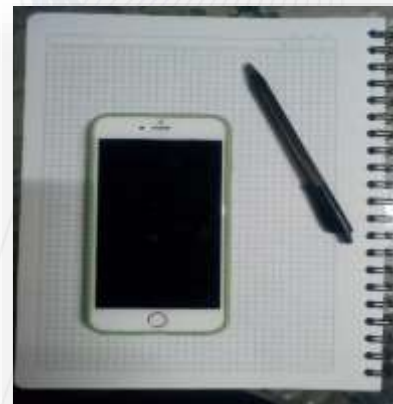
Figura 1.4- Soporte y apuntes (Muestra)

Krear Tech Mayorista. Fundada el xx de septiembre de 2004, ubicado en el centro comercial – Pasarela