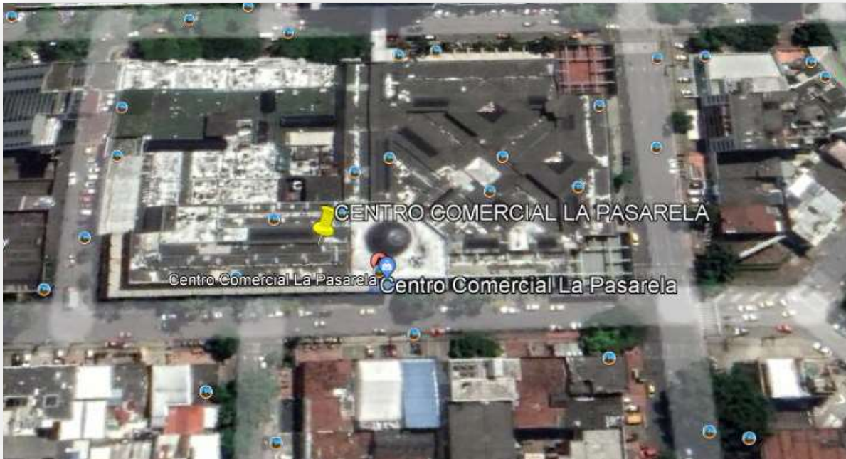
Figura 1.5- Ubicación demográfico