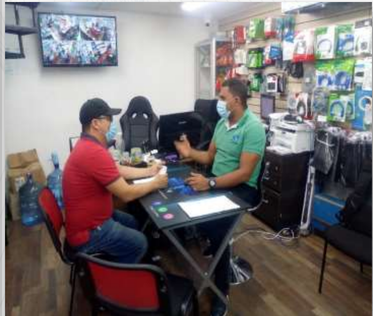
Figura 1.2- Análisis de la situación de la empresa (Muestra)