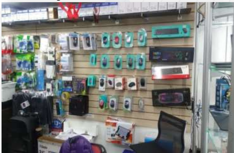
Figura 1.3- Artículos Tecnológicos