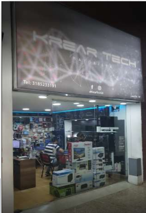
Figura 1.1 - Establecimiento