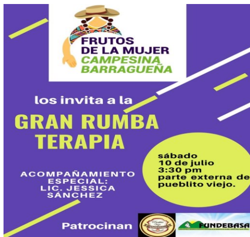
Figura 4: Invitación a la actividad del grupo.

Mediante la utilización del guion, referente a sus necesidades de interconectividad, en el grupo de 20 mujeres en su deseo de fortalecerse plantea la organización de un evento, el cual se refuerza mediante la divulgación en las redes sociales de la rumba terapia, por medio del uso de las TIC (Figura 4).