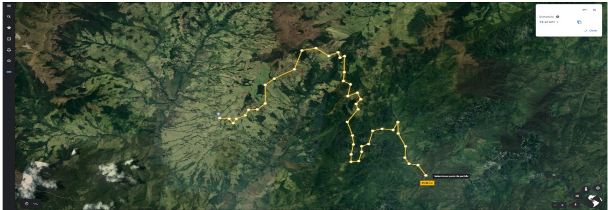
Figura 1: Mapa de ubicación del Corregimiento de Barragán (Valle del cauca)