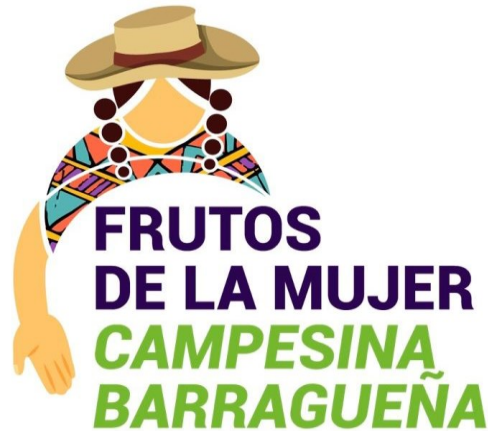
Figura 3: Logo del grupo

Creación del grupo y Diagramación: Acción y creación