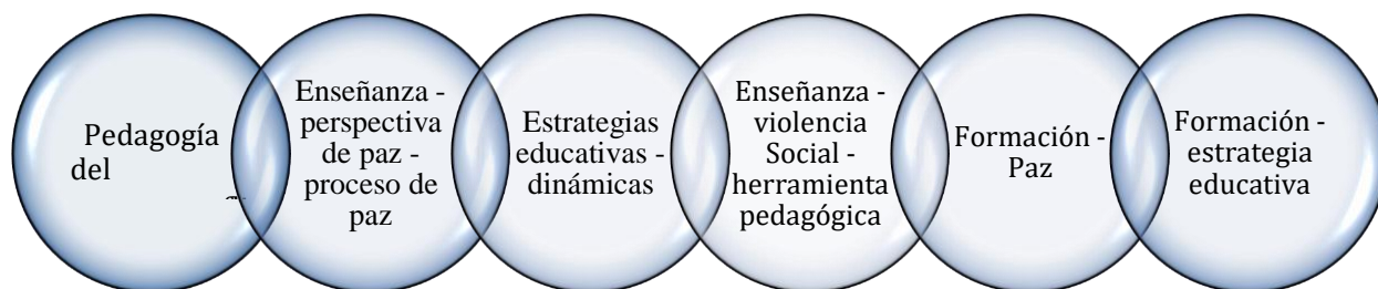
Figura 3. Sub-categorías emergentes

Para argumentar cada una de las categorías como las subcategorías identificadas, se presenta las respectivas figuras que, de forma directa argumenta los resultados alcanzados en el proceso investigativo presentado. En este sentido, en primer lugar, se presenta la figura número cuatro (4), titulada: Cantidad de documentos consultados y por categorías: