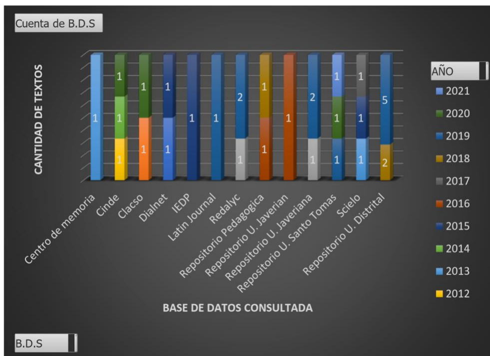
Figura 1. Base de datos por años

En relación a lo antes planteado, se presenta en la figura uno (1) mostrando la cantidad de documentos recopilados en las bases de datos consultados por años y la respectiva la distribución respectiva.