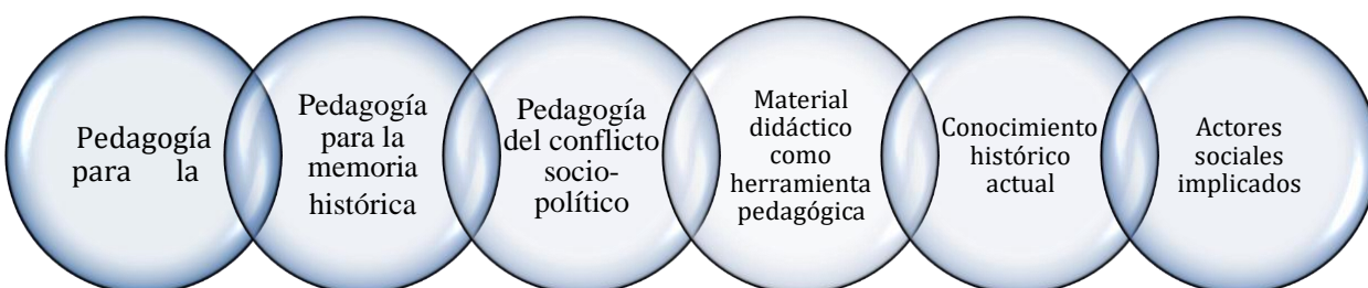
Figura 2. Categorías emergentes

Producto del respectivo análisis desarrollado con cada una de las treinta y cuatro (34) referencias consultadas (trabajos de grado, tesis y artículos científicos), se identificó seis (6) categorías de análisis que se presentan a continuación: