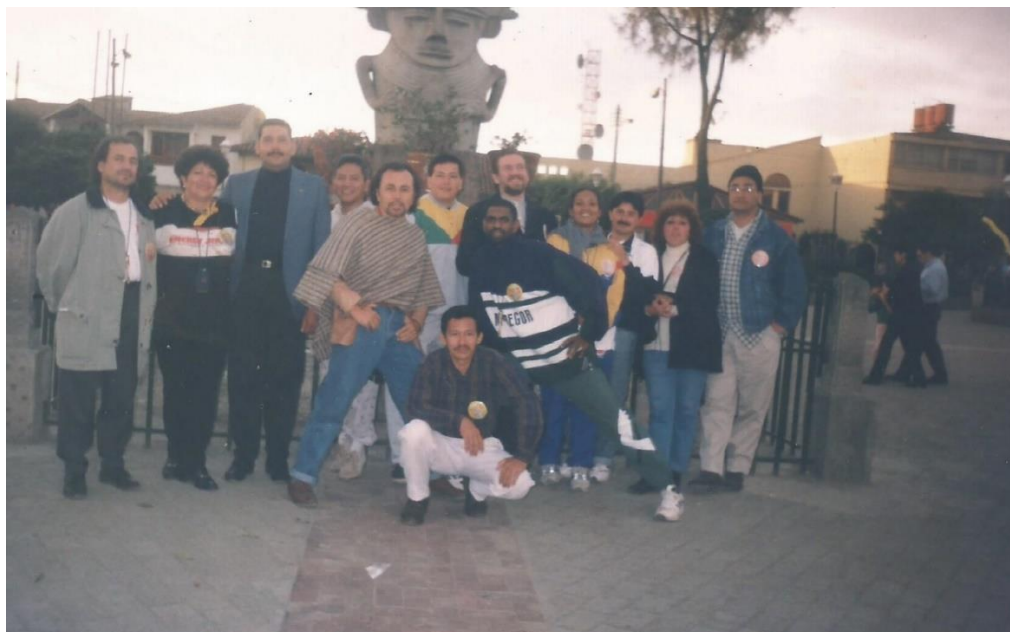
Foro taller “Los Danzantes”