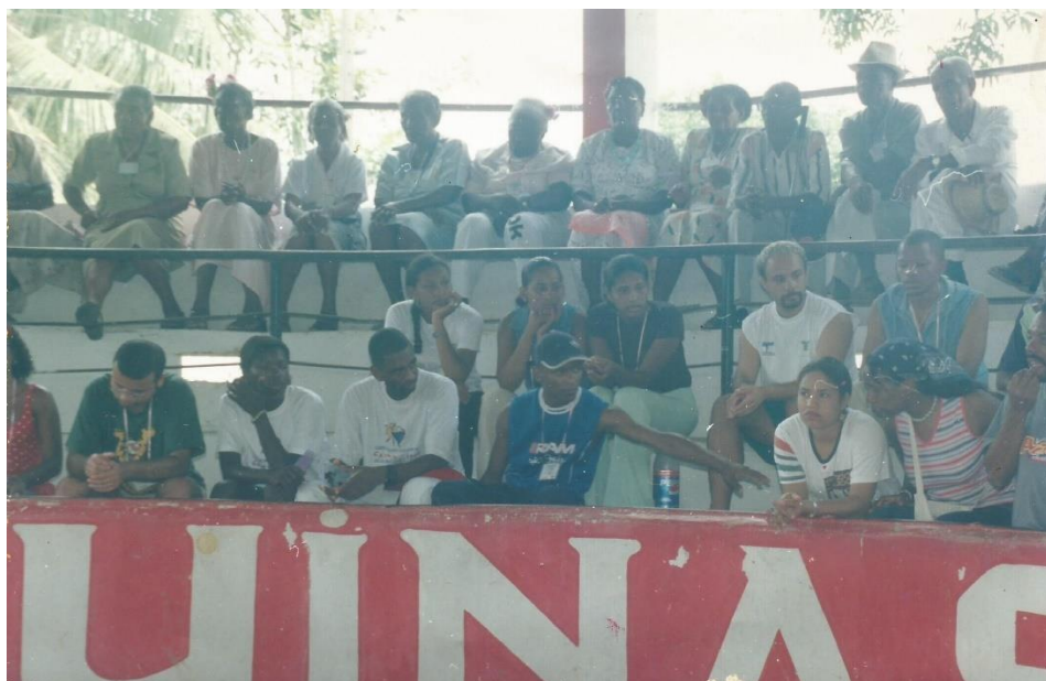
Foto en la gallera de María la Baja, en donde se hizo el conversatorio sobre Bullerengue año 2002