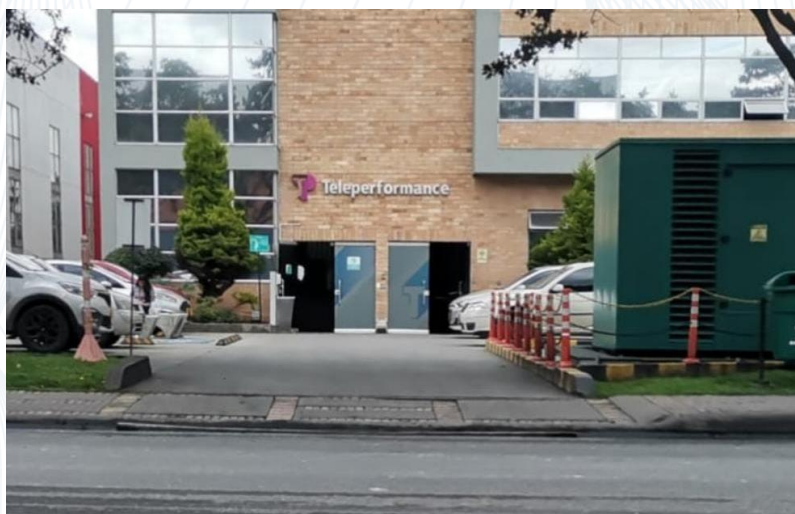
Ilustración 4. Call Center Teleperformance.