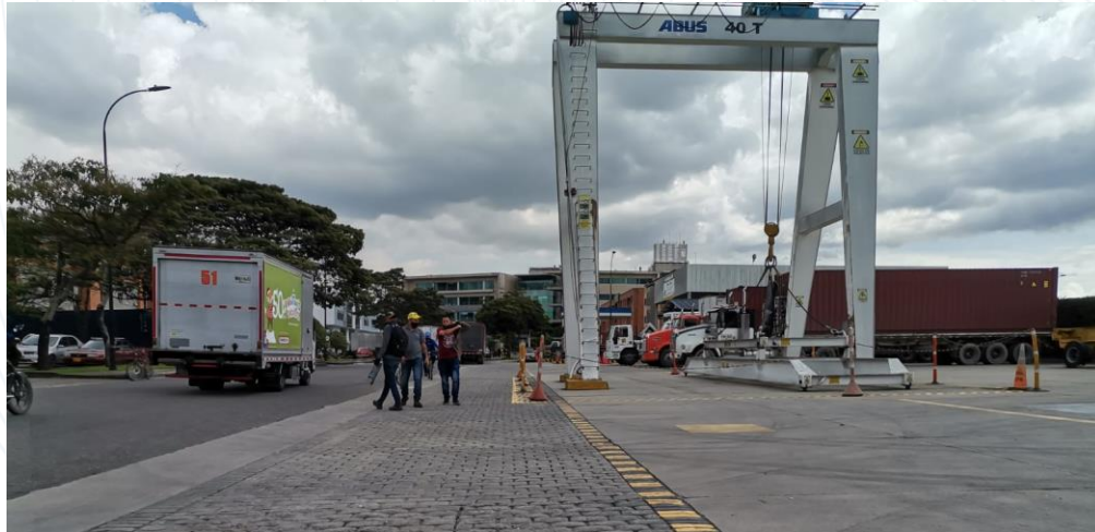
Ilustración 3. Servicios dentro la Zona Franca (Puente Grúa).

Las siguientes imágenes corresponden a la Zona Franca de Bogotá.