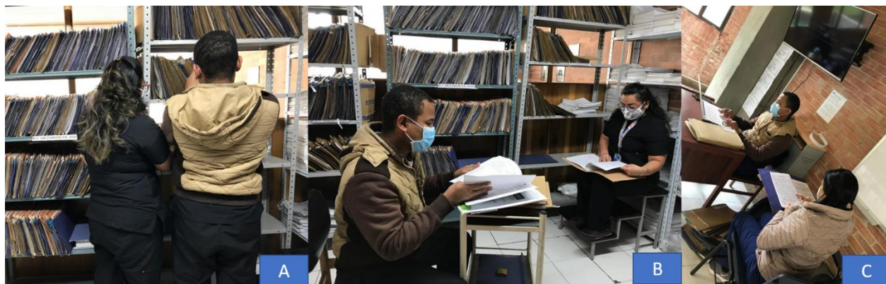
Figura 3: (A) búsqueda de las historias. (B)(C) Lectura y extracción de la información.

6. Se recopiló la información en la base de datos, con las variables sociodemográficas, sistémicas, locales, intraoperatorias y post operatorias definidas de importancia para el desarrollo de la investigación.