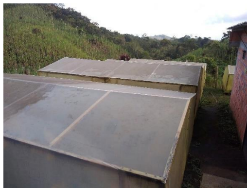
Figura 8. Marquesinas de secado