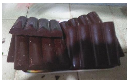
Figura 10. Pastilla artesanal