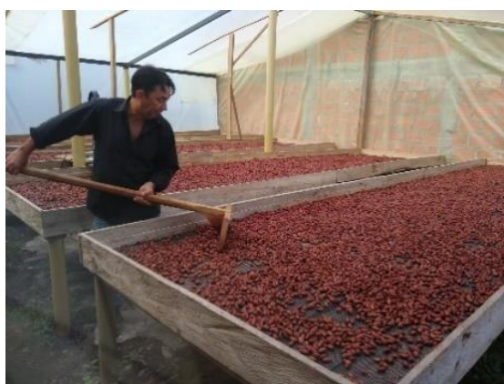
Figura 6. Volteo del grano de Cacao, central de acopio vereda las Camelias