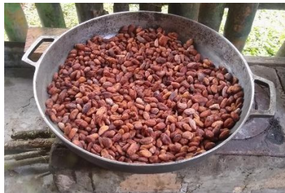
Figura 9. Proceso de tostado