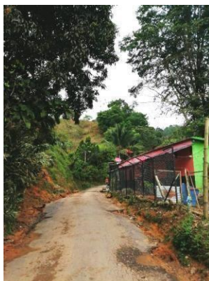
Figura 2. Inicio trayecto área rural