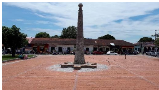
Figura 1. Plaza Mayor José Celestino Mutis