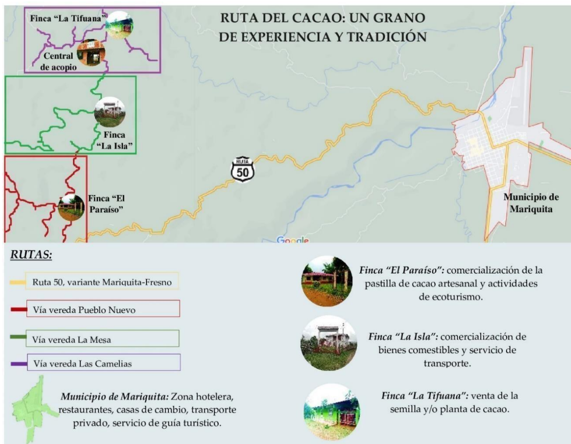
Figura 4. Diseño Ruta del Cacao: un grano de experiencia y tradición.

En la Figura número 4 se representa la Ruta del Cacao, la cual se estima que inicie en la vereda Las Camelias y finalice el centro poblado del municipio de Mariquita, abarcando un recorrido total de 12,68 km.