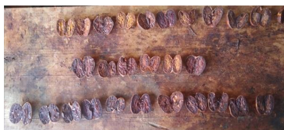
Figura 7. Prueba de corte