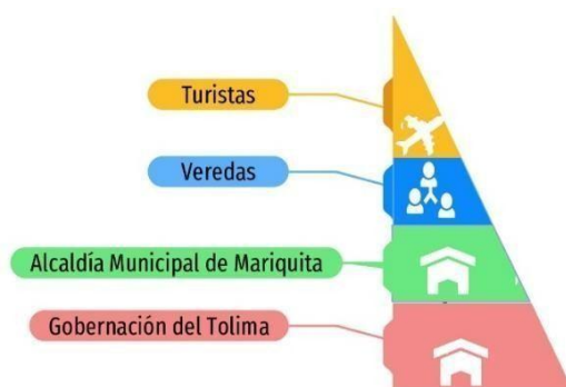
Figura 3. Jerarquía actores Ruta del Cacao