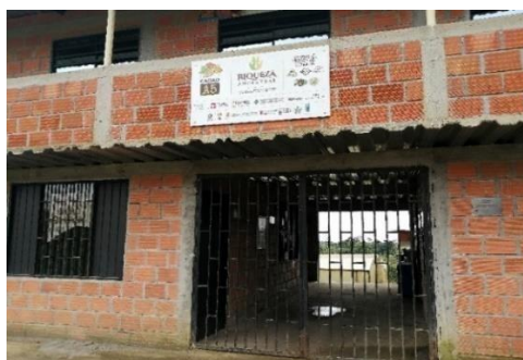
Figura 5. Central de acopio, vereda Las Camelias