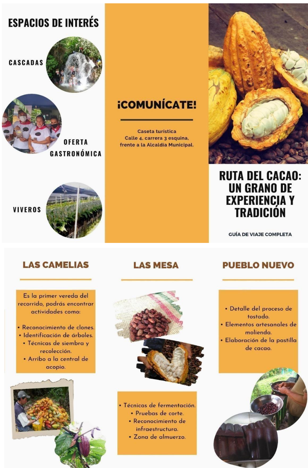
Figura 11. Oferta de actividad de la Ruta del Cacao: un grano de experiencia y tradición.