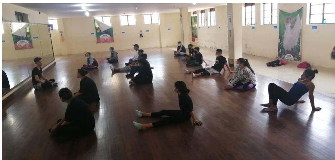
Ilustración 5. Sesión de estiramiento F.A.C.

En esta etapa nos volvemos expectantes por lo que puede suceder, surgió una necesidad del encuentro, del compartir, disfrutar y aprender. Regresaron 14 jóvenes al salón de clase, hubo una baja. Todos usamos el tapabocas y mantenemos el distanciamiento físico, para las sesiones presenciales proyectadas en 14 semanas con la expectativa de trabajar para cumplir las metas y superar obstáculos.