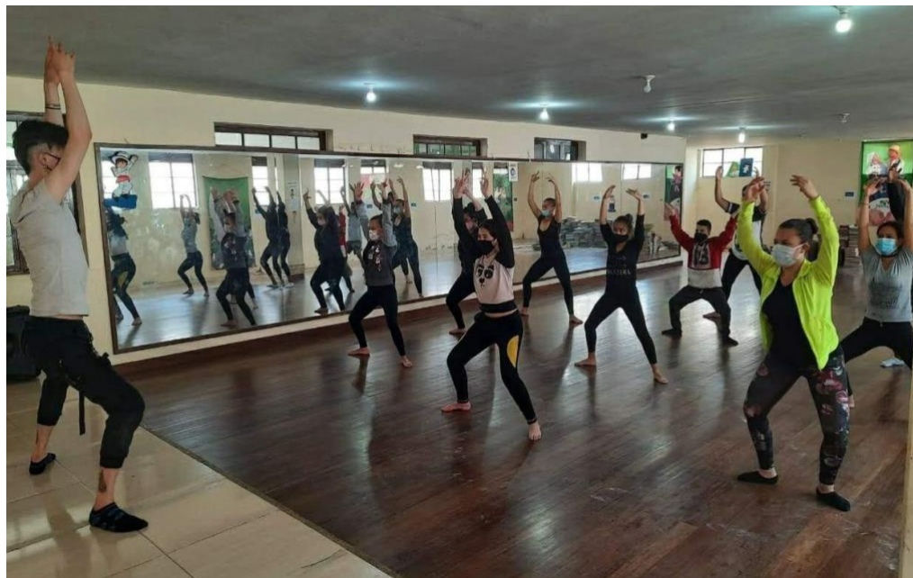
Ilustración 3. Fundación Artística y Cultural Chiminigagua.