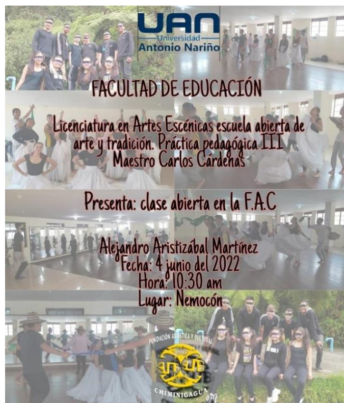
Ilustración 8. Póster muestra.

maestro pueda tener, porque faltando dos semanas para la muestra, al ensayo sólo llegan 3 parejas de las 8 parejas. Por lo tanto, se decidió no hacer una muestra final sino una clase abierta que refleje lo visto en todo el proceso de la práctica pedagógica.