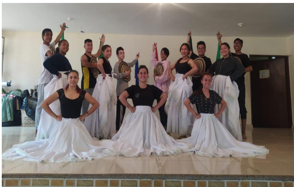
Ilustración 7. Preparación ejercicio montaje F.A.C.