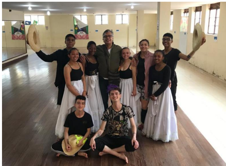
Ilustración 10. Clase Abierta F.A.C.