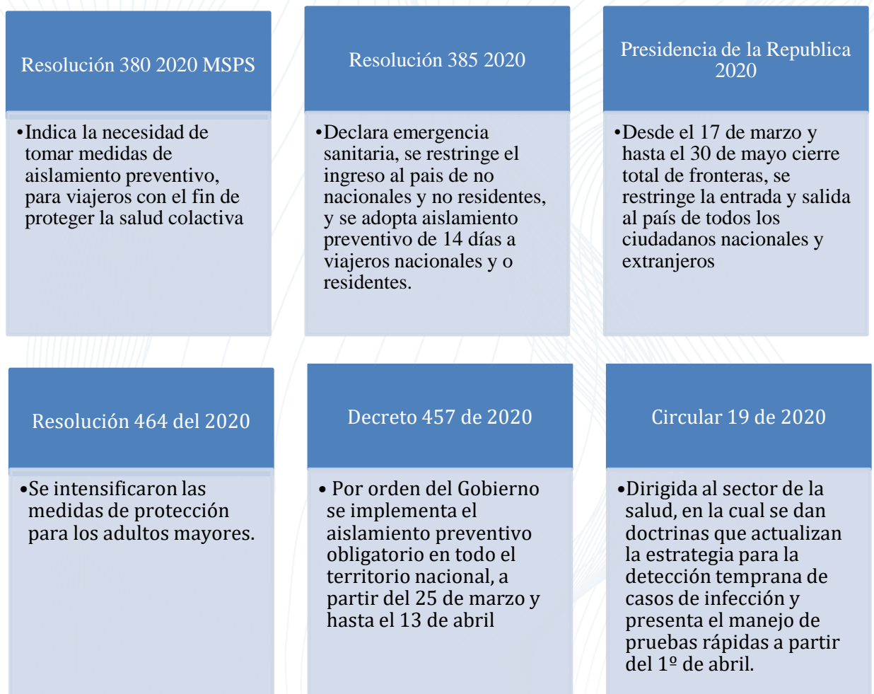
Figura 4. Resoluciones emitidas en la fase preparatoria, 2020 (presidencia de la república, 2020)

Luego de haber confirmado el primer caso en Colombia, el mes de marzo, día 6, finalizó la fase de preparación (en la que se fueron 8 semanas) y se elevó a la fase de contención, en la que se monitoreo cada uno de los casos reportados y se aplicaron mejores controles para minimizar la propagación del contagio en el país. El 12 de marzo fue necesario declarar la emergencia sanitaria lo que hizo que se prestara una atención más rigurosa a la contención de la propagación. Inicialmente el control se hizo de forma rigurosa a los viajeros que provenían de países que presentaron contagio como son, China, España Italia, y Francia.