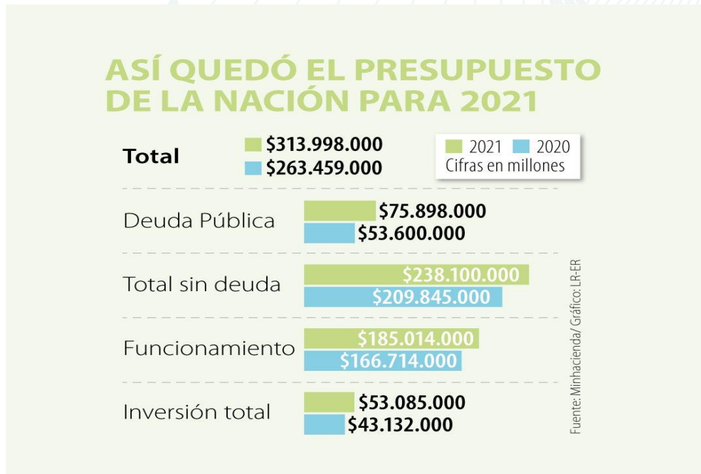
Figura 1. Asignación presupuesto Nacional para vigencias 2020 y 2021 Minhacienda

Teniendo en cuenta lo anterior se procede a realizar un análisis legislativo conforme a la aplicación de leyes emergentes enfocadas en la afectación del presupuesto en Colombia como acciones de impacto ante la emergencia de Covid-19 en el país, la primera modificación se identifica en la Ley 2008 de 2019 (Ley2008, 2019), el cual fija el presupuesto de rentas y recursos de capital del Tesoro de la Nación para la vigencia fiscal del 1 de enero al 31 de diciembre de 2020, en la suma ($271,713,994,711,741).