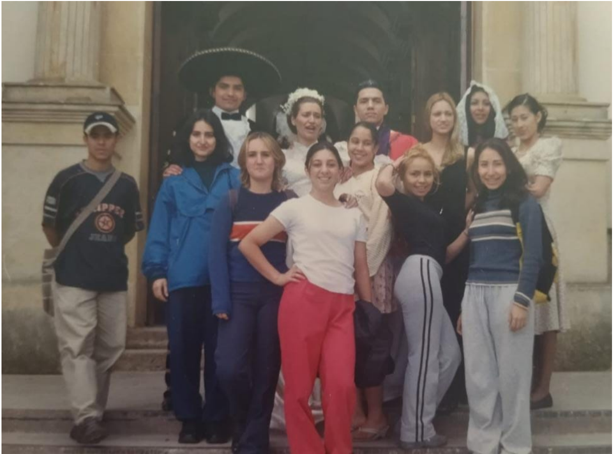
Foto de grupo de teatro del colegio

Nota: Posábamos al terminar una presentación