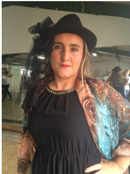
Foto mía en la escuela de teatro