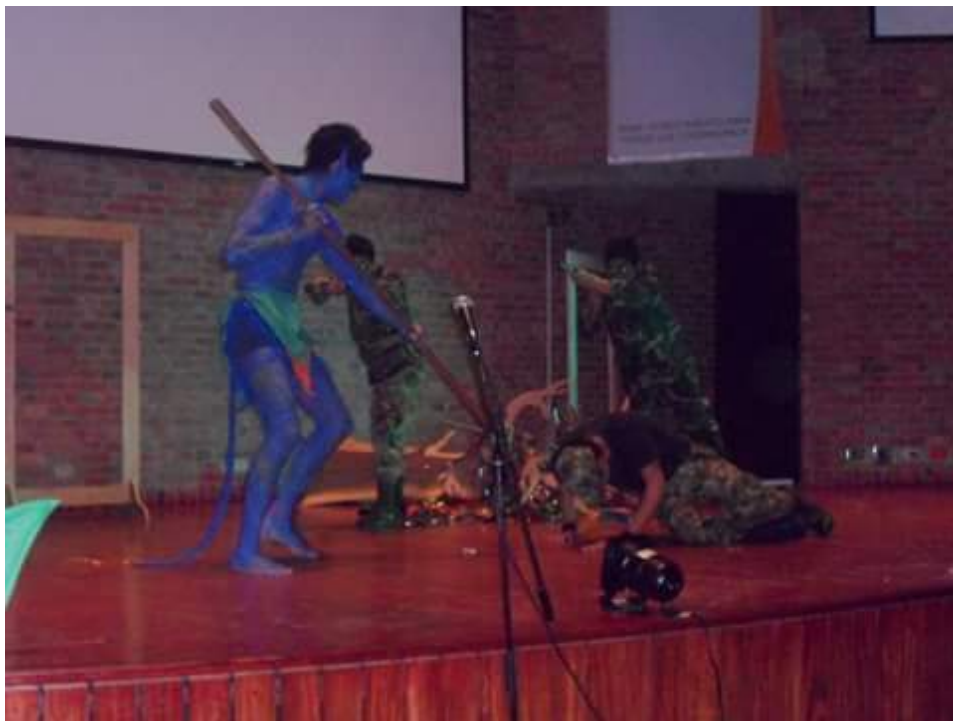
Foto de montaje escolar

Nota: Primeras representaciones en tarima