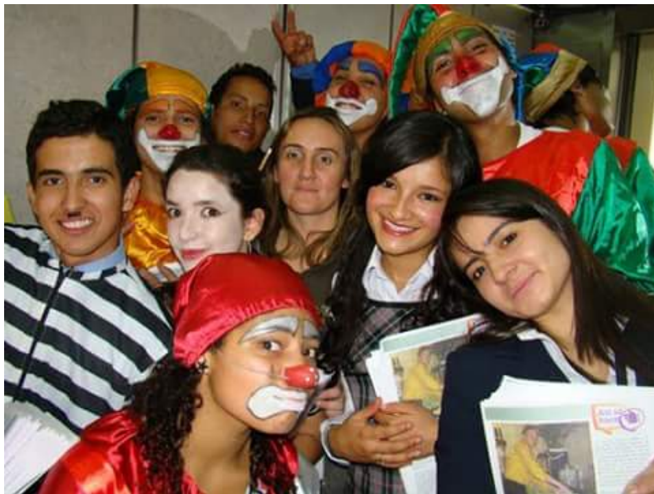
Foto del grupo teatral a mi cargo