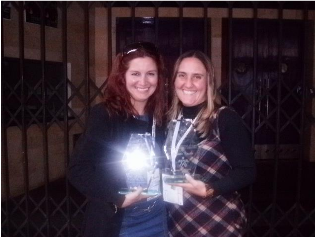
Foto de reconocimiento por parte del SENA

Nota: Toda una vida de entrega, esfuerzo y sacrificio.