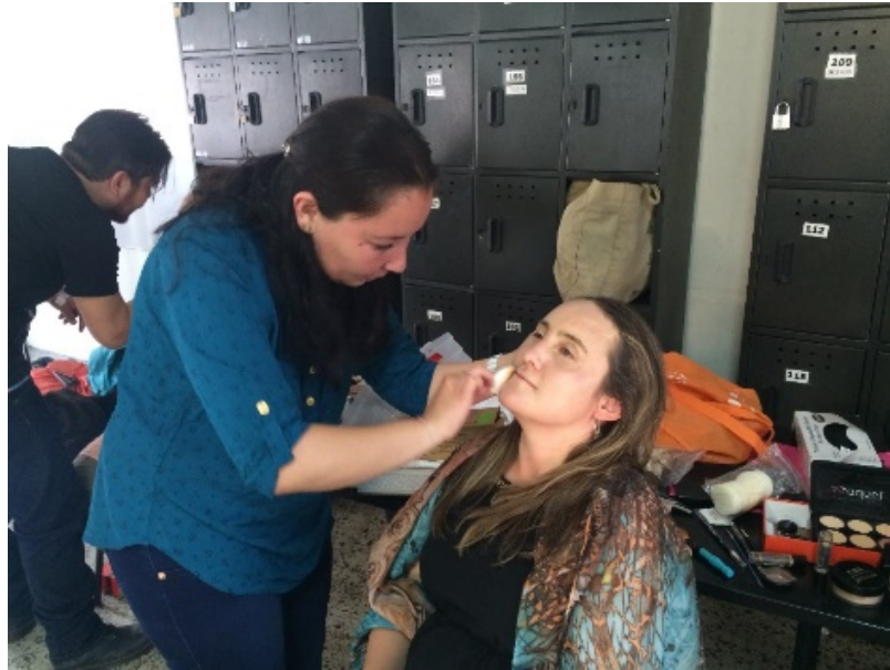
Foto de mi maquilladora y yo

Nota: Caracterizándome para un personaje