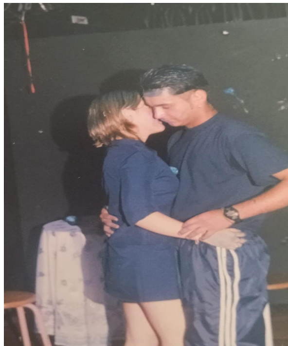
Foto de una pieza teatral

Nota: Desarrollando mi quehacer profesional de la mejor manera.