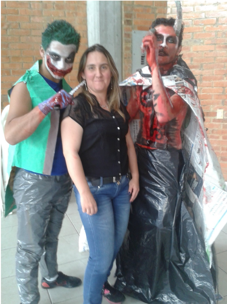
Foto mía con mis pupilos