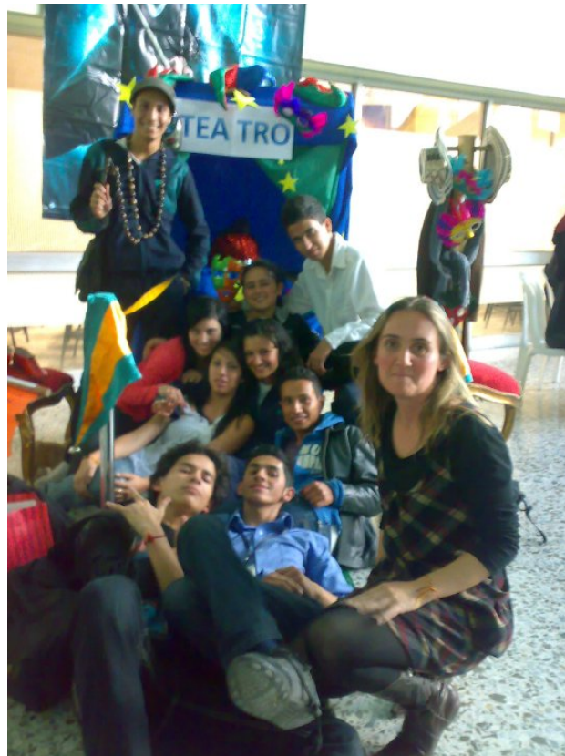
Foto del grupo teatral a mi cargo