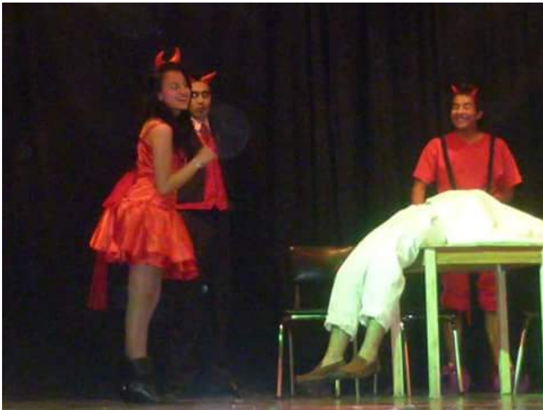
Foto de montaje escolar

Nota: Que seriedad y que alegría en escena.