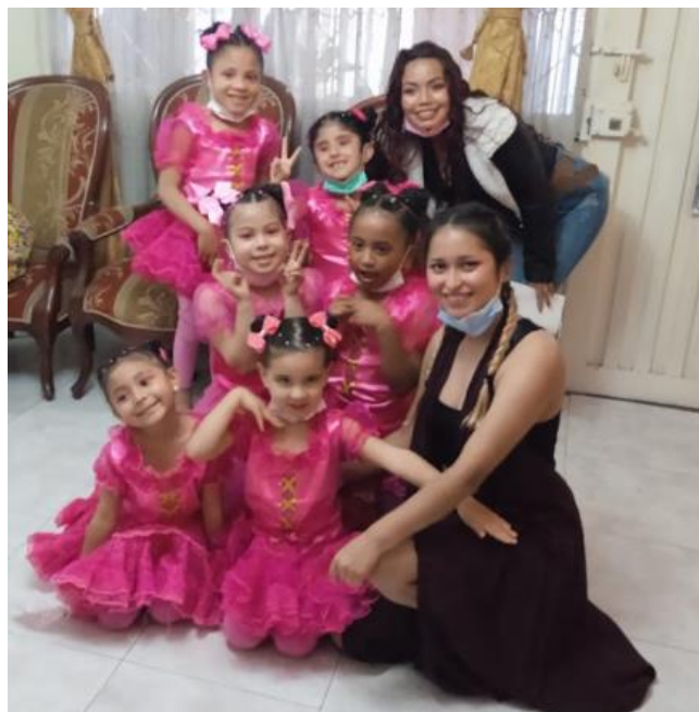
Ilustración 7. Grupo previo a la presentación.

Por último, presentamos una secuencia coreográfica de ballet en donde las niñas demuestran sus destrezas en equilibrio, coordinación, memoria y trabajo en equipo. En el anexo 3 se encuentra esta secuencia la cual logra evidenciar un avance entre la primera semana de clases y el día de la presentación se observa una conexión más fuerte con todo el proceso.