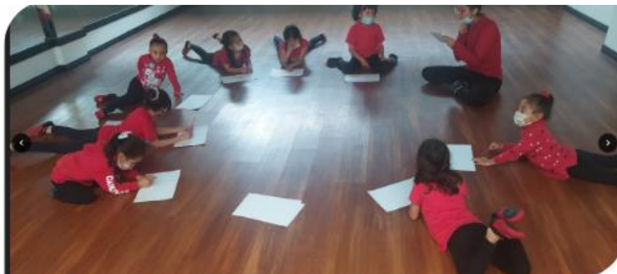
Ilustración 11. Ejercicio de la secuencia en papel.

Después del primer mes de prácticas, comenzaron a llegar muchas niñas entre ellas una chiquitina de 3 años, la cual me volvió a colocar otro reto, la niña no se integraba al grupo y por la edad quería correr y jugar, de lo contrario lloraba, por esta razón tuve que tomar la iniciativa de estar con ella en las coreografías y motivarla a hacer la clase. Comencé a incluir juegos mentales como lo fueron Mezu , chocolate , Don Federico , etc. Este tipo de juegos potenciaron la memoria y concentración de las niñas mientras ellas se divertían, cada vez era más común encontrarlas jugando y practicando sus posturas, era motivacional para mí, ver que las niñas llegaban con esa alegría y ganas de estar en la clase, preguntaban ¿Qué vamos a hacer hoy, profe? O ¿Profe, hoy podemos bailar el monstruo de la laguna ? Esa era una canción con la que tuvieron una conexión especial desde el año anterior.