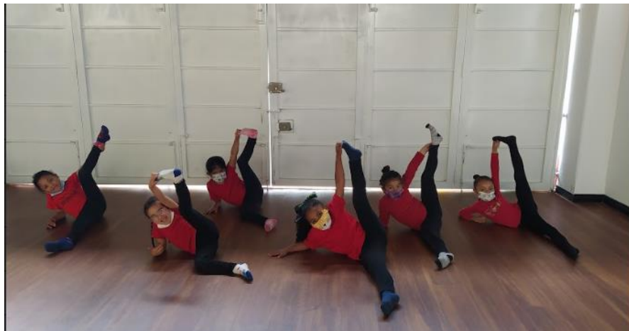
Ilustración 6. Fotografía de estiramiento.

Finalizando el mes de septiembre e iniciando el mes de octubre, comenzamos a prepararnos para la gala de fin de año que presenta Acto Kapital a los padres de familia, para esto, se consideraron las canciones con las que las niñas tuvieron una mejor conexión, por esta razón, iniciamos a reforzar y trabajar en la bienvenida , esta era una danza que manifestaba un saludo al espacio y lo que podíamos pasar en este, para las niñas el que fuera repetitivo las agotaba mucho y manifestaban su desinterés de vez en cuando, sin embargo se generó estímulos de felicitación, para que lográramos sacar adelante la coreografía y presentarla.