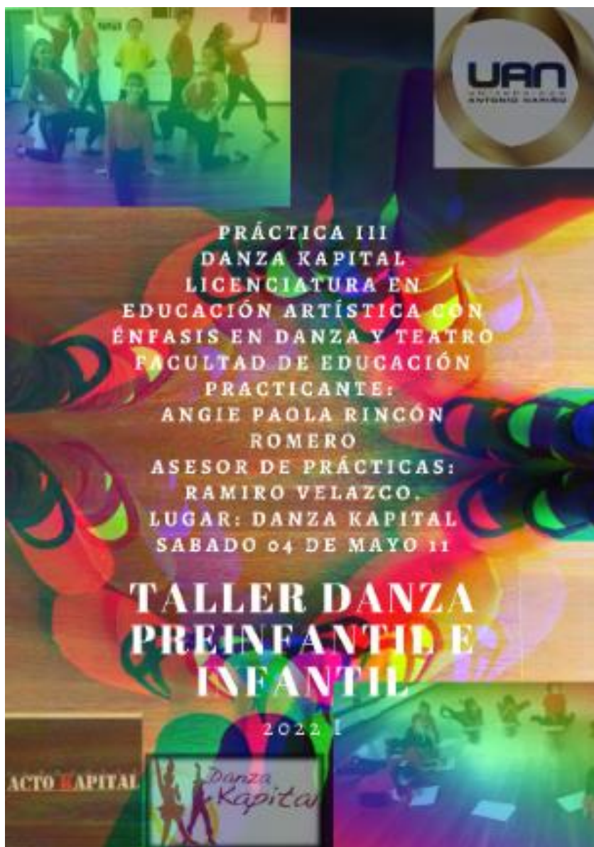
Ilustración 13. Afiche de la presentación final.