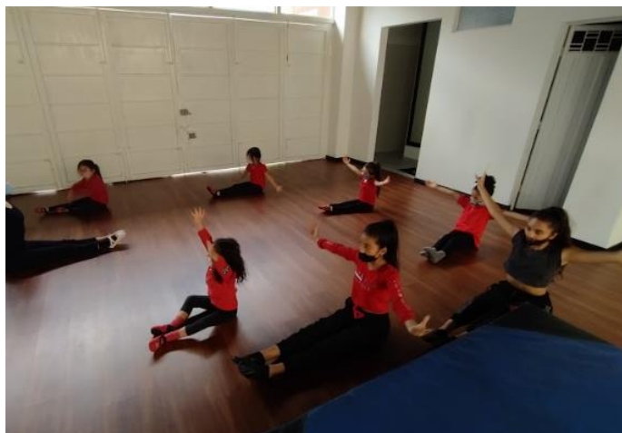
Ilustración 9. Estiramiento.

Por esta razón, empecé a buscar nuevas estrategias y ritmos musicales para trabajar con las niñas y profundicé en el grupo musical Canticuenticos que manejan letras infantiles y ritmos folclóricos y latinos. Esto me llamó mucho la atención, porque las letras conectaban con las niñas por la dramatización que generaba el grupo y su contexto frente a los animales.