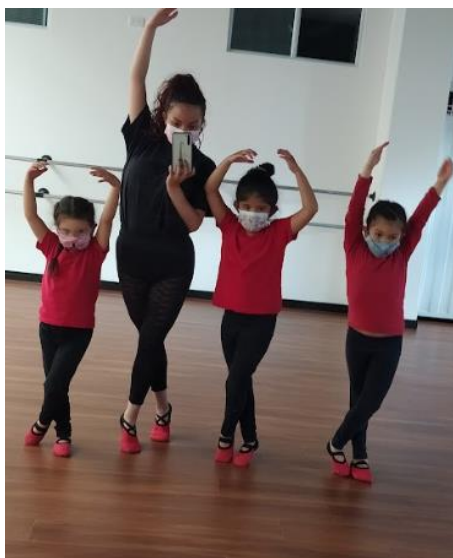
Ilustración 3, Actividad de danzas.

clase su curiosidad por el mundo externo era amplio, fueron dos años de cuarentena y clases virtuales en donde eran ellas con la gran ayuda de sus papás a través de una pantalla, el estar en un parque lleno de personas y animales les permitió explorar, observar y conocer, poder darnos las manos hacer un círculo, abrazar un árbol y conocer a otras personas, lo cual, nos acercó como grupo.