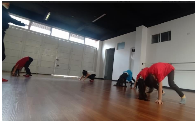
Ilustración 10. Creación del Monstruo de la Laguna .