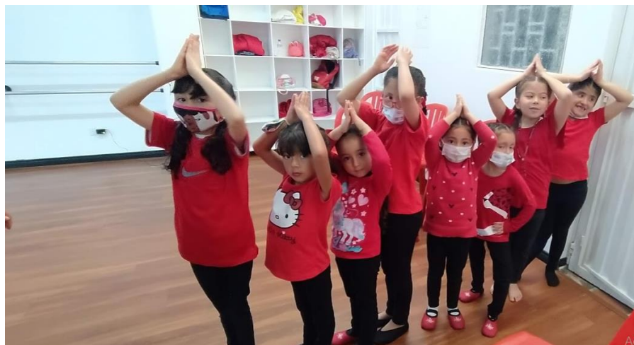
Ilustración 14. Clase abierta de junio de 2022.