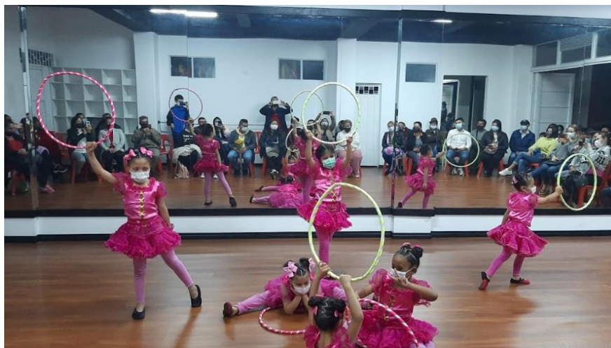
Ilustración 8. Secuencia de ballet por las niñas del grupo Preinfantil.