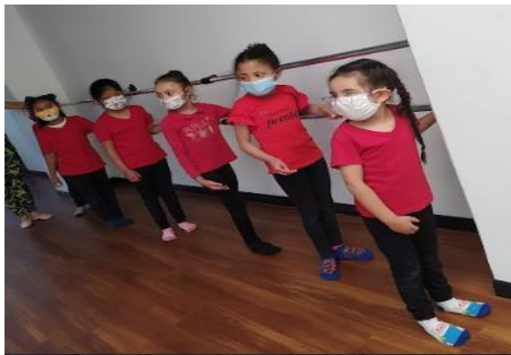
Ilustración 4. Trabajo de barras posiciones de miembros inferiores.

Si en el parque estar acostado en el suelo era divertido, en el salón se convirtió en lo más común, en el transcurso del mes de septiembre comenzamos a adoptar una estructura de clase, en donde se iniciaba con un calentamiento que se establece con una canción de bienvenida a las niñas y una ronda infantil, luego hacíamos una rutina de ballet en donde aprendíamos las posiciones de brazos y piernas y algunos giros, posibilitábamos intervalos entre una actividad y otra para despejar distracciones y adquirir una mejor atención y concentración, entonces se enumeraron las partes del salón y esto nos permitió trabajar la memoria y despejarnos, corríamos o hacíamos como diferentes animales para pasar de un punto a otro, según la instrucción de la profesora, luego de cada intervalo de descanso (puntos enumerados, interpretaciones de animales y cogidas) hacíamos pequeñas secuencias coreográficas en donde se lograba hallar qué ritmos musicales les llamaba más la atención a las niñas, para traerlos más seguido a la clase y finalizamos con el estiramiento.