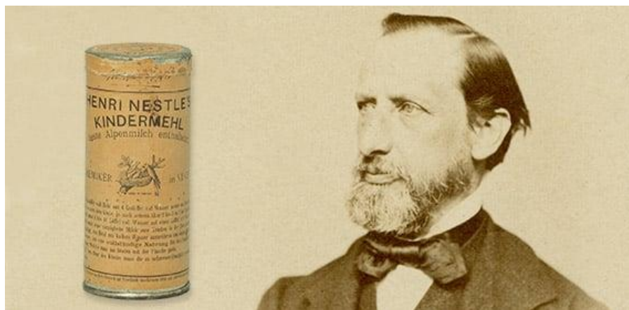
Imagen 1: Henry Nestlé y su primer producto