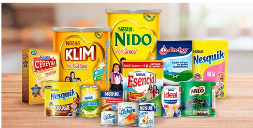
Imagen 2: Variedad de productos