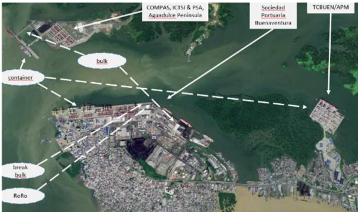
Figura 3. Puerto Buenaventura

Nota; Elaborado bajo la referencia de Logistics Capacity Assessment, (2022)