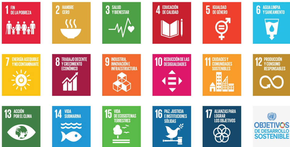
Desarrollo Sostenible y sus objetivos