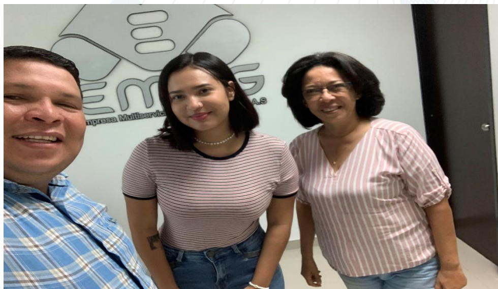
Figura 5. Visita académica