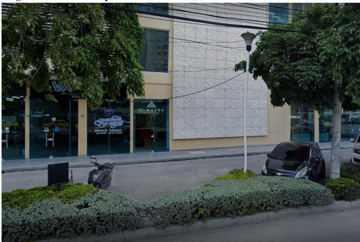
Figura 2. Ubicación empresa EMAG S.A.S