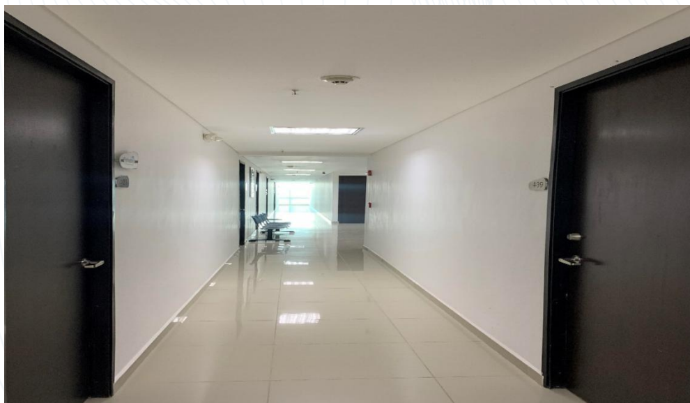
Figura 3. Instalaciones