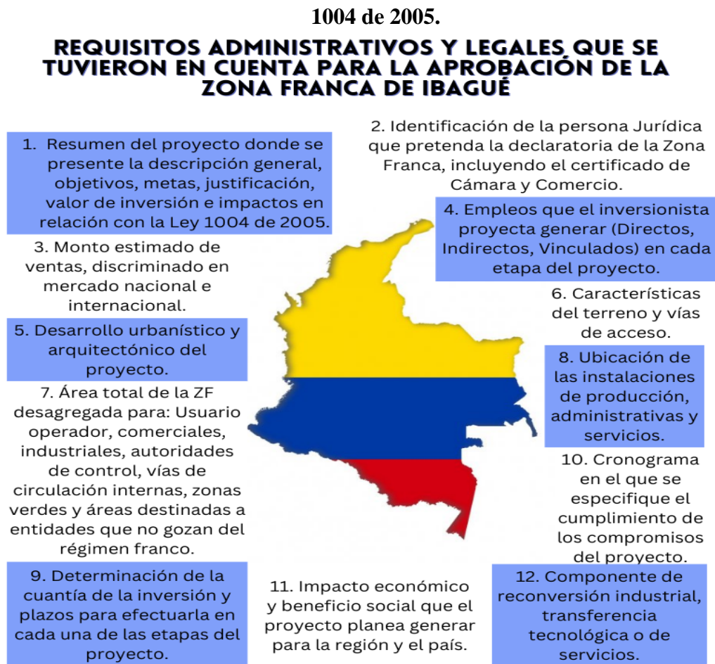
Figura 2. Requerimientos para la aprobación del proyecto Zona Franca Ibagué según la Ley