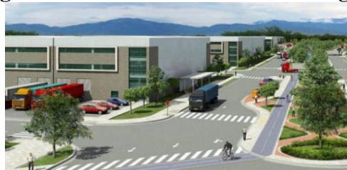
Figura 1. Diseño Zona Franca de Ibagué

Siete años después, es decir, para el 2014, el ambicioso proyecto ya contaba con 10 empresas interesadas y que, según los estudios, para ese momento se requerían alrededor de $20 millones de dólares para su adecuación y puesta en marcha, que se suponía debía estar listo a los dos años siguientes (Portafolio, 2014). Algunas de las posibles empresas interesadas eran NAVITRANS, INTERASEO, EXEKABEL, KENWORTH, GECOLOSA CAT y FRESENIUS MEDICAL CARE (Aplicaciones Ministerio de Comercio, Industria y Turismo, 2012, pág. 30)