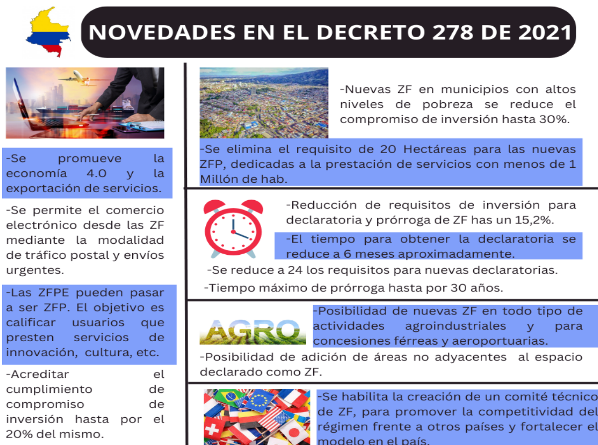
Figura 3. Modificaciones al régimen de Zonas Francas en Colombia.

Elaboración propia. Fuente: Ministerio de Comercio, Industria y Turismo, (2021).