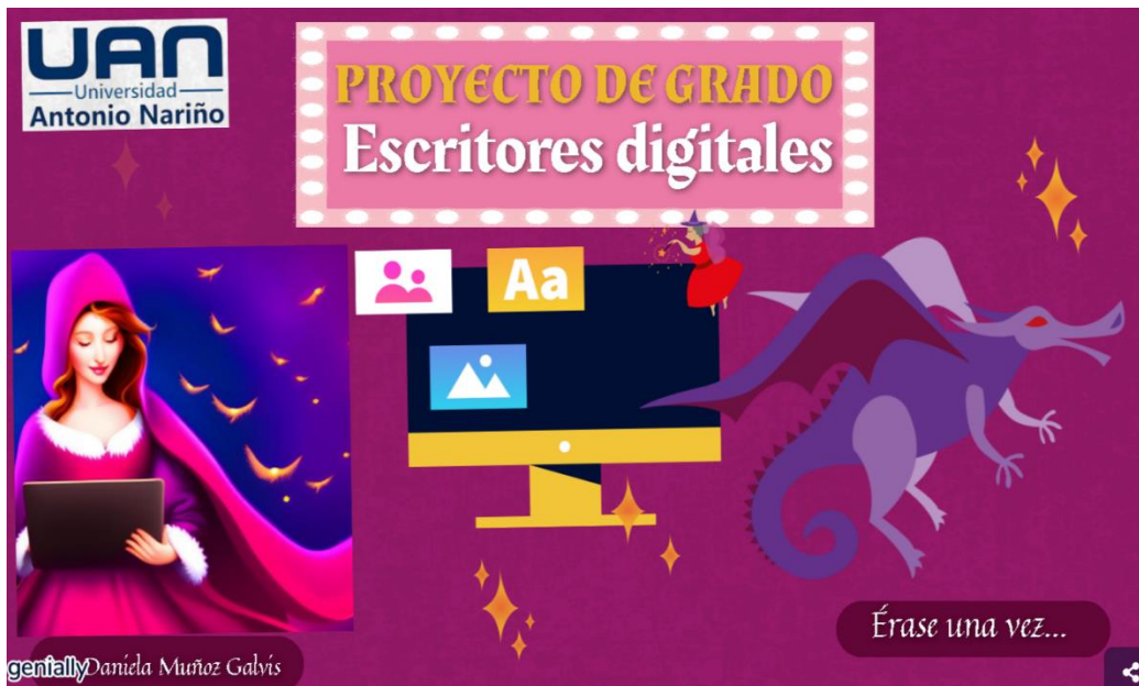
Figura 3. Evidencia de presentación del OVA.

evaluaciones. El contenido está dividido en dos temas: Escritura mediada por la multimodalidad y Plataforma Wattpad. Estructurados desde un primer momento cognitivo al presentar la información para el estudiante, de acuerdo a su función y manejo. Adicionalmente, al finalizar el recurso, el estudiante encuentra y aplica un test cuyo propósito es determinar la recepción del tema y los conocimientos que adquirió durante las sesiones 2 y 3 (Ver Anexo 2).