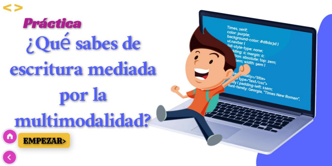
Figura 4. Evidencia de evaluación no cuantitativa.

De igual forma, la evaluación no cuantitativa se encontrará al final de la etapa teórica (concepto, función, manejo) de la escritura mediada por la multimodalidad y la plataforma Wattpad conformada por 4 preguntas relacionadas con la información presentada en las implementaciones teóricas. Consiste en que el estudiante de acuerdo con la pregunta seleccione una opción. Si la respuesta fue contestada correctamente, el OVA seguirá direccionando a la siguiente pregunta hasta dar por terminadas las preguntas. En cambio, si la respuesta del estudiante fue incorrecta, aparecerá una imagen de error y deberá hacer clic en la interacción con la forma de una flecha, volviendo a la pregunta y teniendo la opción de contestar de nuevo. Al concluir las preguntas, se presenta una interacción en forma de flecha que dirigirá al estudiante a la página final, donde tendrá la opción de reiniciar todo el proceso de aprendizaje en el OVA si así lo desea.