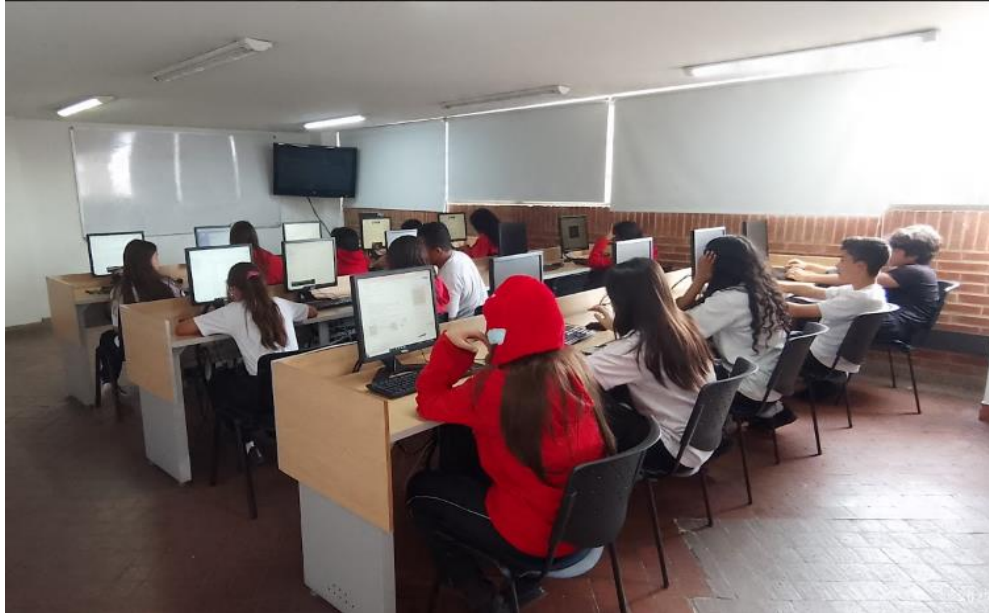
Figura 2. Evidencia de la población de grado octavo