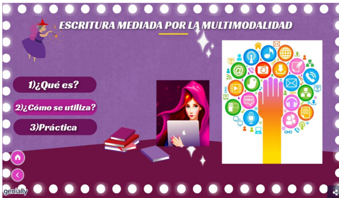
Figura 1. Evidencia de la escritura mediada por la multimodalidad a través del OVA.

En la segunda fase de planeación se estimaron dos sesiones de dos horas. Como trabajo autónomo, la docente analizó la prueba diagnóstica de escritura por medio de la rúbrica evaluativa y determinó los resultados obtenidos de cada estudiante. En la primera sesión la docente explicó a los estudiantes el concepto, función y manejo de la escritura mediada por la multimodalidad por medio de un Objeto Virtual de Aprendizaje (OVA) (Ver anexo 2); la docente en la segunda intervención, enseñó a los estudiantes el concepto, función y manejo de la plataforma Wattpad a través del mismo OVA. En cada implementación se les explicó primero el tema teórico y se implementó una actividad en la que utilicen los conocimientos aprendidos.